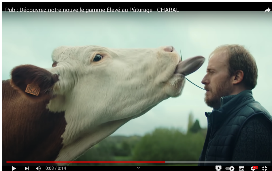
Figure 2. Image de la publicité Charal de 2021.

Enfin une thématique qui nous paraît importante à étudier est les conditions de vie de l'animal et la façon dont Charal en parle ou en fait abstraction. Dans notre corpus 10 publicités sur les 11 publicités ne montrent pas l'animal vivant ou n'en font pas mention. Dans les publicités, seule la viande est mise en scène et on parle seulement de l'aliment transformé. C'est une stratégie qui me semble aller avec la distanciation de tout ce qui rapporte à l'animal décrit par Fischler (2013). Néanmoins, la publicité de 2021 se détache des autres publicités. Cette publicité pour une nouvelle gamme est différente de toutes les autres à ce sujet. Premièrement la gamme de viande s'appelle "Élevé au pâturage", à travers le nom on parle des animaux et de leurs conditions d'élevage.