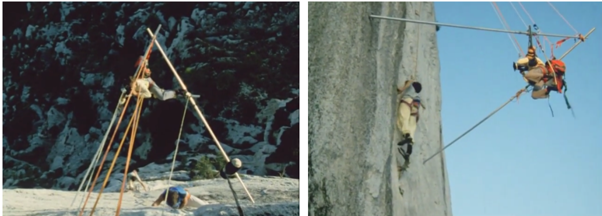
Utilisation d'une chèvre métallique pour filmer en paroi. 15

Dans Histoire d'une passion , un documentaire sur les coulisses du film Passions extrêmes (1989) avec le même Patrick Edlinger, nous assistons à la mise en place d'une « louma », une grue de plusieurs mètres de longueur, fixée sur une plateforme et qui permet de réaliser des travellings plus fluides.