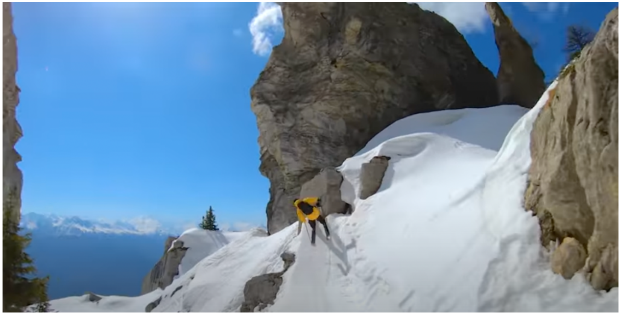
Candide Thovex prend appui sur un rocher pour effectuer sa figure aérienne. 88