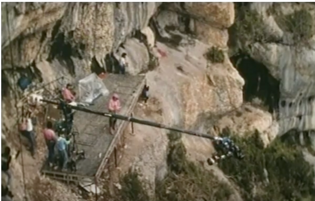
Utilisation d'une louma pour le tournage de Passion extrême de Georges Auzolat. 16

Dans Histoire d'une passion , un documentaire sur les coulisses du film Passions extrêmes (1989) avec le même Patrick Edlinger, nous assistons à la mise en place d'une « louma », une grue de plusieurs mètres de longueur, fixée sur une plateforme et qui permet de réaliser des travellings plus fluides.