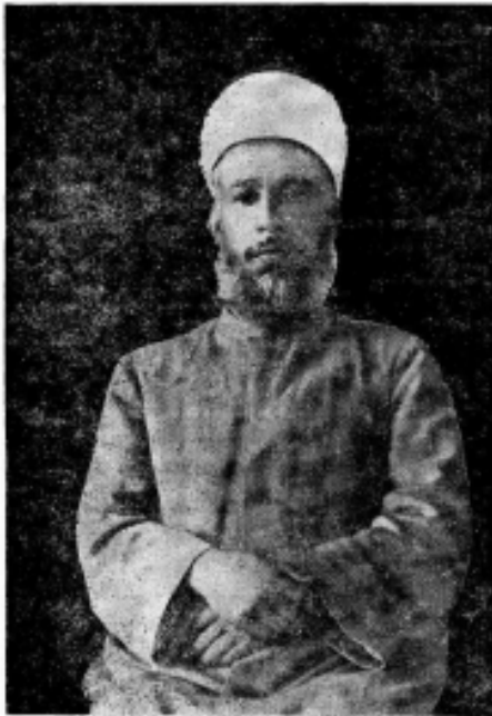
تروي بهه لنداوى في نباد الجيهه خيرآ كثيرا من النسلين والعمال

المحوم الشيخ عز الدين القسام ، اجتهد ومات في سبيل فكرته رحمه الله لقد كان مسلما صحيح الاسلام