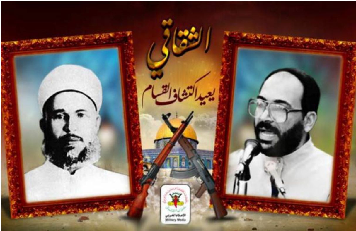
4 al-Qassām et Shiqāqī (fondateur du MJIP) 660