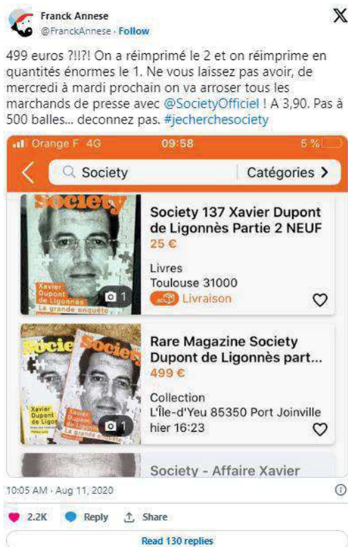
Tweet de Franck Annese