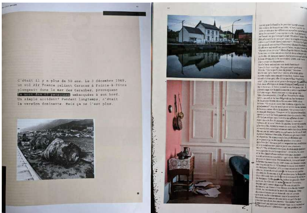
Deux pages de l'intérieur du numéro « best of » cold cases de Society .

Appel à l'imaginaire de l'enquête avec une typographie ressemblant à celle des machines à écrire et des taches d'encre