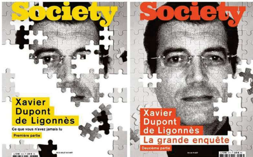
Couvertures des deux numéros de Society consacrés à Xavier Dupont de Ligonnès