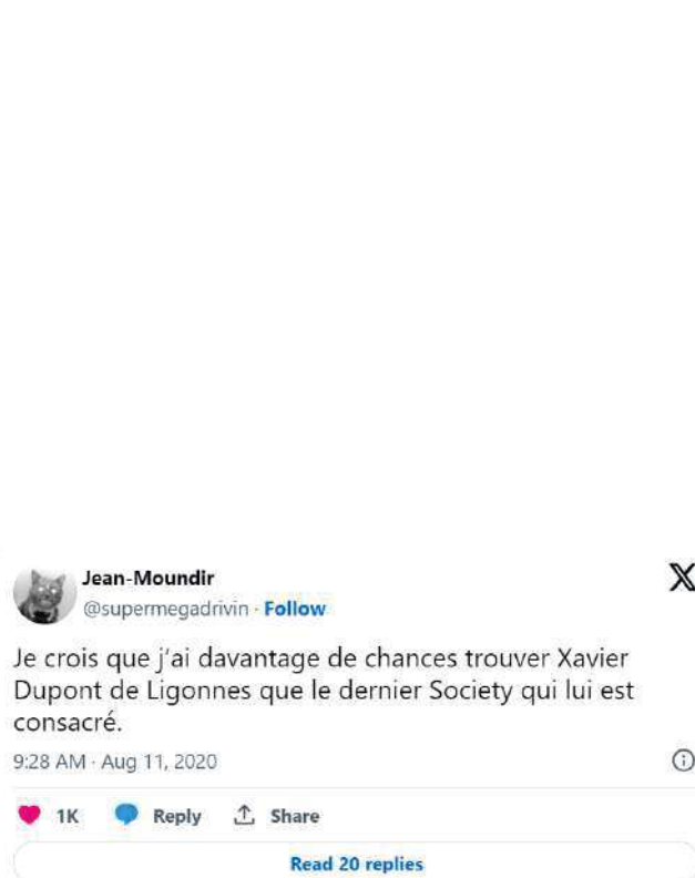
Tweet de @supermegadrivin