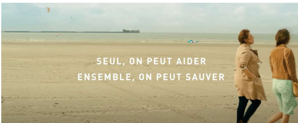
Annexe 21 : "Campagne Multicrise" Action Contre La Faim