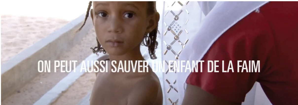
Annexe 23 : “C’est bien plus que nourrir” Action Contre La Faim