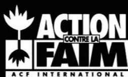
Annexe 22 : Action Contre la Faim "Les Dents"