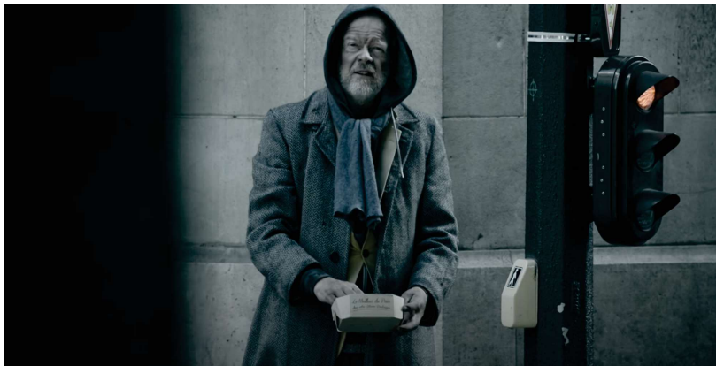
Annexe 14 : Fondation Abbé Pierre “Ils ont eu un passé”