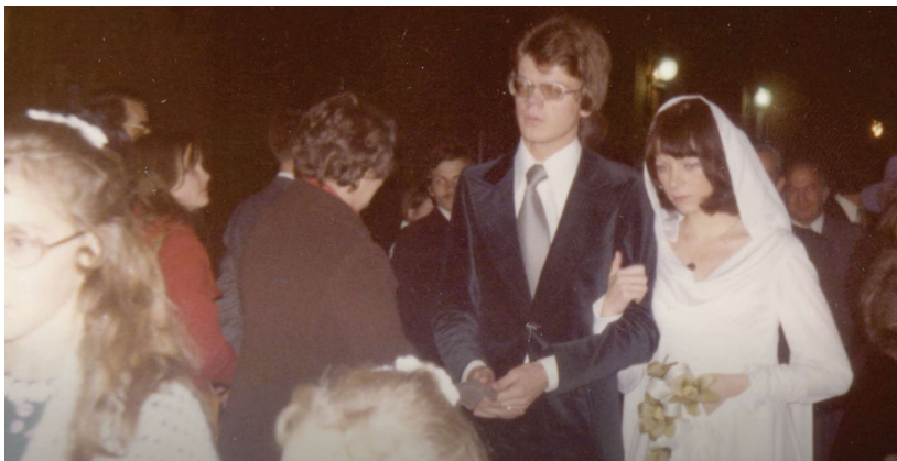
Annexe 15 : “Pas d’Excuses” Médecins du Monde