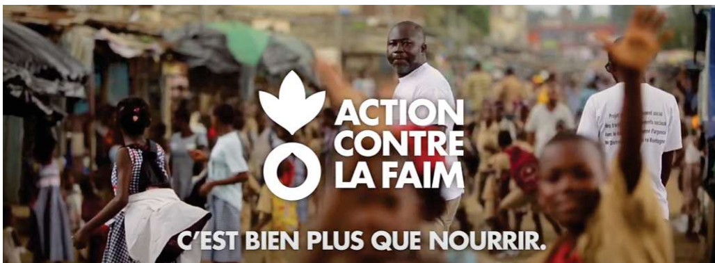
Annexe 24 : “Agir pour le climat c’est lutter contre la faim” Action Contre La Faim