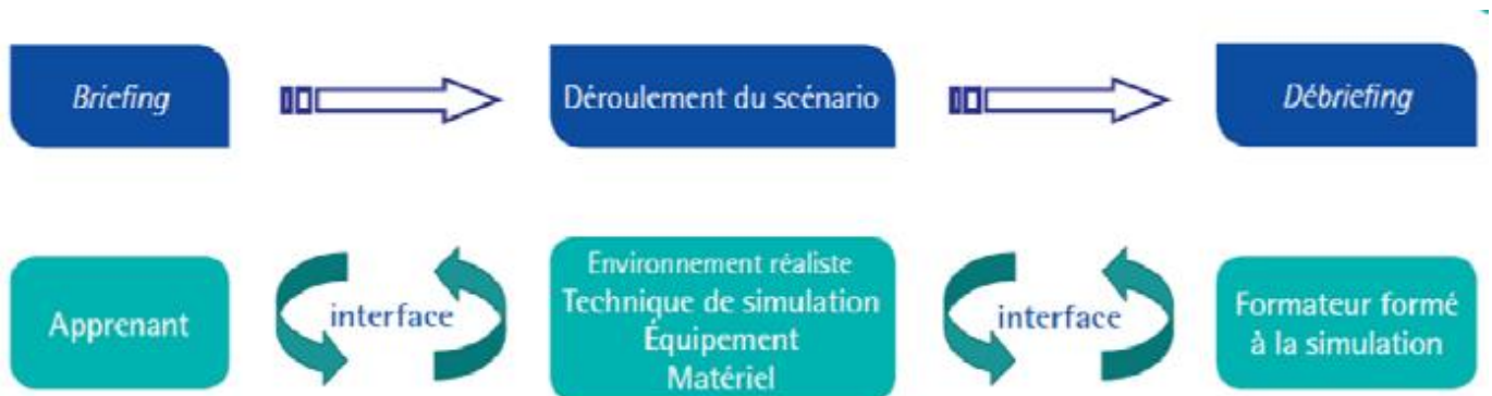
Figure 3 : Les étapes d'une séance de simulation (11)

Chaque séance de simulation est construite en trois temps : briefing, déroulement du scénario, débriefing.