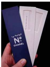
Collection de mouillettes