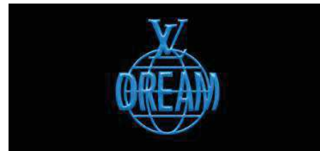
Affiche promotionnelle de LV DREAM par Louis Vuitton