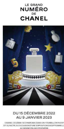
Affiche promotionnelle du Grand Numéro de Chanel

De son côté, Chanel présente son événement par d'autres couleurs telles que l'or, symbole de puissance, de lumière et d'opulence, mais également par du blanc, symbole d'innocence et de lumière, et du rouge vif ajoutant une touche d'audace. Ces affiches jouent sur le mystère avec une absence d'éléments concrets sur ce que les expériences vont contenir, elles proposent également toutes les deux des couleurs pouvant renvoyer à un univers onirique et somptueux, et des signes correspondant à leurs propres récits.