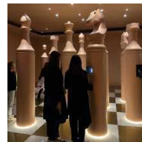
Jeu d'échecs géant interactif