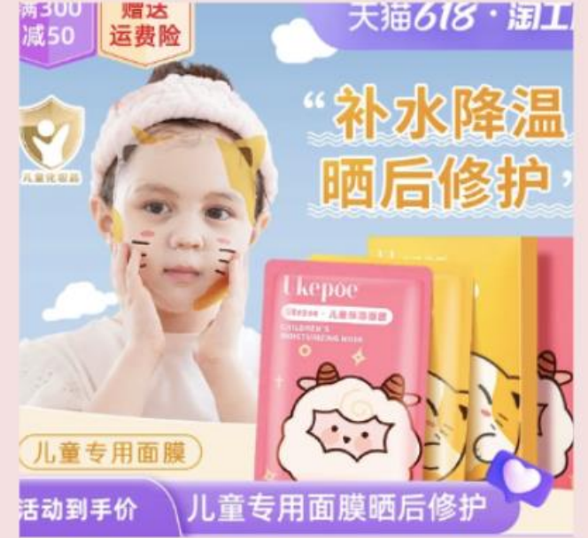
Masque de soin