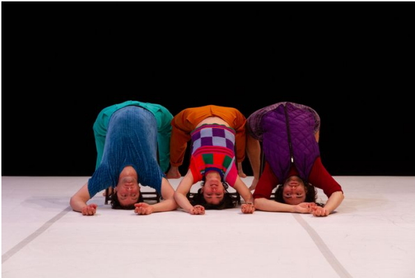
Les Jambes à son cou , Association W, 2021 © Nicolas Lelièvre