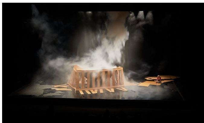
Maison Mère , dans La Trilogie des Contes Immoraux (Pour Europe) , Compagnie Non Nova, 2021