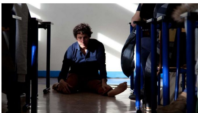
Millefeuille , Association W, 2014