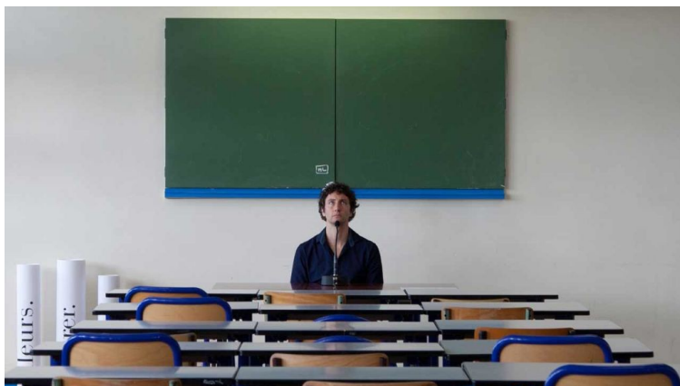
Millefeuille , Association W, 2014