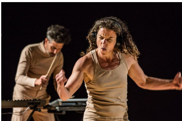
Dicklove , Sandrine Juglair, 2021