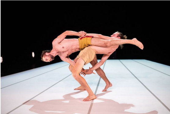
Through the Grapevine , Compagnie Not Standing, 2020