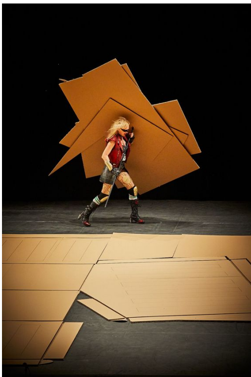
Maison Mère , dans La Trilogie des Contes Immoraux (Pour Europe) , Compagnie Non Nova, 2021