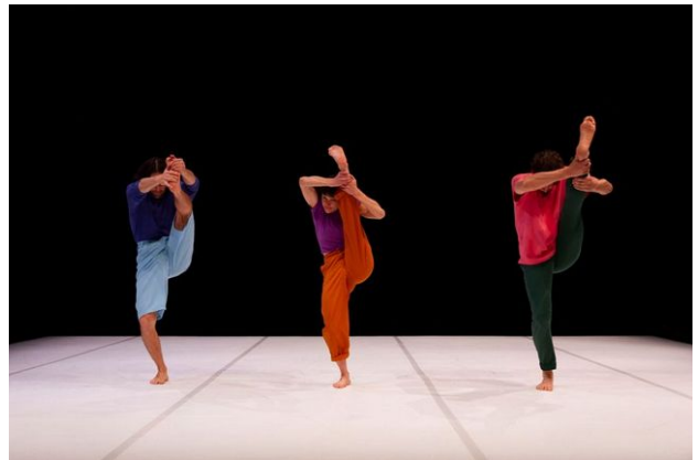
Les Jambes à son cou , Association W, 2021 © Nicolas Lelièvre