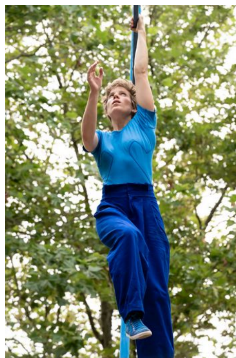
Bleu Tenace , Compagnie Rhizome, 2021