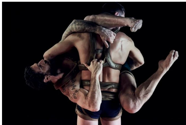
Cuir , Un loup pour l'homme, 2020 © Valérie Frossard