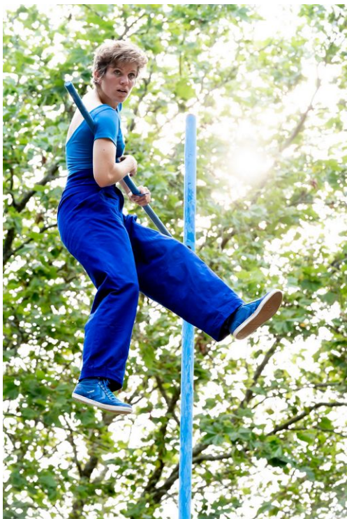
Bleu Tenace , Compagnie Rhizome, 2021