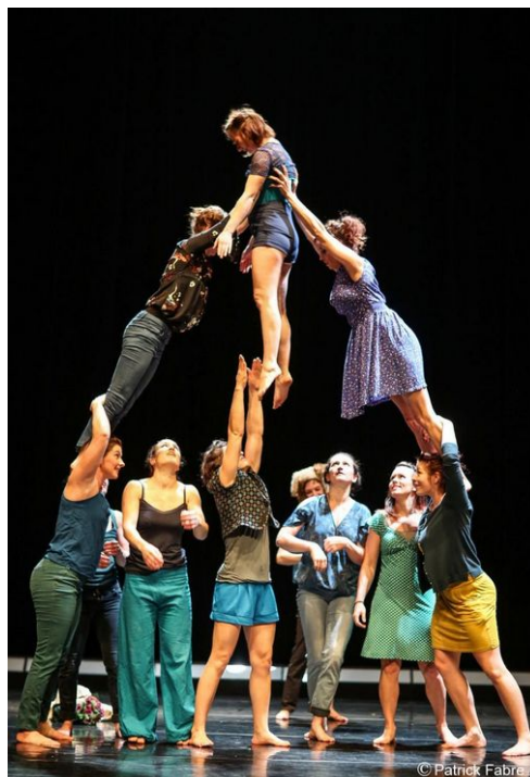
Projet.PDF , Collectif Porté de Femmes, 2017