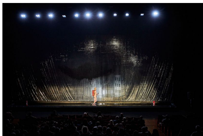
La rencontre interdite , dans La Trilogie des Contes Immoraux (Pour Europe) , Compagnie Non Nova, 2021