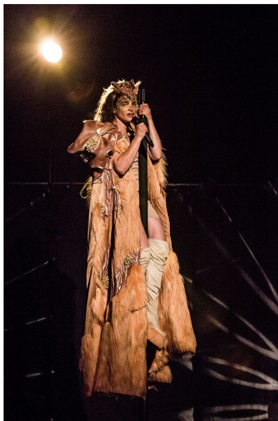
Dicklove , Sandrine Juglair, 2021