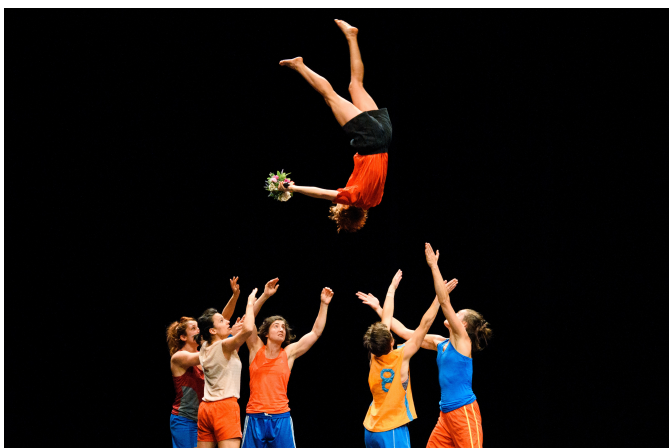
Projet.PDF , Collectif Porté de Femmes, 2017