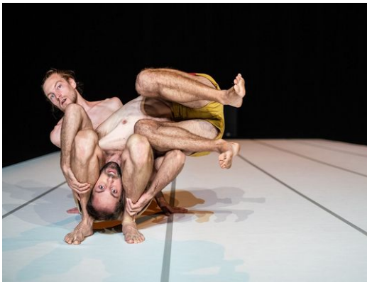
Through the Grapevine , Compagnie Not Standing, 2020