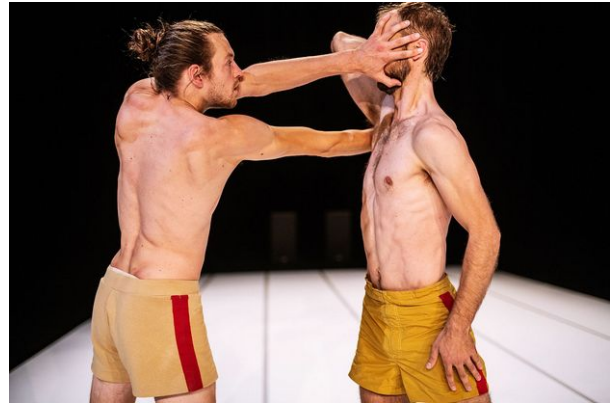
Through the Grapevine , Compagnie Not Standing, 2020