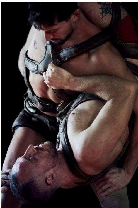
Cuir , Un loup pour l'homme, 2020 © Valérie Frossard