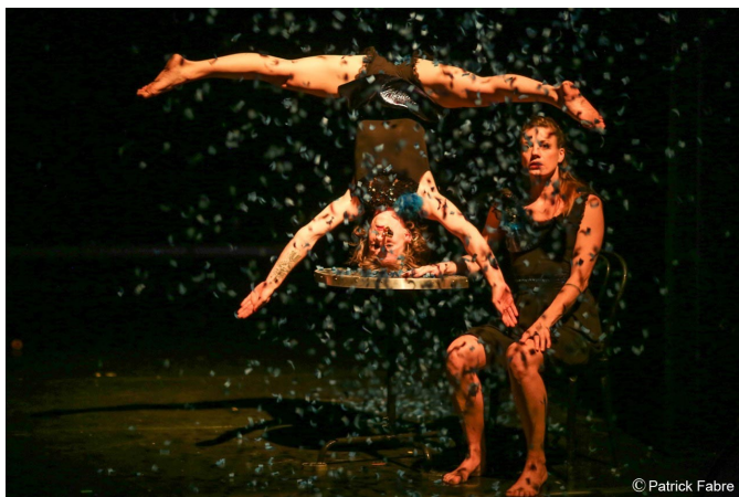
Projet.PDF , Collectif Porté de Femmes, 2017