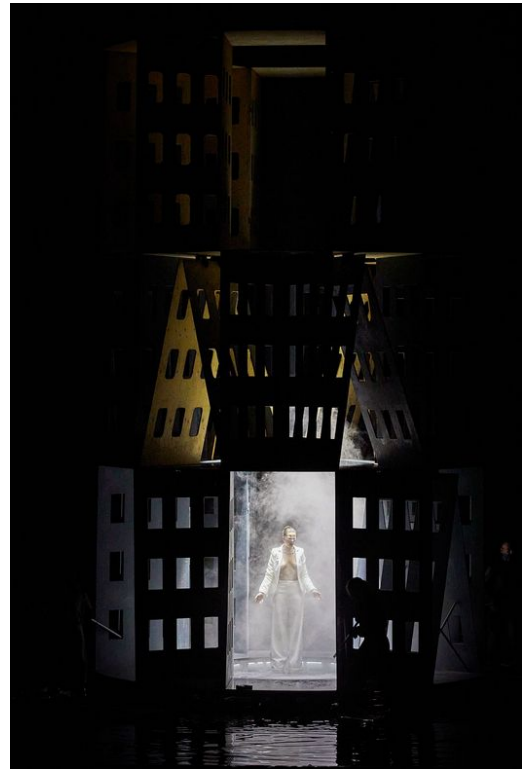
Temple Père , dans La Trilogie des Contes Immoraux (Pour Europe) , Compagnie Non Nova, 2021