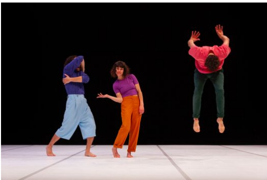
Les Jambes à son cou , Association W, 2021 © Nicolas Lelièvre