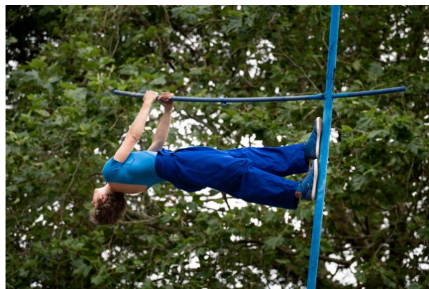
Bleu Tenace , Compagnie Rhizome, 2021 © Alain Monot