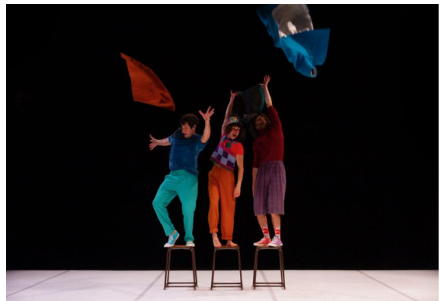
Les Jambes à son cou , Association W, 2021 © Nicolas Lelièvre