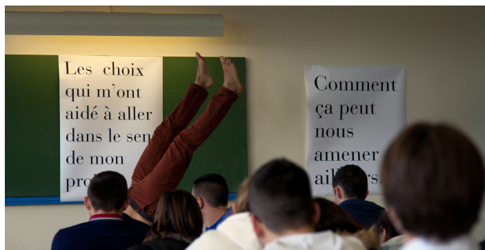
Millefeuille , Association W, 2014