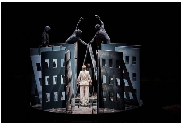
Temple Père , dans La Trilogie des Contes Immoraux (Pour Europe) , Compagnie Non Nova, 2021