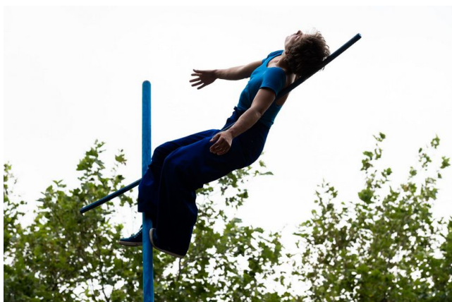
Bleu Tenace , Compagnie Rhizome, 2021