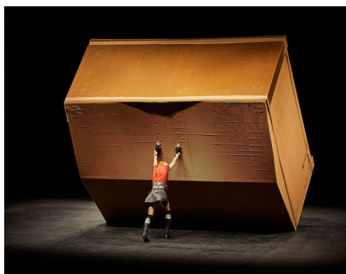
Maison Mère , dans La Trilogie des Contes Immoraux (Pour Europe) , Compagnie Non Nova, 2021