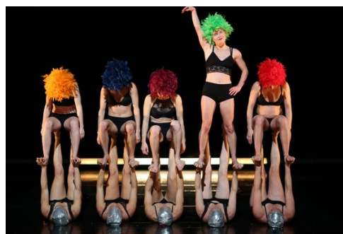
Projet.PDF , Collectif Porté de Femmes, 2017