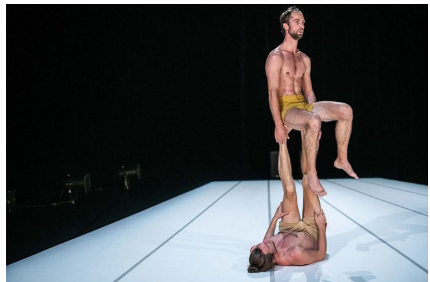
Through the Grapevine , Compagnie Not Standing, 2020