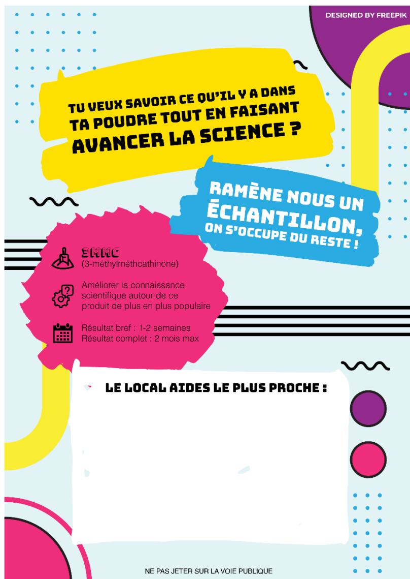
Figure 2 : Verso du Flyer