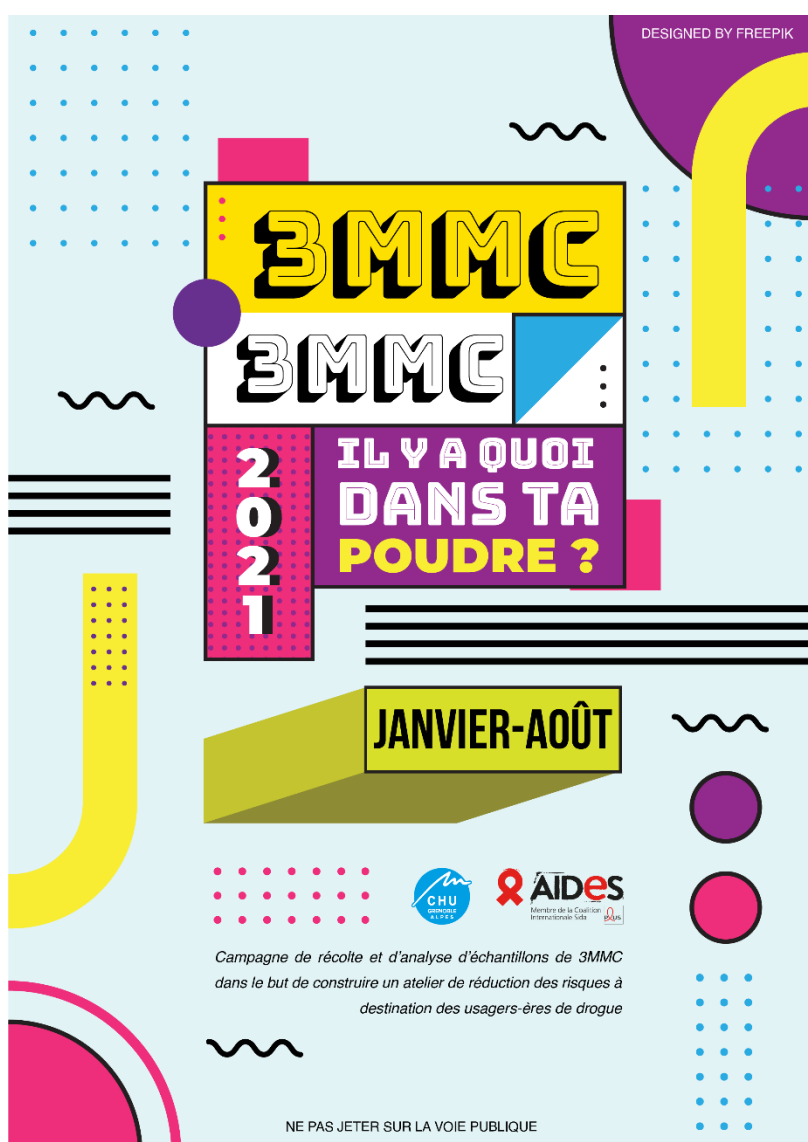
Figure 1 : Recto du flyer

Afin de promouvoir le projet et récolter un maximum d'échantillons, plusieurs réunions ont eu lieu avec les équipes de AIDES. Un slogan accrocheur a finalement été adopté : « 3MMC, il y a quoi dans ta poudre ? » et un flyer (Figure 1 et Figure 2) distribué dans tous les lieux de mobilisation partenaires ainsi que sur les réseaux sociaux.