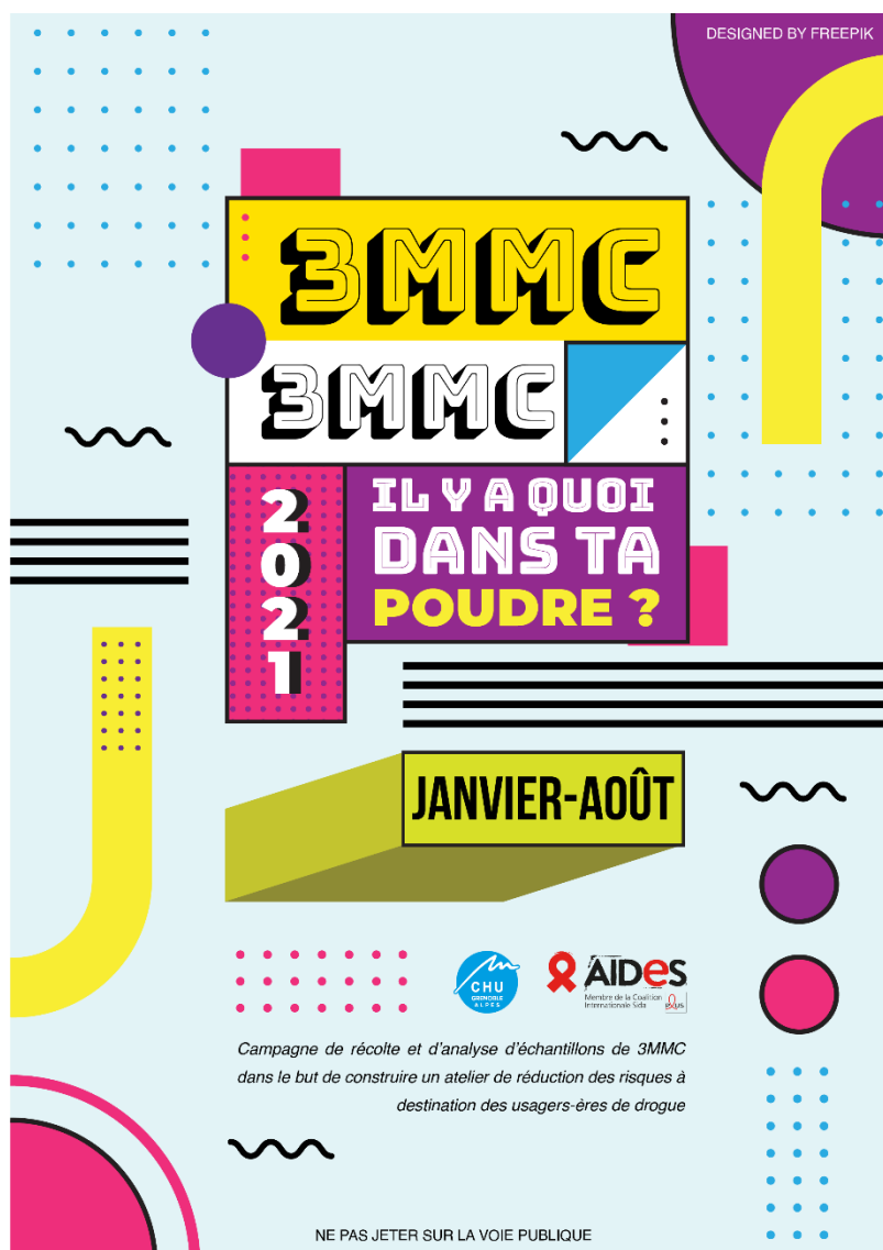
Figure 1 : Recto du flyer

Afin de promouvoir le projet et récolter un maximum d'échantillons, plusieurs réunions ont eu lieu avec les équipes de AIDES. Un slogan accrocheur a finalement été adopté : « 3MMC, il y a quoi dans ta poudre ? » et un flyer (Figure 1 et Figure 2) distribué dans tous les lieux de mobilisation partenaires ainsi que sur les réseaux sociaux.