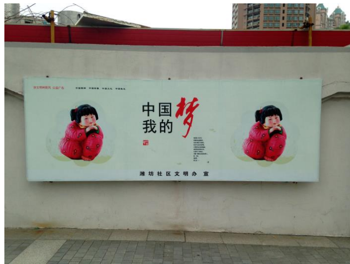
Poster de propagande pour le Rêve Chinois. 'Rêve Chinois, rêve à moi' ; Shiji Dadao (Century Avenue), Pudong, Shanghai. La figurine représentée est nommée Chinese Dream Baby et apparaît dans la communication via médias digitaux et posters. La figurine est une poterie en argile de Tianjin par les artistes Zhang Caisu et Lin Gangzao. » 76

Comme dit précédemment, dans son article, Michael Gow s'intéresse à la campagne de promotion de ces différentes valeurs, à ses modalités et à son but. Il observe ainsi que les spots de propagandes promouvant au moins une partie d'entre elles les associent fortement à la « culture traditionnelle » chinoise. Ainsi, visuellement, ces spots présentent souvent des images d'art traditionnel ou à caractère bucolique.