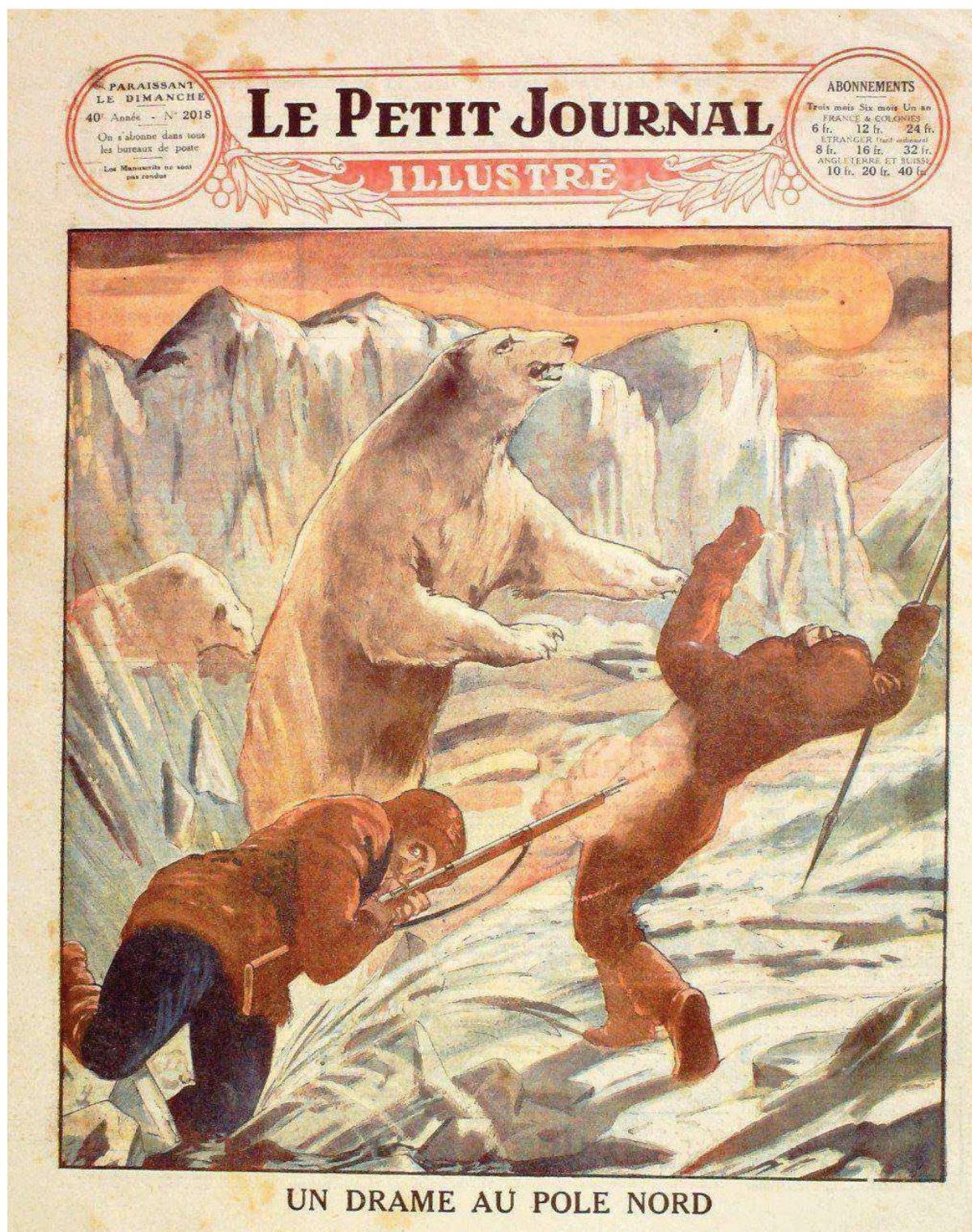
Annexe 4 : Une du Petit Journal Illustré (1929)