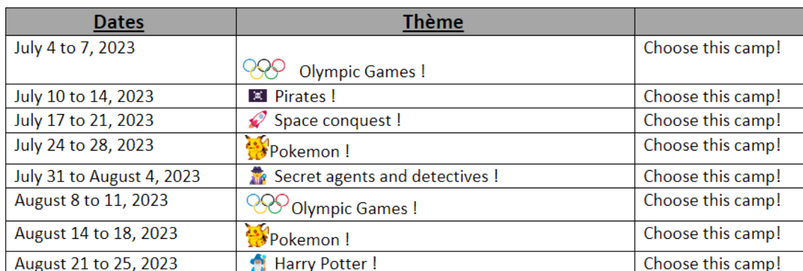
Tableau 2. Thématiques prévues pour les huit semaines des camps d'été 2023 de l'AFV

le thème des Pokémon qui lui semblait être le plus attractif. Finalement, voici le programme qui a été établi pour l'été :