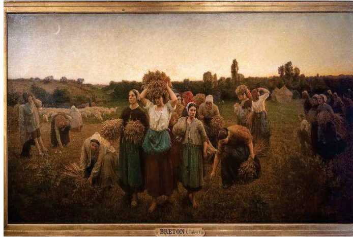
Jules Breton (1827-1906), Le Rappel des glaneuses, 1859 - Huile sur toile, 90.5 x 176 cm - Paris, musée d'Orsay – Inv. MI 289 •

Paysages bucoliques, le paysan y est représenté avec son costume traditionnel, le visage des femmes est immaculé et leurs traits rappellent ceux des déesses grecques. Le paysan est alors une figure calme et sage « qui contribue sans vague au devenir de la société française » 8 que l'on retrouve notamment dans les tableaux de Jules Breton, un travail que l'on qualifie aujourd'hui de réalisme idéaliste 9 .