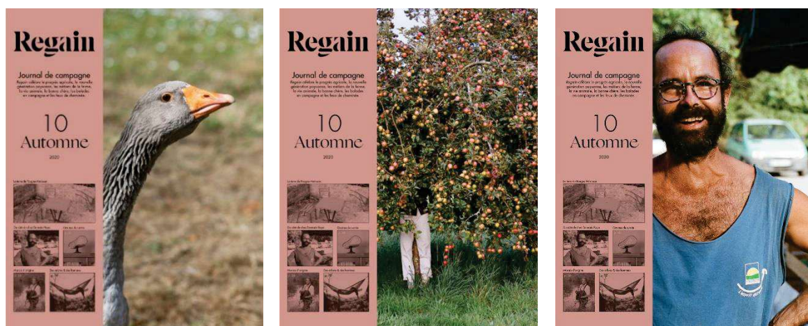
Figure 3 - les 3 versions possibles de couverture pour le magazine Regain n°10, automne 2020

Positionné en haut à gauche, le titre du magazine Regain ne se trouve pas sur la une mais sur le cavalier. Etant à l'origine un format publicitaire reproduisant le papier de