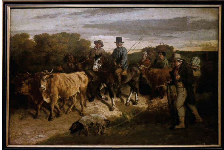
Gustave Courbet (1819-1877), Le Retour de la foire ou Les Paysans de Flagey, 1850-1855 - Huile sur toile, 208,5 x 275 cm - Paris, musée d'Orsay •

Courbet et d'autres se refusent alors à l'idéalisation, et c'est cette tension qui traverse précisément toute cette deuxième moitié du XIXe chez les peintres et les écrivains : embrasser une vision bucolique de ces espaces ou choisir de représenter la dureté du quotidien des paysans qui y sont astreints. Un paradoxe que nous pourrions retrouver dans les sujets choisis par le magazine, notamment par ses choix de direction artistique et photographique.