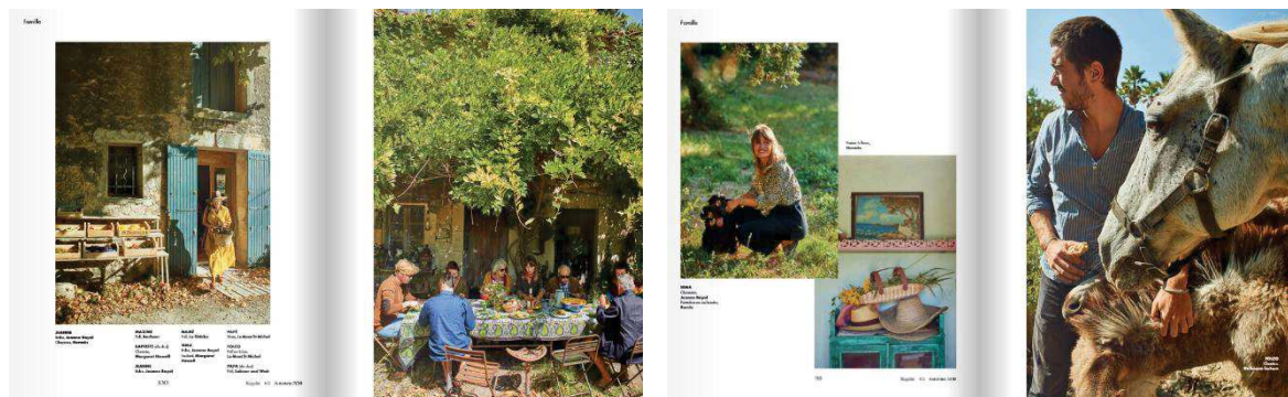
Figure 15 - Magazine Regain N°2, Automne 2018, doubles pages 98-99 et 100-101

Par ailleurs, le magazine dans ses premiers numéros dédie une rubrique à des mises en scènes de moments de vie à la campagne (dîner de famille, promenade dans les oliviers, jardinage dans la serre). C'est précisément là où cette notion d' hyperréel semble supplanter le réel. Au-delà d'une mise en scène des différentes personnes présentes sur place dans un souci de composition photographique, les personnes sont habillées par des vêtements prêtés par des marques pour l'occasion 111 . Souhaitant rester dans le thème de la campagne, les marques sont choisies pour la proximité de leurs valeurs avec le monde rural décrit par Regain , comme la marque de vêtements de chasse Barbour , ou d'autres marques capitalisant sur leur savoir-faire. On peut apercevoir un panier à fleur de la marque Hermès , ou des vêtements de travail d'une ancienne marque portée par les agriculteurs bretons, Le Mont St Michel . Usant ainsi de la signification de ces objets et de ses vêtements, le magazine Regain propose à ses lecteurs de recomposer cette nouvelle réalité en combinant les signes associés à ces objets, de sorte à créer un ensemble de plus en plus crédible au fur et à mesure de l'addition de ces signes (Figure 15).