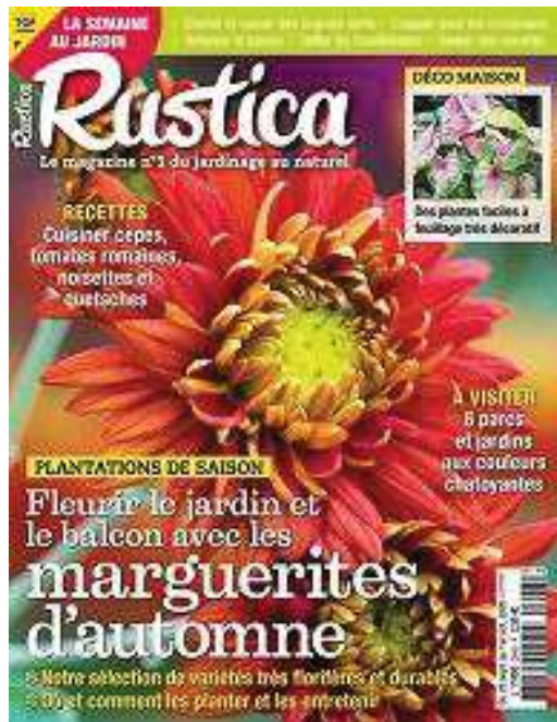
Figure 1 - Couverture du magazine Rustica n°2648, 25 septembre 2020