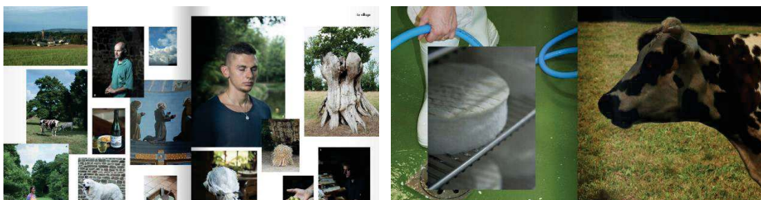
Figure 14 - Regain N°6, Automne 2019, doubles pages 16-17 et 141-142