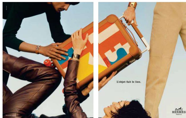
Figure 10 - Campagnes imprimées du maroquinier de luxe Hermès, deuxième de couverture en double page du magazine Regain n°12

Plus qu'un produit fabriqué par le maroquinier, cet objet semble ici représenter un medium que l'on utilise en tant qu'individu dans le but de se relier à un autre individu. Dans un magazine qui promeut le retour à l'essentiel et la suppression de tout intermédiaire pouvant potentiellement altérer la qualité et la sincérité du rapport à autrui, on serait tenté de voir cet objet comme un obstacle, résultant d'une approche matérialiste des relations humaines. Cependant, la présence même de cette campagne publicitaire ainsi que sa récurrence 59 , tend à nous montrer à quel point un certain type de consommation – ici en l'occurrence des biens de luxe – tend à outrepasser un certain nombre de critiques soulevées par les différents acteurs du monde rural interrogés au fil des pages du magazine. Autrement dit, cette esthétisation qui passe par l'objet de luxe relativise le caractère intrinsèquement marchand de celui-ci en lui accordant une valeur nouvelle, caractérisée par sa composante émotionnelle 60 .