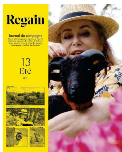
Figure 5 - Couverture du magazine Regain n°13, Été 2021