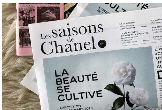
Figure 12 - Couverture du numéro 2 du journal Les saisons de Chanel , produit par la rédaction de Regain