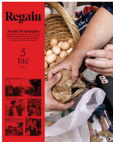
Figure 4 - Couverture du magazine Regain n°5, Été 2019