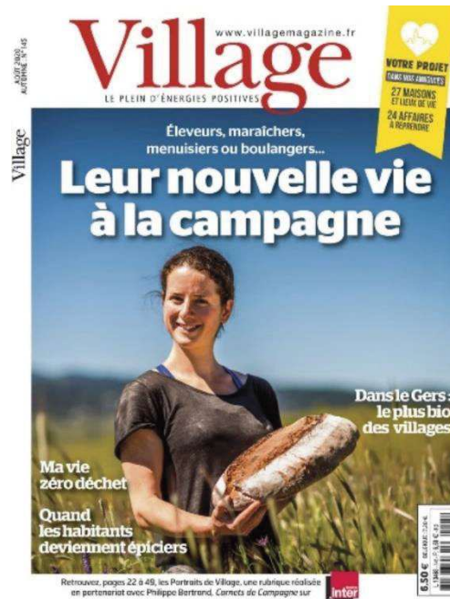
Figure 2 - Couverture du magazine Village n°145, automne 2020

Village Magazine ensuite (Figure 2), condense l'actualité des territoires à forte dominante rurale et propose de mettre en valeur des initiatives entrepreneuriales, des activités créatives, solidaires et surtout locales. La revue précise sur son site internet que l'intégralité des articles et dossiers présents dans le magazine sont rédigés et réalisés par des journalistes installés sur ces territoires. Multipliant les dossiers sur l'installation d'anciens citadins à la campagne, on peut supposer que le public ciblé par ce magazine se rapproche de celui de Regain . Bien que ces trois magazines aient plus ou moins directement attiré à la campagne et à ses activités, étudier leurs unes respectives se révèle être le moyen de comprendre pourquoi on peut considérer que Regain est un magazine à part dans sa manière de mettre en images et en mots le monde rural. Plus que n'importe quelle autre page du magazine, la une fait l'objet d'importants efforts de mise en page dans l'objectif de capter l'attention du lectorat et de susciter l'achat, elle est le produit du processus éditorial de sélection et de hiérarchisation de l'information entrepris par la rédaction 23 .