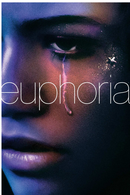
Affiche de la série Euphoria

Par ailleurs, les trends TikTok reflètent les préoccupations de la société, et le sadfishing n'a pas échappé à cette dynamique. Cette évolution s'étend jusqu'à la création d'une esthétique spécifique autour des larmes et de la tristesse. Effectivement, depuis la diffusion de la saison 1 de la série Euphoria, on observe une esthétisation des larmes. Dans cette série dramatique américaine qui raconte de manière crue et imprévisible le quotidien d'une bande de lycéens, l'esthétique prime. Tout au long des épisodes, une attention particulière est portée à l'esthétisme et aux couleurs. Les larmes sont omniprésentes dans la série mais celles-ci sont glorifiées et esthétisées. Les larmes sont pailletées, les yeux et bouts de nez sont rougis pour donner un air sexy aux personnages.