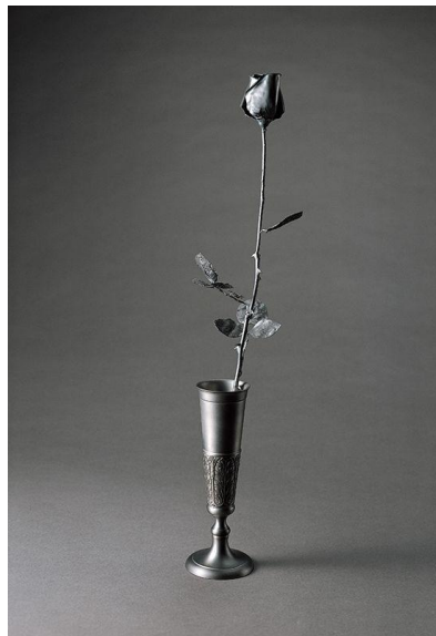
Fig 10. Zhisong Cai, Rose , 15×12×58 cm, plomb bronze stannum, 2008