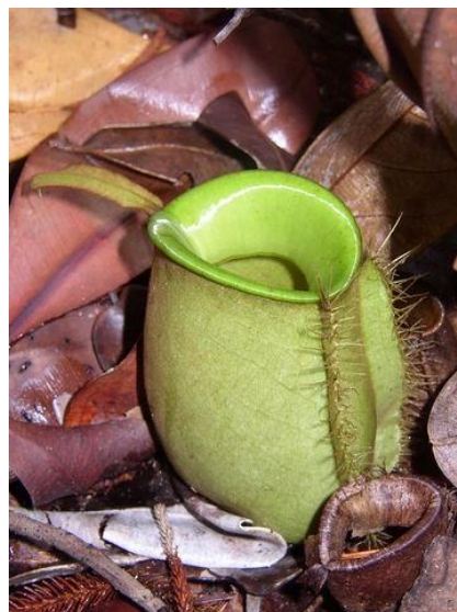
Fig 4. Nepenthes ampullaria

3. le goût : même si aucune recherche ne prouve que les plantes ont un goût, elles sont capables de faire la distinction entre différents produits chimiques dissous. Les racines de la plupart des plantes ressemblent à une bouche humaine, puisant l'eau et les minéraux dans le sol et absorbant sélectivement certains minéraux dans le cortex interne. Certaines plantes, cependant, ont plus d'une "bouche", par exemple la cage des feuilles de la berce du Caucase est sa deuxième "bouche" pour se nourrir. Il est intéressant de noter qu'il existe également des "végétariens" dans le genre Nepenthes , comme Nepenthes ampullaria , qui se nourrit de feuilles en décomposition (Fig. 4).