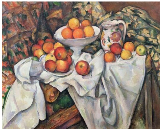
Fig 7. Paul Cézanne, Rideau, Cruchon et compotier , 1893-1894

© File:Floris Van Dyck, Pièce de banquet.jpg