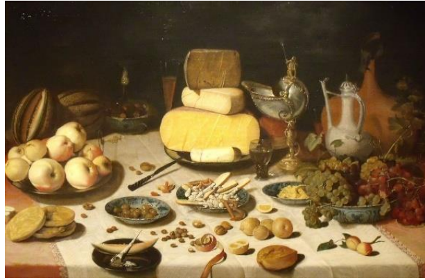
Fig 6. Floris Claesz van Dijck, Banquet hollandais avec fromage, pain, noix et fruits . 1613