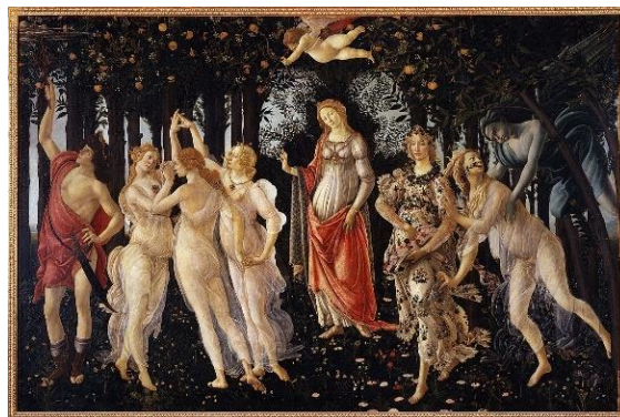
Fig 8. Sandro Botticelli, Le Printemps , 1480