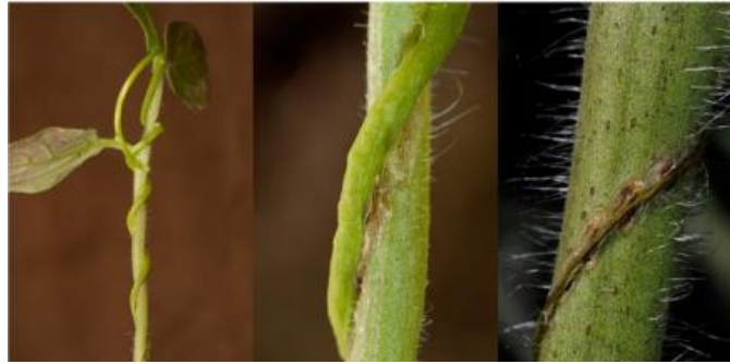
Fig 3. Cuscuta chinensis parasite des tiges de tomates

3. le goût : même si aucune recherche ne prouve que les plantes ont un goût, elles sont capables de faire la distinction entre différents produits chimiques dissous. Les racines de la plupart des plantes ressemblent à une bouche humaine, puisant l'eau et les minéraux dans le sol et absorbant sélectivement certains minéraux dans le cortex interne. Certaines plantes, cependant, ont plus d'une "bouche", par exemple la cage des feuilles de la berce du Caucase est sa deuxième "bouche" pour se nourrir. Il est intéressant de noter qu'il existe également des "végétariens" dans le genre Nepenthes , comme Nepenthes ampullaria , qui se nourrit de feuilles en décomposition (Fig. 4).