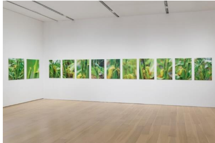
Fig 17. Shan LI, Smear 2 , 2017

inévitablement un sentiment de distance. Toutefois, à mon avis, il s'agit là d'un reflet de la peur et du rejet du monde aliéné des plantes par les êtres humains arrogants qui se considèrent depuis longtemps comme la mesure de toute chose.