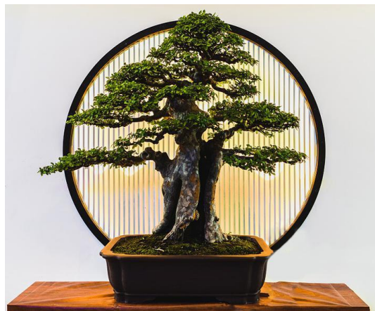
Fig 11. L'art du Penjing

Il s'agit d'une sélection artificielle forcée de plantes qui interfère avec leur croissance en les cisillant, en les pliant et en les attachant pour obtenir la forme désirée (Fig. 11). C'est la mise en forme forcée de la plante par des forces extérieures qui lui donne sa forme déformée. Le bonsaï artificiellement modifié est une croissance horizontale et plane de la plante, ce qui est contraire à la "nature de croissance" de la plante. On peut dire que l'art du bonsaï incarne une esthétique morbide d'un point de vue anthropocentrique et un désir de dominer la vie naturelle par la force.