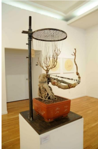
Fig 12. Shaomin Shen, Bonsai , 2009, Plantes en pot, jardinières en céramique, acier et fer