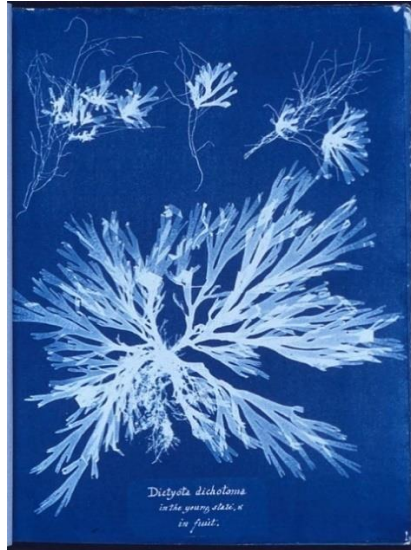
Fig 9. Anna Atkins, Algue brune Dictyota dichotoma , 1843