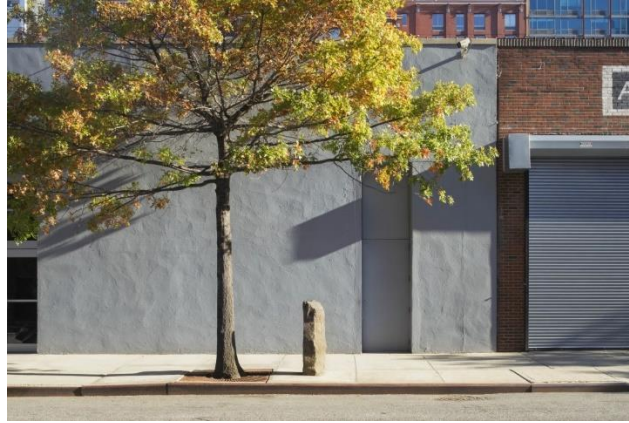
Fig 16. Joseph Beuys, 7000 Oak Trees , 1982