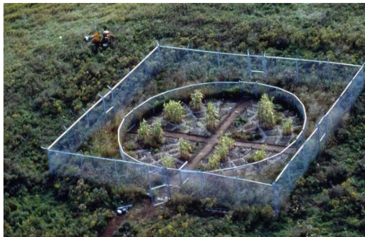
Fig 18. remédiation verte

le plus immédiat à l'environnement. Il existe des similitudes entre cette œuvre et 7000 Oak Trees de Joseph Beuys, que Mel Chin espère transformer en une sculpture sociale qui suscitera un sentiment de responsabilité sociale chez le public. Comme le dit l'artiste, « nous vivons dans un monde pollué par des sols contaminés par des métaux lourds et il n'y a pas de solution. Ce serait une grande sculpture si cette "pollution" pouvait être éliminée et si la vie pouvait revenir sur cette terre, à une vie diversifiée et écologiquement équilibrée. Je pense qu'il y a là une profonde esthétique. » 29