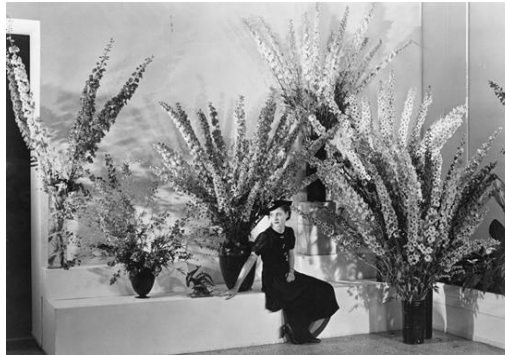
Fig 15. Edward Steichen, Delphiniums , 1936

au Musée d'art moderne de New York en 1936. Edward Steichen a utilisé les toxines contenues dans la base saline de la plante pour induire des variations dans les espèces fleuries, produisant ainsi les magnifiques Delphiniums . Il a été le premier à suggérer que la propagation naturelle des plantes pouvait également être considérée comme une forme d'art.