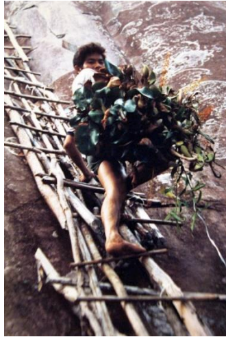
Fig 2. Les habitants de Bornéo cueillent la berce du Caucase sur les falaises pour la vendre aux collecteurs de plantes.

la limite de La culture artificielle de tissus est qu'elle ne permet pas une diversité de plantes individuelles, et les amateurs de collecte de plantes ont fait de la collecte de divers individus de différentes espèces un objectif plus important.