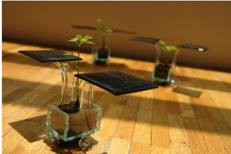
Fig 22. Gilberto Esparza, Parsley looking for the sun , 2007

préoccupé par la recherche d'un "résultat" pour les plantes indigènes, dont beaucoup sont de plus en plus menacées par l'empiètement des plantes exotiques sur la majeure partie de Londres. La préoccupation de l'artiste pour le droit à la vie des plantes indigènes est évidente dans cette œuvre.