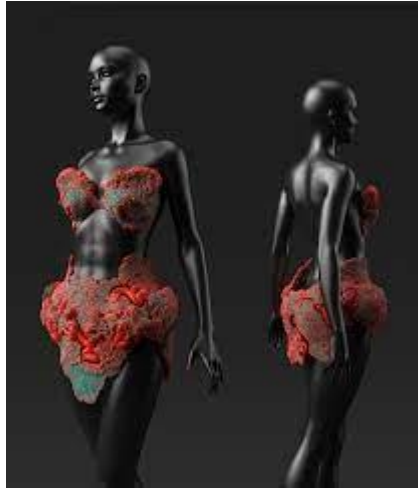
Fig 23. Neri Oxman, Mushtari