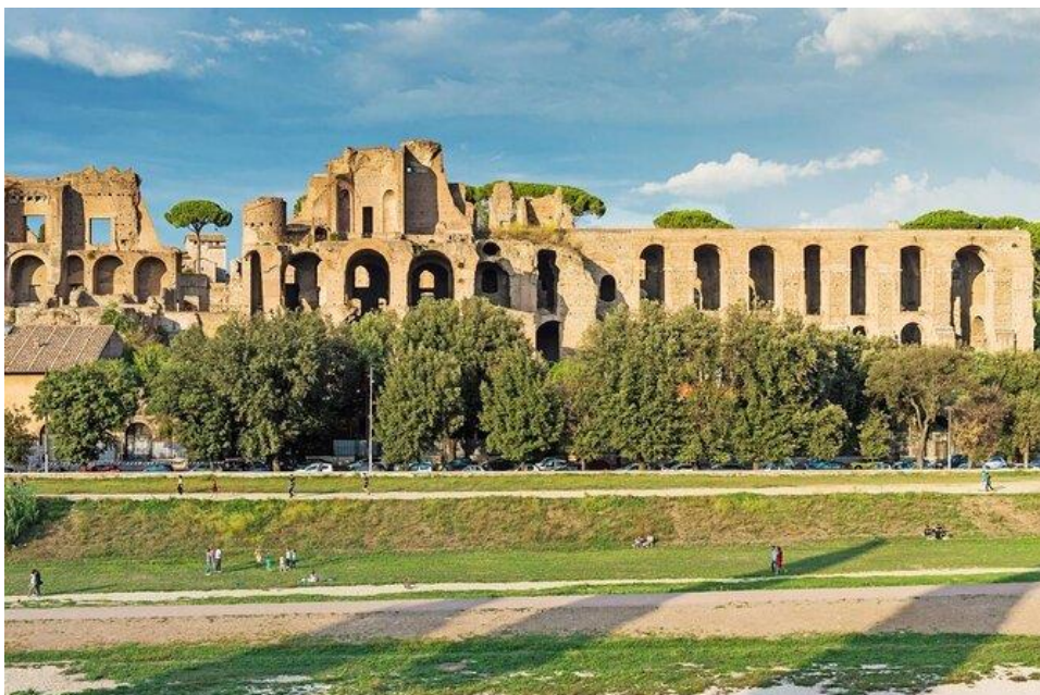
Circo Massimo de nos jours, Roma