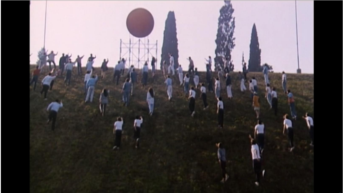
Le pas suspendu sous le ballon solaire Palombella rossa , Nanni Moretti