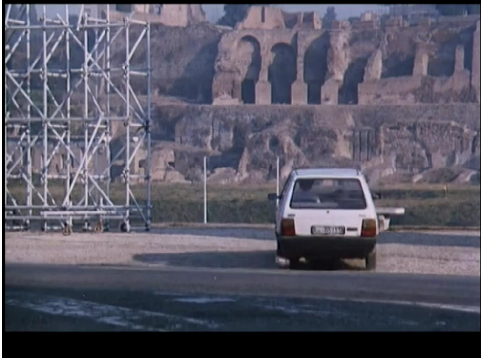
Palombella rossa , Nanni Moretti