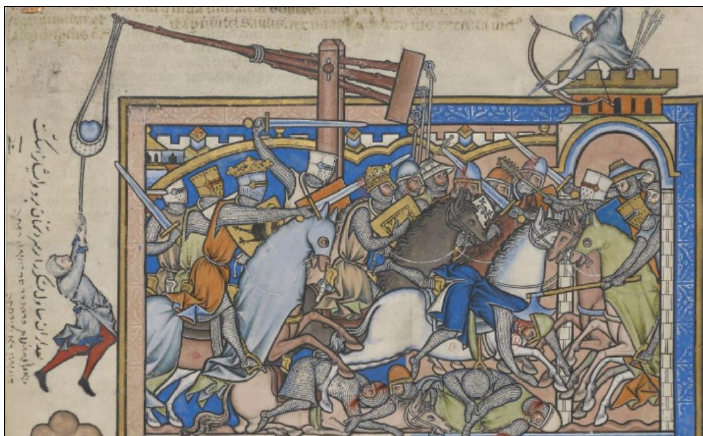
Figure 1 : Partie I et II du MS M. 638 , fol. 23v