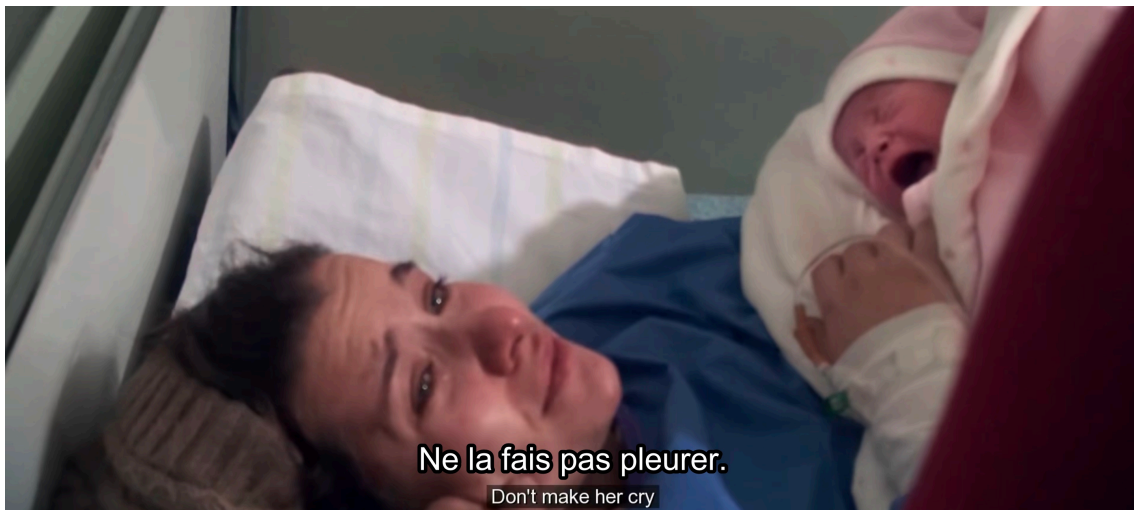
Naissance de Sama.