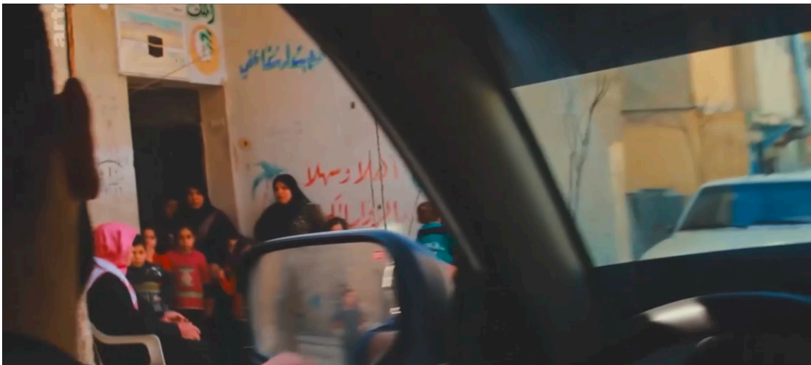
Apparition de femmes anonymes en second plan, pendant 6 secondes.

Pourtant, le réalisateur suit également ces hommes dans des moments plus intimes, en dehors de leur mission de bénévoles. On y voit par exemple à plusieurs