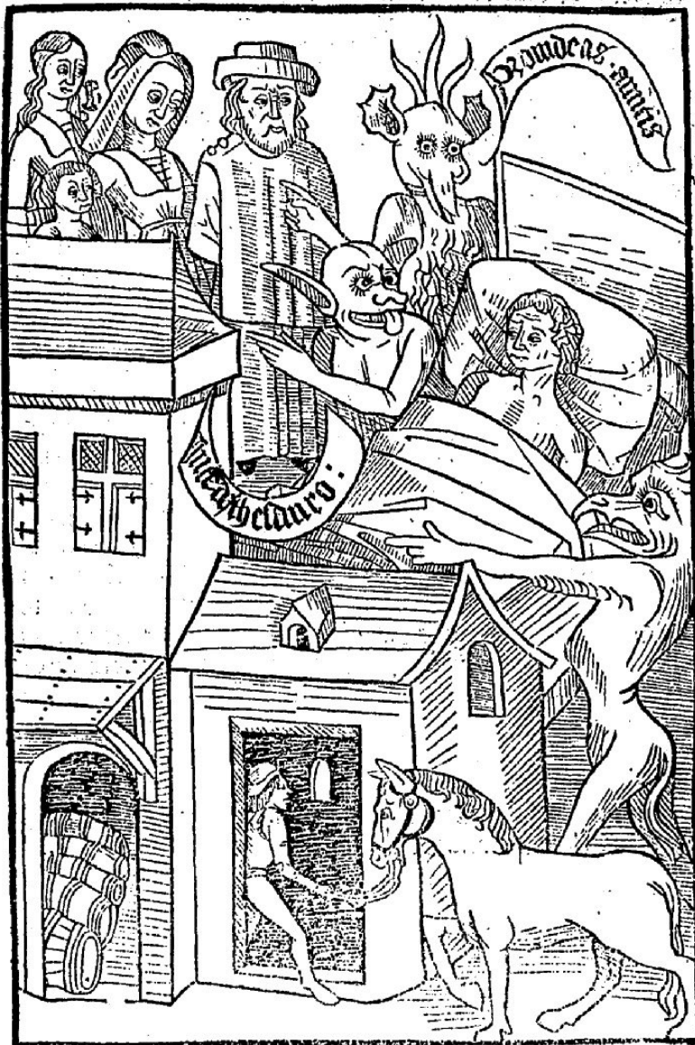
Ars Moriendi. p.11 Bibliothèque Nationale de France 1490-1491