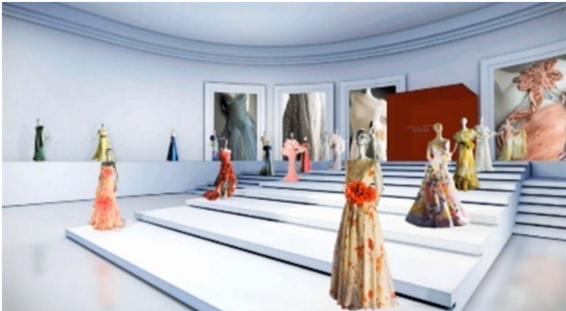
Fig. 33, 34 Le Musée Virtuel Valentino Garavani, les salles d'exposition