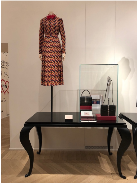
Fig. 21, 22 La Galerie Gucci Garden, Florence, la nouvelle muséographie de 2017 : les meubles noirs, les vitrines des accessoires, © Photographies personnelles.