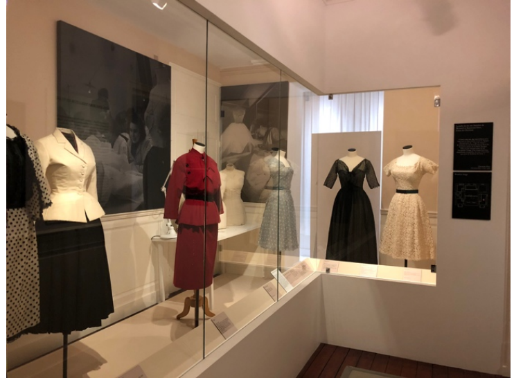
Fig. 1,2,3,4 Le Musée Christian Dior, Granville : la villa, les dispositifs de présentation et le dispositif olfactif.