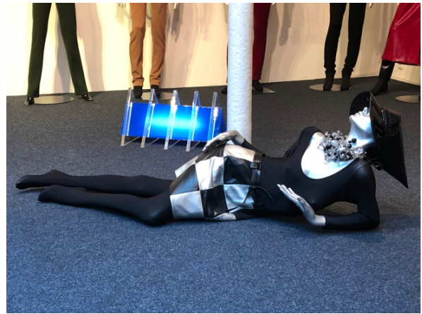
Fig. 5,6,7,8 Le Musée Pierre Cardin, Paris : les dispositifs de présentation, les mannequins et la présentation des sous-sols .