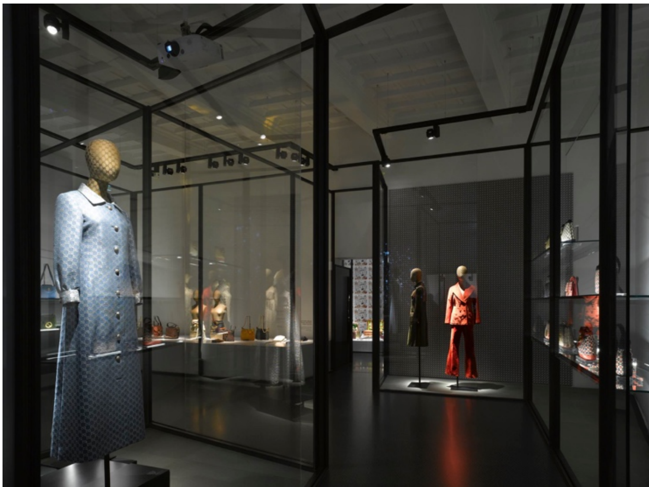
Fig. 20 Le Musée Gucci, Florence : la muséographie de 2011