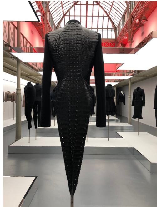
Fig. 9,10,11,12 La Galerie Azzedine Alaïa, Paris : les dispositifs de présentation, les mannequins invisibles et l'espace consacré à la chronologie du couturier.