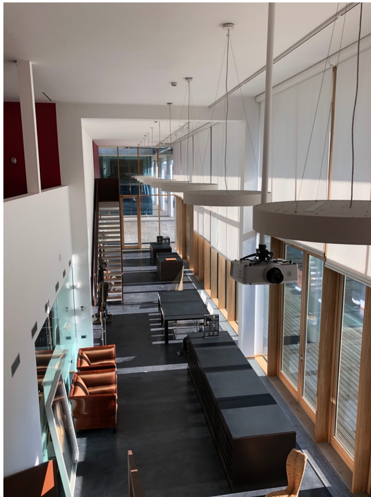
Fig. 30, 31 La Fondation Gianfranco Ferré, l' open space et l'espace d'exposition © Photographies personnelles.