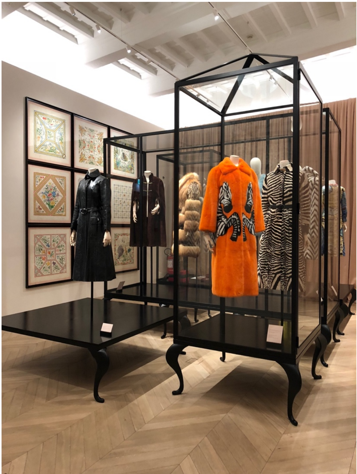
Fig. 23 La Galerie Gucci Garden, Florence, la nouvelle muséographie d’Alessandro Michele