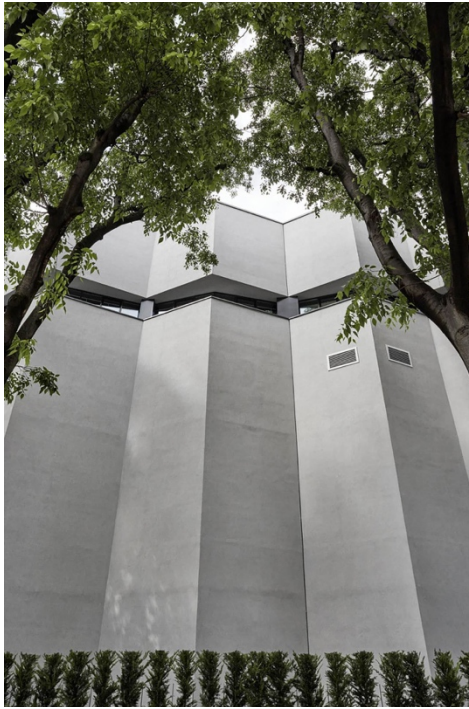
Fig. 24, 25 Armani/Silos : la vue de l'extérieur et la muséographie des salles