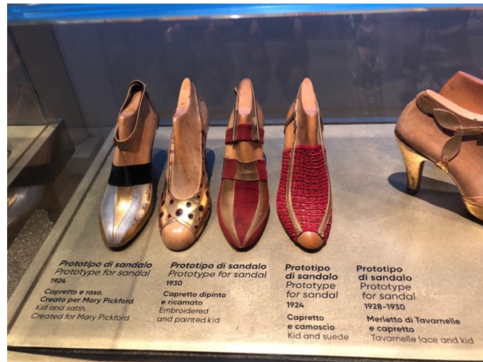
Fig. 18,19 Le Musée Salvatore Ferragamo, Florence : les embauchoirs en bois, © Photographies personnelles.