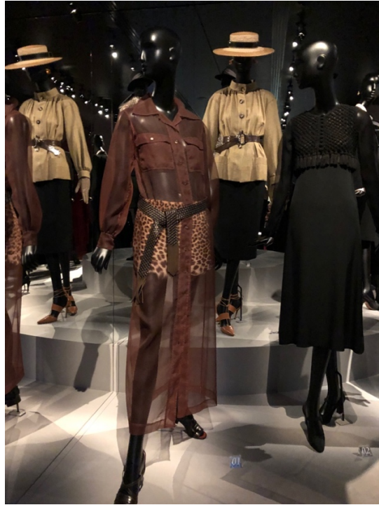
Fig. 16,17 Le Musée Yves Saint Laurent, Paris : la reconstitution du studio du couturier, les dispositifs de présentation et le display, projetant les sources d'inspiration à côté des vidéos des défilés.