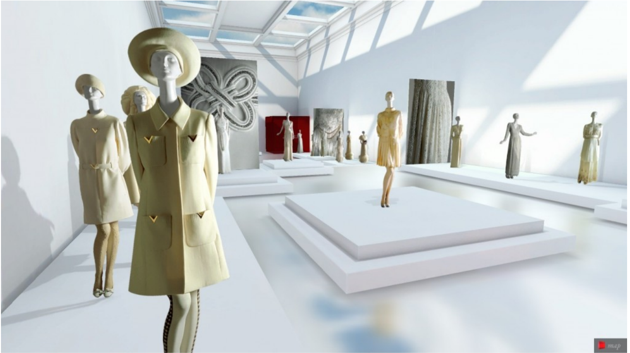
Fig. 35 Le Musée Virtuel Valentino Garavani, les salles d'exposition