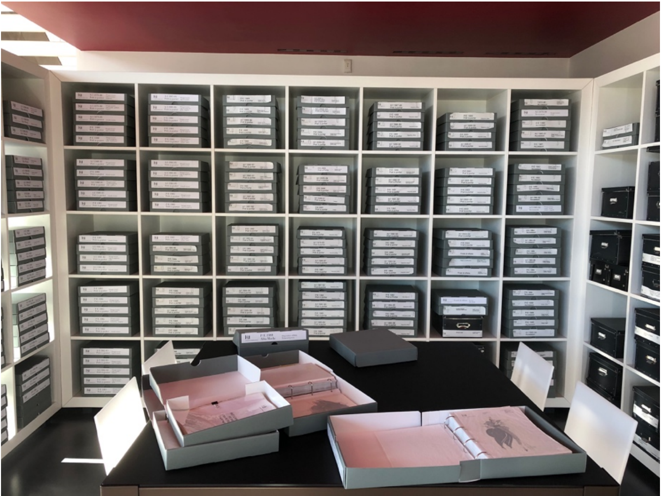
Fig. 32 La Fondation Gianfranco Ferré, les archives documentaires