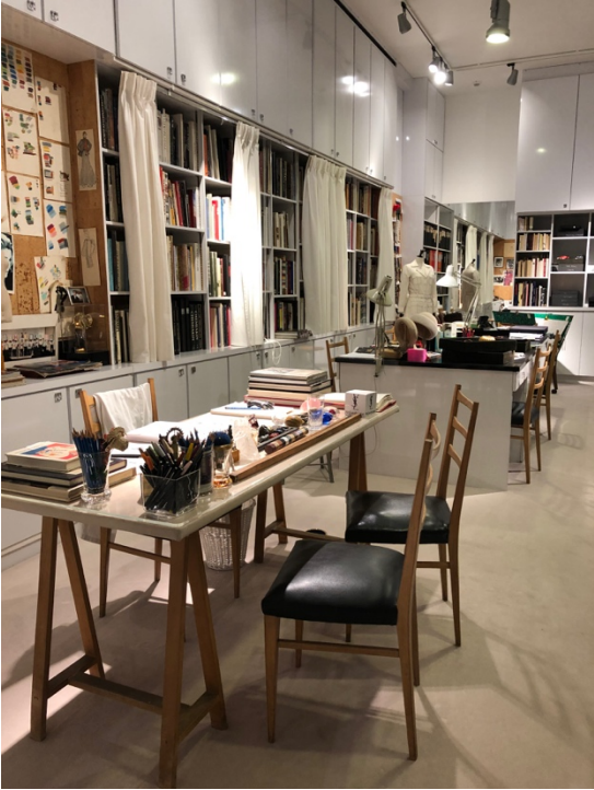
Fig. 13,14,15 Le Musée Yves Saint Laurent, Paris : la reconstitution du studio du couturier, les dispositifs de présentation et le display, projetant les sources d'inspiration à côté des vidéos des défilés.