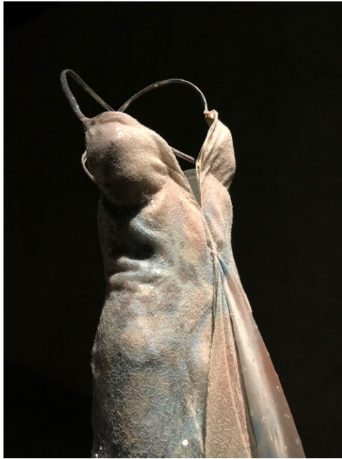
Fig. 28, 29 Armani/Silos : les mannequins transparents