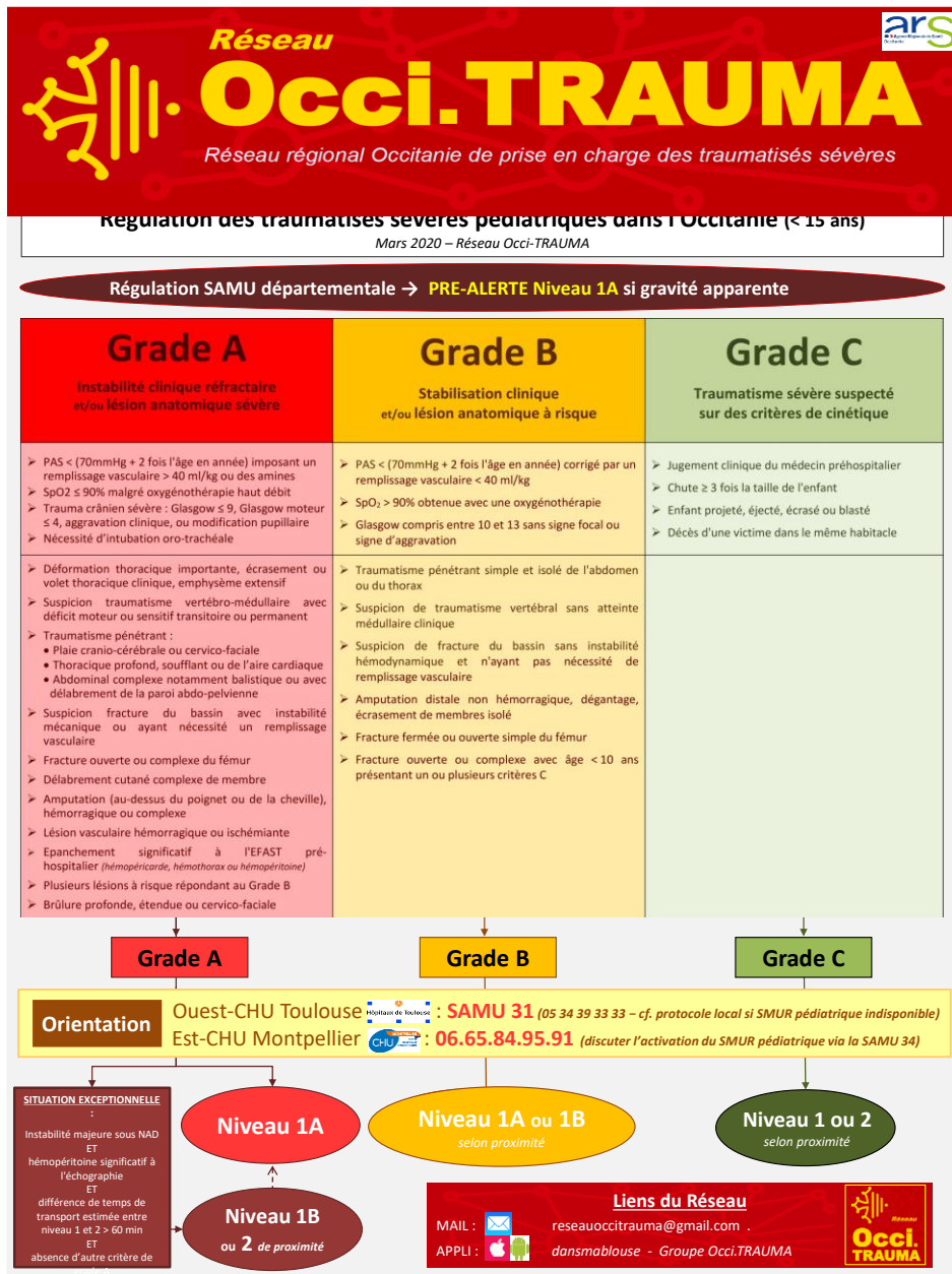
Figure 1. Pre-hospital triage of severe pediatric trauma in Occitanie (France).