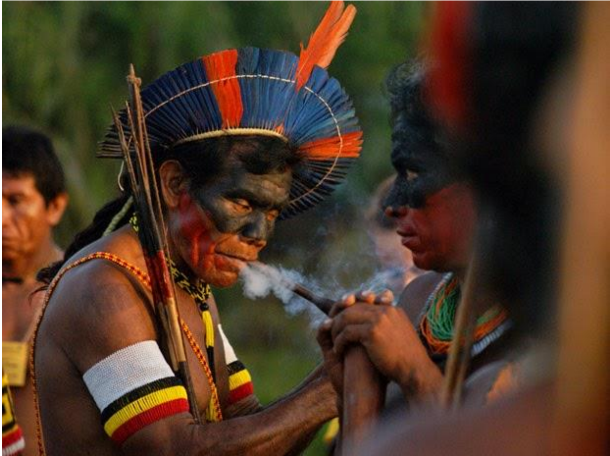
Illustration 3 : Indien pratiquant la pajelança au moyen d'une fumigation 5