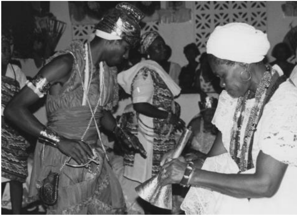
Illustration 6 : Initiée agitant la cloche sacrée adjá ; à gauche, initié incarnant la divinité Oxossi. Salvador (Bahia), 1994 8