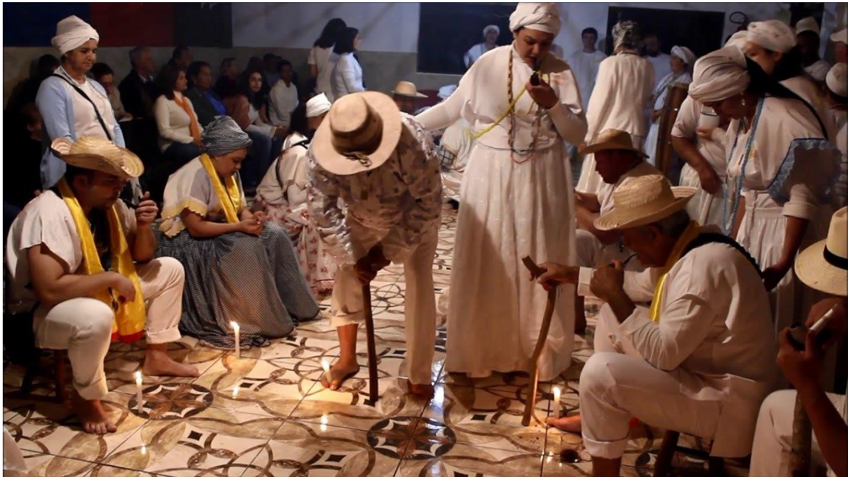
Illustration 7 : Les pretos-velhos dans l'umbanda 11