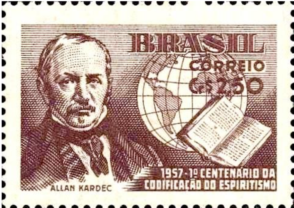
Illustration 1 : Timbre brésilien (1957) à l'effigie d'Allan Kardec 1