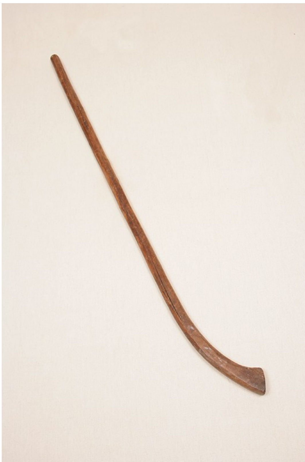
Weño (museo Cañete)