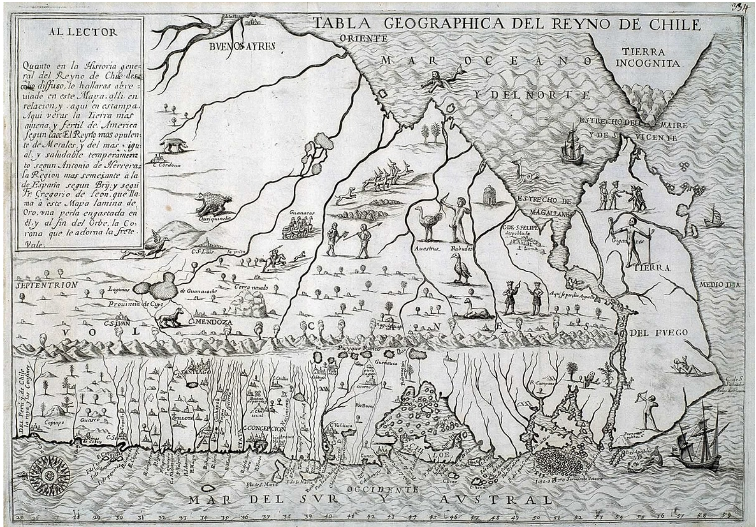
Carte du Royaume du Chili par Alonso Ovalle in Historica relación del reyno de Chile y de las misiones y ministerios que ejercita en él la Compañía de Jesús ...