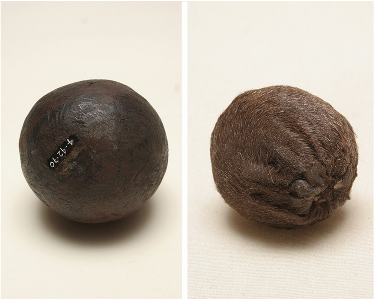
pali original et postérieur à la conquête (museo Cañete) de bois puis enveloppé dans de la peau d'animal (huemul, cheval, guanaco, llama)