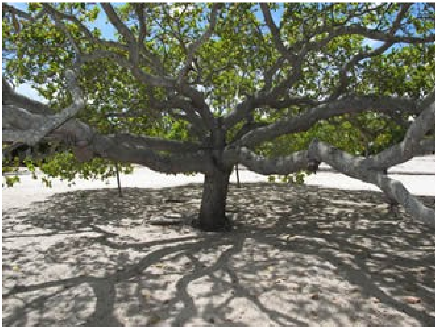
Mangai , l'arbre permettant de confectionner les balles de jeu, grâce au latex qu'il produit.