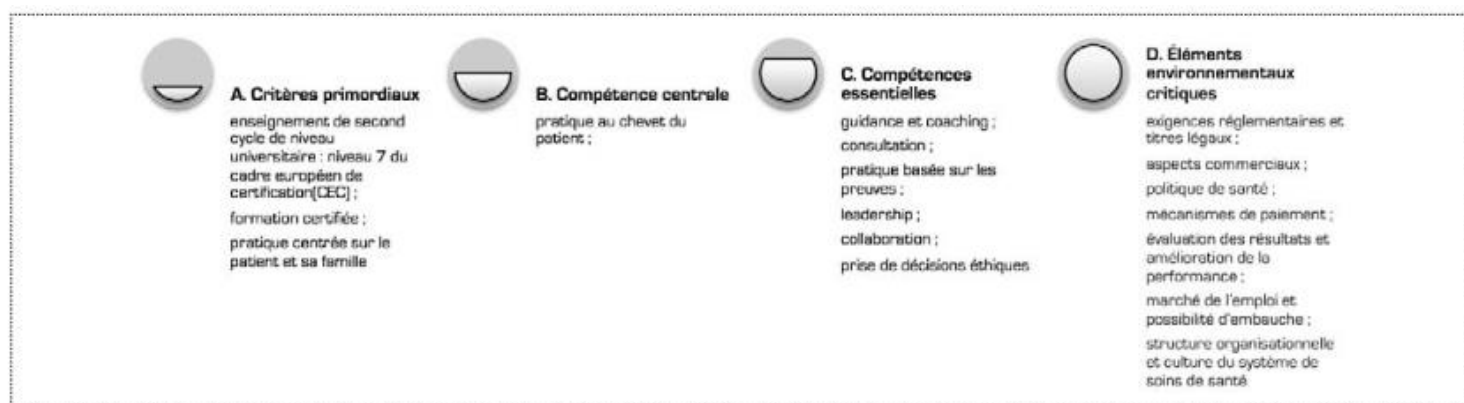
Figure 3 : Modèle conceptuel d'IPA selon Hamric