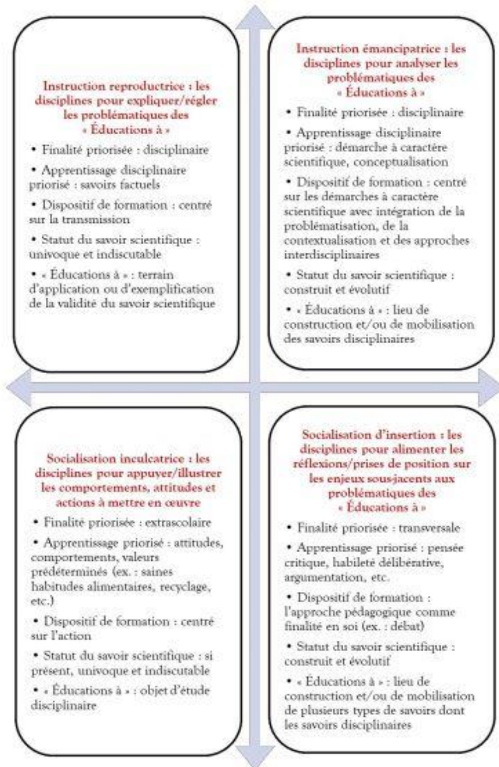
FIGURE 3. Quatre configurations théoriques possibles des relations entre disciplines scolaires et problématiques d'« Éducatons à »