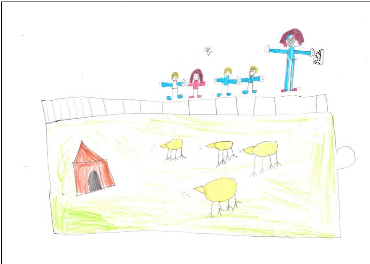
Dessin d'un enfant représentant l'enclos des poules ainsi que quelques élèves et l'animatrice tenant un seau de graines

Globalement, les enfants ont ressenti un bien-être en lien avec la nature : « de bonne humeur, dans la nature », « je me suis sentie comme à la forêt. J'ai vu plein de choses qui viennent de la nature ! Comme des arbres, des feuilles, euh... de l'herbe ». Dans une méta-analyse de 2018 décrite plus haut (43), il est suggéré notamment que l'exposition répétée aux espaces verts diminue la fréquence cardiaque. Mon hypothèse est que cela doit jouer un rôle dans cette sensation de bien-être psychologique au jardin.