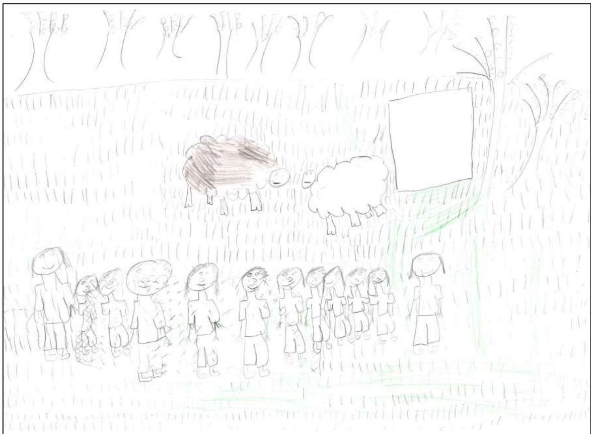
Dessin d'un enfant représentant la classe et l'animatrice devant l'enclos de deux moutons avec en arrière-plan des arbres fruitiers

En premier lieu il ressort que les enfants ont des souvenirs souvent liés à la nature plutôt qu'à la culture des fruits et légumes, ou au jardinage. Ce qui a beaucoup marqué leurs esprits, ce sont les animaux : que ce soit au jardin (les réactions face aux poules et aux moutons étaient vives) ou lorsqu'ils les mentionnent en classe en fin d'année, ou bien encore à travers leurs nombreux dessins d'animaux.