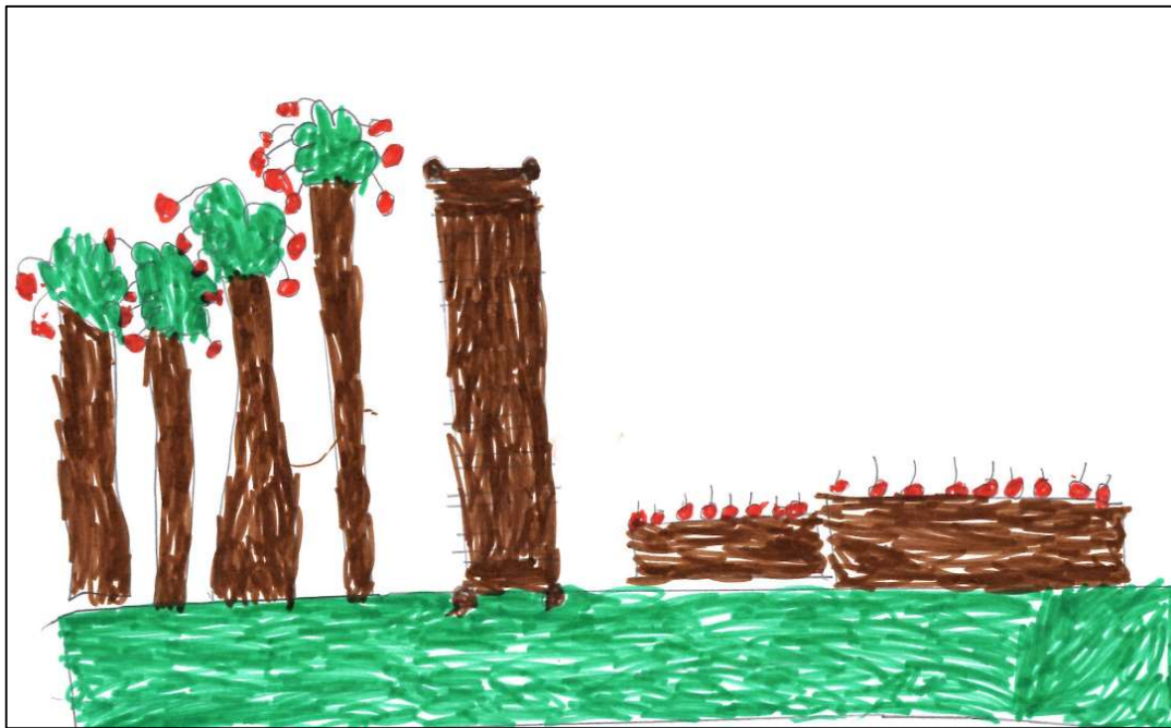
Dessin d'une enfant représentant des pommiers et des tomates dans la terre

(F2a) Enf : « Des pommiers. Ici c'est des tomates. Dans la terre. »