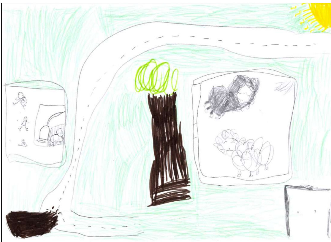
Dessin d'une élève représentant l'enclos des moutons et celui des poules

Lors du focus group de fin d'année, à la question « De quoi vous souvenez-vous au jardin ? », les animaux ressortent beaucoup (« moutons », « poules », « renard », « vers de terre », « oiseaux »), ainsi que les fruits (« fraises », « framboises », « pommes », « tomates ») plutôt que les légumes (« citrouilles », « pommes de terre »).