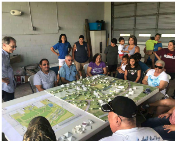
Fig. 10. Atelier de conception. Community Master Planning and Program Development for the Isle de Jean Charles Resettlement - Phase 2 Report (Juin 2021) .

Unies comme un « processus où les membres de la communauté se réunissent pour prendre des mesures collectives et trouver des solutions à des problèmes communs ». Ainsi, dans le but d'imaginer la nouvelle île, l'équipe de conception de la Nouvelle Isle (dirigée par The Louisiana Office of Community Development) a interrogé les résidents au cours d'ateliers mis en place au mois de juin 2018.