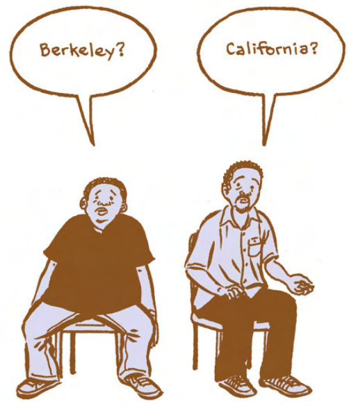
Fig. 8. Josh Neufeld. A.D. New Orleans After the Deluge . 2009.