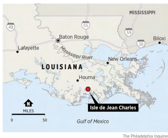
Fig. 3. Carte de L'Isle de Jean Charles. « Why the fate of this tiny Louisiana island is the world's most important news story of 2019», The Philadelphia Inquirer , 2019.