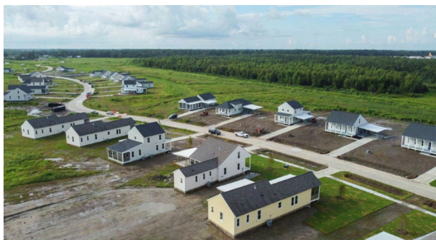
Fig. 7. Vue aérienne des maisons construites à Schriever pour la relocalisation des insulaires de l'Isle de Jean Charles. Photographie par Cécile Clocheret. « How sea level rise drove the native community of Jean Charles from their homes », Abc News . 20 avril 2023.

Cette approche collaborative offre un aperçu précieux sur les migrations climatiques définitives et souligne la nécessité d'une planification efficace pour soutenir les communautés confrontées à de tels défis.