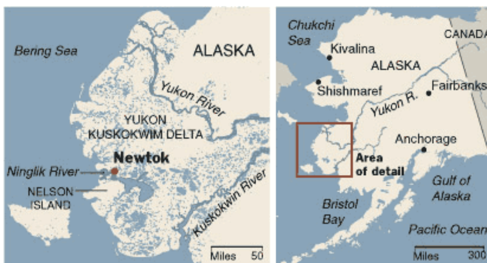
Fig. 2. Carte de Newtok (Alaska). « Newtok, Shishmaref and Kivalina all face major erosion problems », New York Times , 2007.