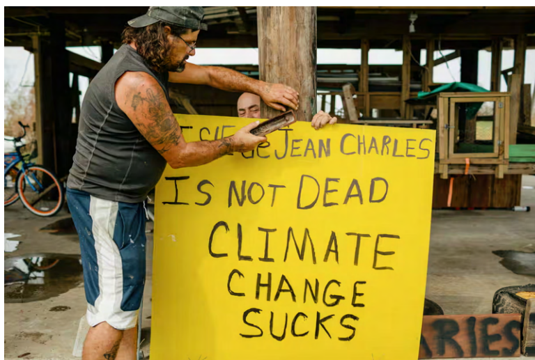
Fig. 12. Photographie par Bryan Tarnowski. « Indigenous residents face the future on Louisiana's coast », The Guardian . 2021.

La résilience peut aussi se manifester au sein des communautés d'origine par la résistance de ceux qui choisissent de rester en dépit des risques environnementaux grandissants. Dans ce contexte, la résilience est intimement liée à la notion d'adaptation qui se réfère à un « processus ou une action au sein d'un système, visant à renforcer la capacité de ce dernier à faire face, à gérer ou à s'ajuster de manière optimale à des conditions changeantes, des contraintes ou des risques » (Wilson, 2012 : 10). C'est dans cet esprit que nous pouvons examiner le système de l'Isle de Jean-Charles dans sa capacité à s'ajuster aux changements, et en modérer les effets pour faire face aux changements endogènes et exogènes. La dernière section du plan de relocalisation a été consacrée à l'Isle pour permettre à ses habitants d'y vivre tant que le temps et la nature le permettront. Les insulaires ont érigé des maisons sur pilotis pour se prémunir contre les inondations, et ont modifié leurs pratiques traditionnelles de pêche pour s'adapter aux nouvelles conditions écologiques.