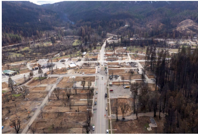
Fig. 5. "Greenville was destroyed by wildfire? Can it be rebuilt to survive the next one ?" Los Angeles Times . 2022.

Cet extrait poignant permet de mettre en avant plusieurs points. Tout d'abord, il souligne la vitesse à laquelle les mouvements migratoires climatiques peuvent se produire, laissant peu de temps pour une préparation adéquate. Les résidents ont dû prendre des décisions importantes rapidement quant à ce qu'ils devaient emporter avec eux, mettant en évidence la nature temporaire de la propriété matérielle lors de catastrophes climatiques majeures. De plus, la citation mentionne la « diaspora désespérée » des résidents obligés de se disperser, soulignant l'impact psychologique de tels déplacements forcés. En revanche, le choix de partir ou de rester peut faire l'objet d'un calcul mûrement réfléchi, où chaque acteur évalue les risques et les bénéfices de sa décision. Ainsi des centaines de personnes ont quitté les Keys de leur propre gré des années suivant l'ouragan Irma, décidant que les risques l'emportent sur les avantages,