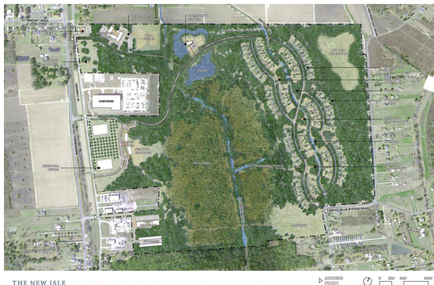
Fig. 11. The New Isle. Atelier de conception. Community Master Planning and Program Development. Isle de Jean Charles Resettlement : Phase 2 Report . (Juin 2021).

The New Isle's design highlights the strong connection between culture, ecology and water. On Isle de Jean Charles, the wetlands, the houses, the space under the houses, the road and the bayou shape the way people relate to their surroundings and to each other. The New Isle's design aims to recreate these spaces and hopefully foster relationships as they do on the island. 7