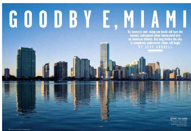
Fig.4. Jeff Goodell. « Goodbye, Miami » Rolling Stone . Juin 2013.

Selon une étude de l'Institut de recherche sur le climat de Miami, la ville pourrait perdre jusqu'à 2,5 millions d'habitants d'ici 2100 en raison de la montée des eaux. L'étude a conclu que la montée des eaux pourrait inonder jusqu'à 25 % de la ville, y compris des zones densément peuplées comme Downtown Miami et Miami Beach.