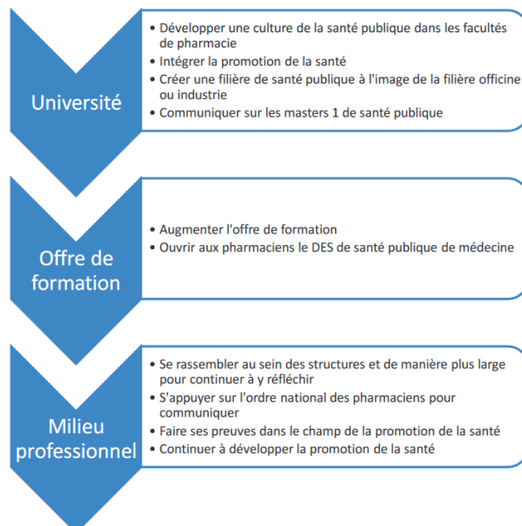
Figure 2 : Leviers pour le développement de la place du pharmacien dans le champ de la promotion de la santé (18)

Afin de développer la place du pharmacien d'officine dans la prévention primaire et la promotion de la santé, trois leviers sur lesquels agir ont été identifiés: l'université, l'offre de formation et le milieu professionnel. Ces éléments sont détaillés dans la Figure 2.