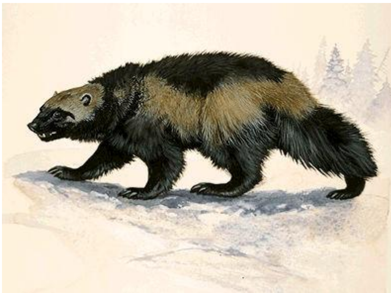
Fig. 1 Allure générale du glouton. Dessin de Jan Sovak, 1989

Son pelage est constitué d'une couche de sous-poil et d'une couche de poils de couverture. En hiver, son pelage est épais et brun foncé. Une bande de fourrure marron clair s'étend de chaque côté du corps depuis les épaules jusqu'à la croupe en se rejoignant au niveau de la queue. Chaque individu présente un modèle de coloration unique en ce qui concerne la répartition des zones de pelages claires notamment au niveau des flancs, de la gorge, de la poitrine et des pattes ; ce qui permet de les différencier. Les gloutons muent au printemps à l'automne [14, 16, 17].