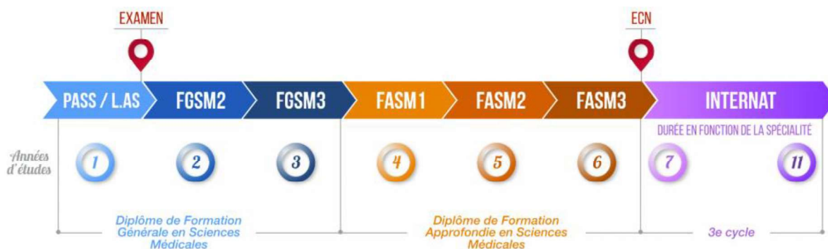
SCHÉMA DES ÉTUDES MÉDICALES

Durant leur cursus, les étudiants en premier et deuxième cycle effectuent des stages à l'hôpital ou chez des praticiens de ville en médecine générale, leur permettant de mettre de confronter leurs connaissances théoriques à la pratique médicale spécifique de la médecine générale.