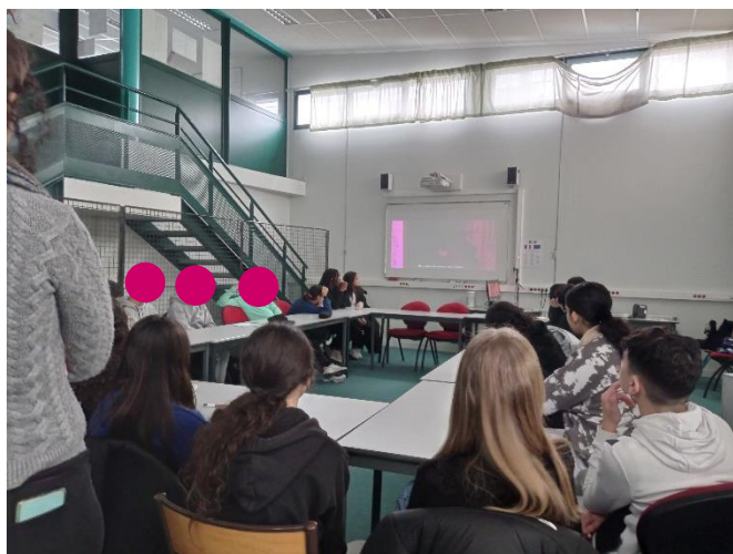
1 Les élèves visionnent un extrait de Je m'appelle Bagdad dans la salle principale du parcours