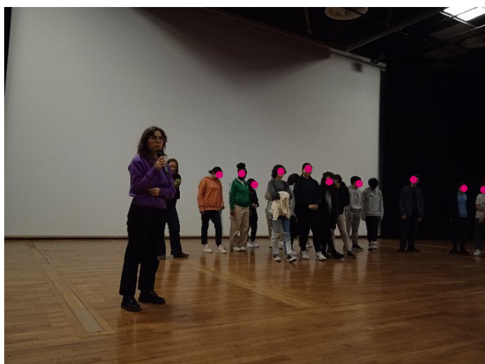
3 Les élèves et intervenantes lors de la restitution