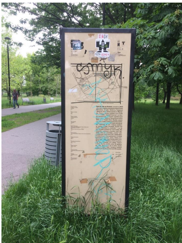
fig. 62 Panneau informant sur le Parc des Sculptures, Varsovie