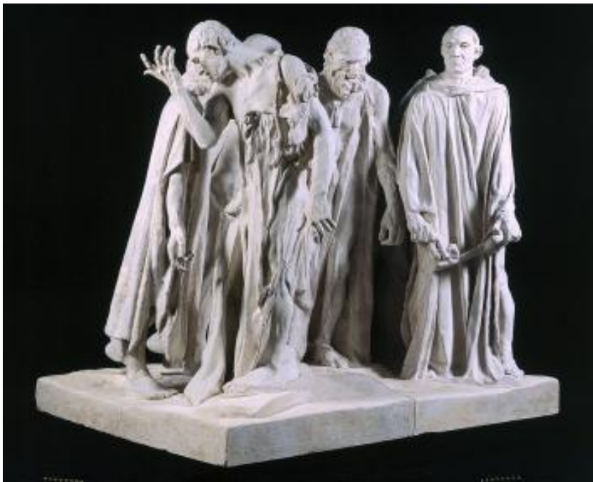
fig. 4 Auguste Rodin, Monument des Bourgeois de Calais, 1889, Calais, © Musée Rodin