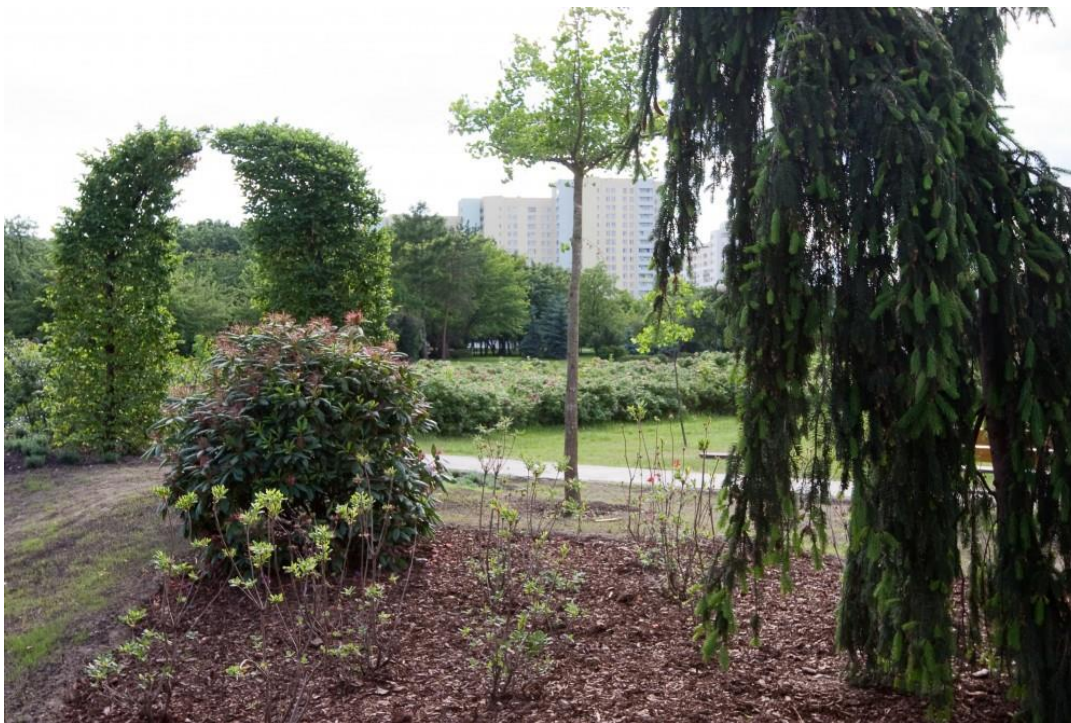
fig. 33 Pawel Althamer, Raj, 2009, photo : Bartosz Stawiarski