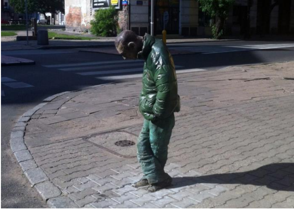
fig. 23 Paweł Althamer, Guma , 2009, Warszawa, source : puszka.waw.pl