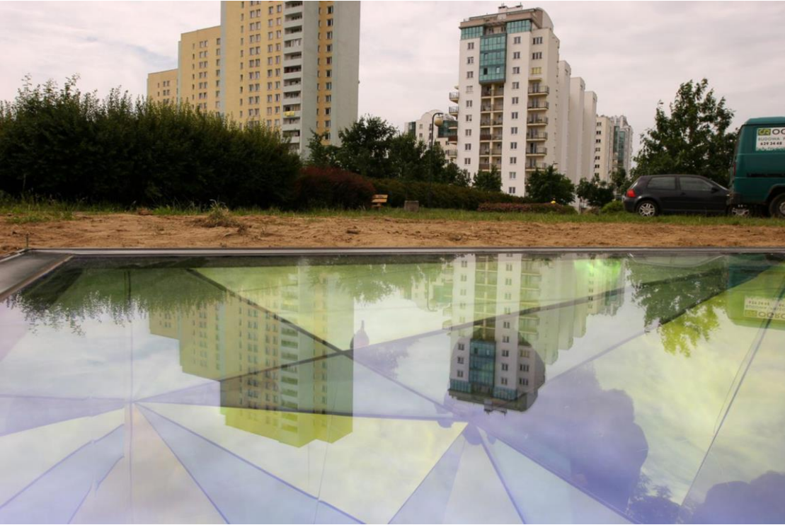
fig.54 Olafur Eliasson, Negative glacier kaleidoscope, 2007, photo : Joanna Mytkowska