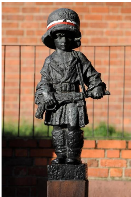
fig. 18 Jerzy Jarnuszkiewicz, Monument du petit insurgé, 1983