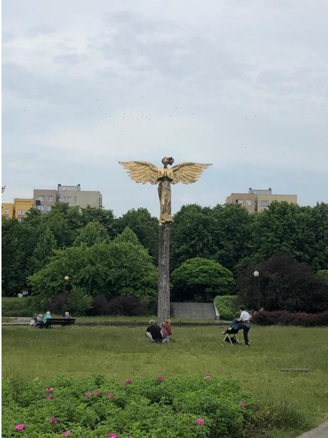
fig. 40 Roman Stanczak, Aniol Stroz, 2013, photo : Martine Chupin