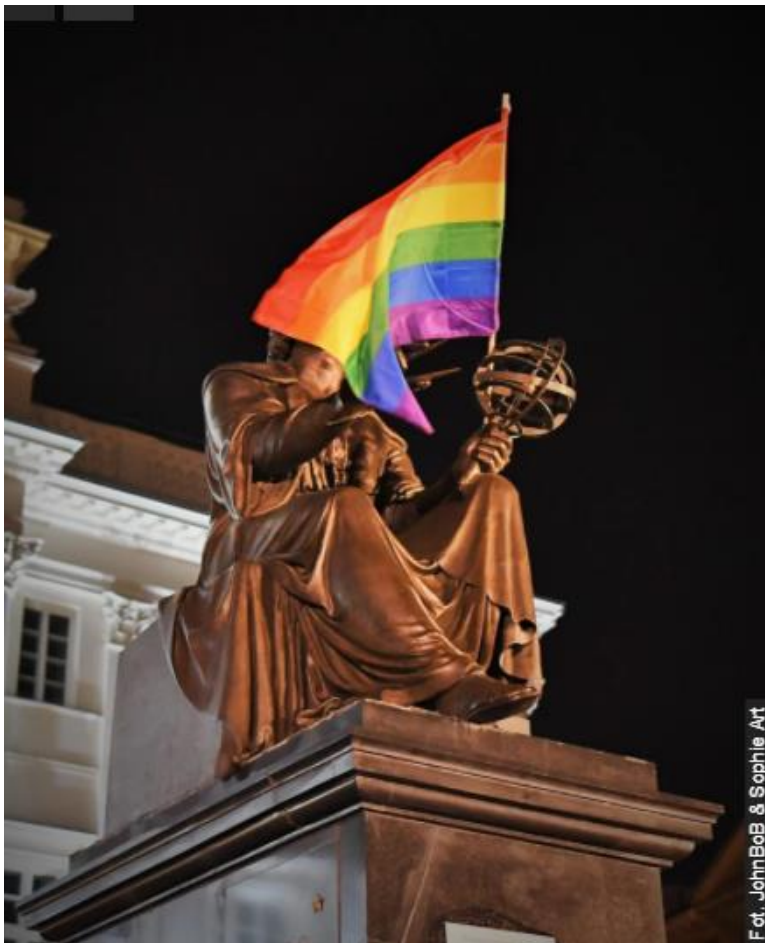
fig. 16 Drapeau LGBT posé sur monument de Mikolaj Kopernik, aout 2020, Varsovie