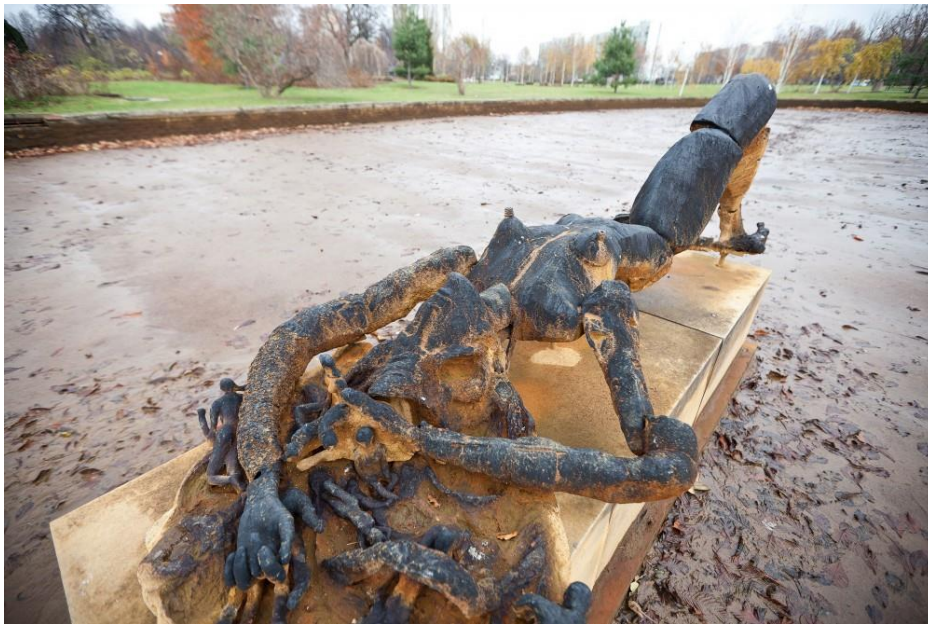
fig. 41 Pawel Althamer & Grupa Nowolipie, Sylvia, 2010, photo : Bartosz Stawiarski