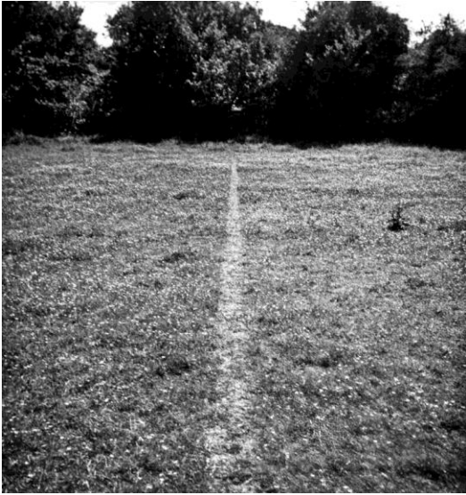
fig. 9 Richard Long, A line made by walking , 1967, © Richard Long