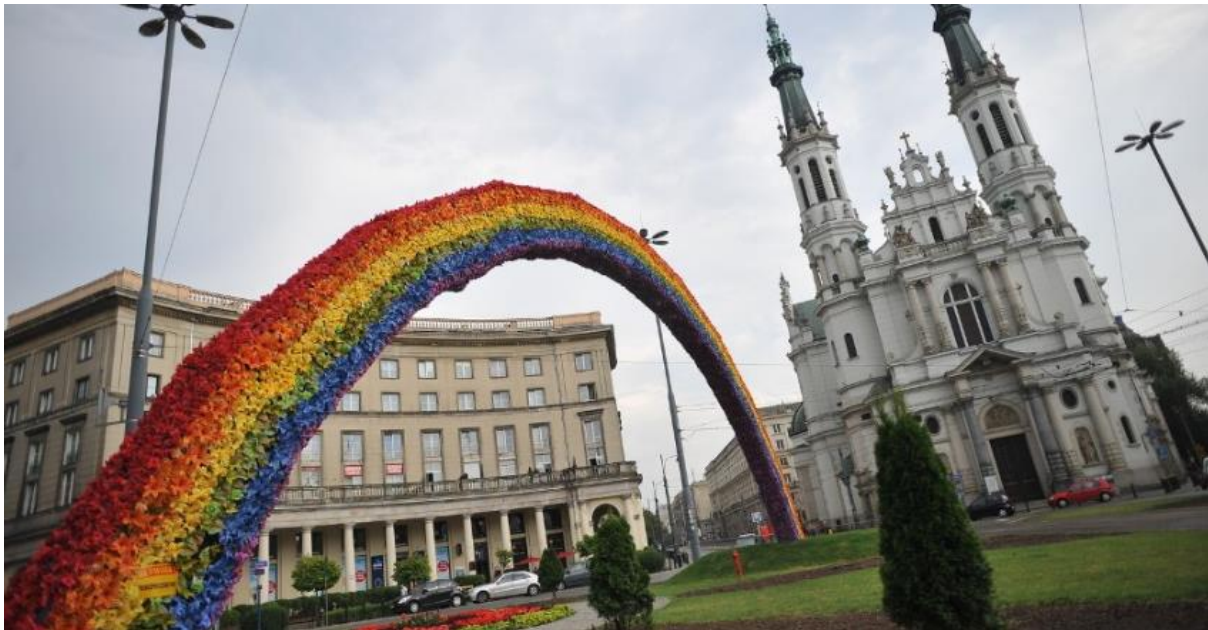
fig. 14 Julita Wojcik, Tecza, 2012, Plac Zbawiciela, Warszawa