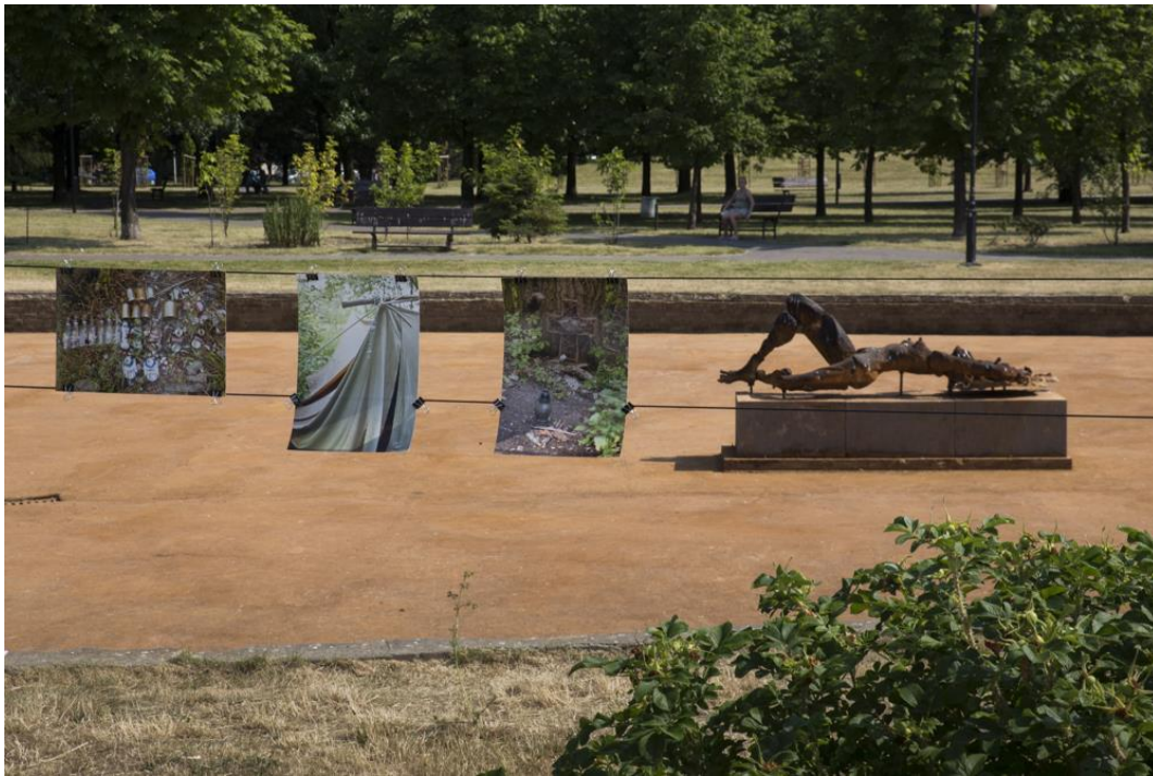
fig. 44 Honorata Martin, Zadomowienie, 2015, exposition finale