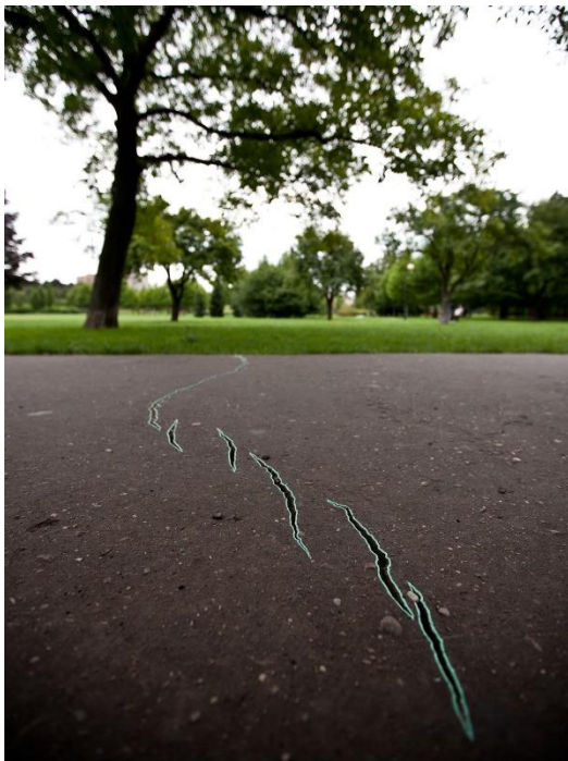
fig. 28 Katarzyna Przewawska, Sans titres (Interventions peintes) , 2010