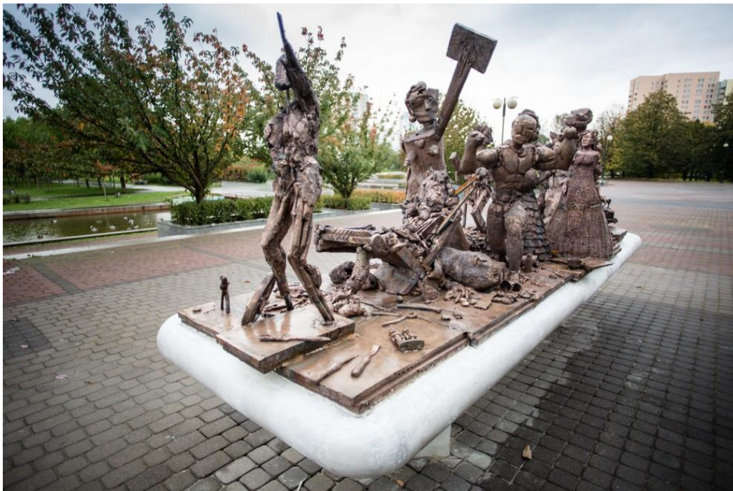
fig. 51 Oeuvre collective, Mieszczanie z Brodna, 2017