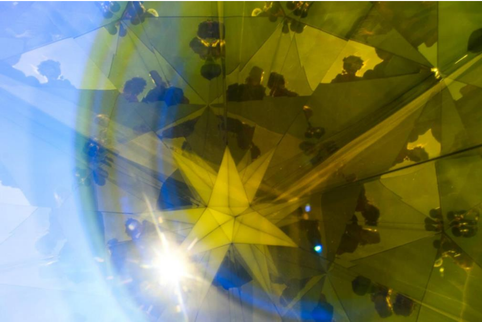
fig. 55 Olafur Eliasson, Negative glacier kaleidoscope, 2007