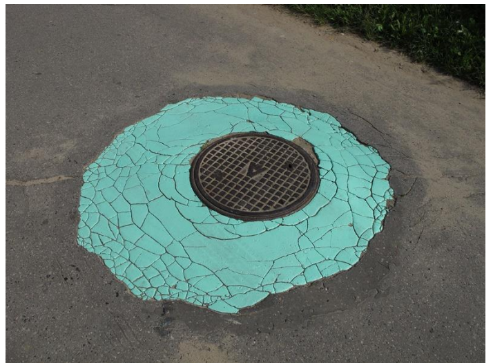
fig. 29 Katarzyna Przewawska, Sans titres (Interventions peintes) , 2010