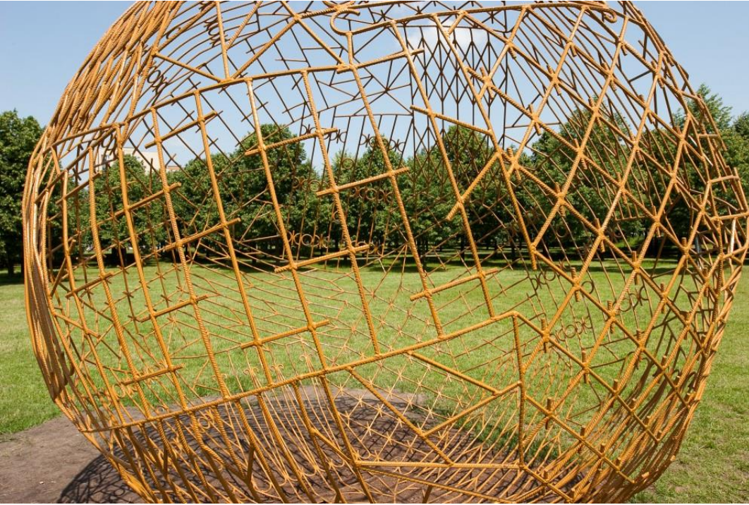
fig. 52 Monika Sosnowska, Krata, 2009