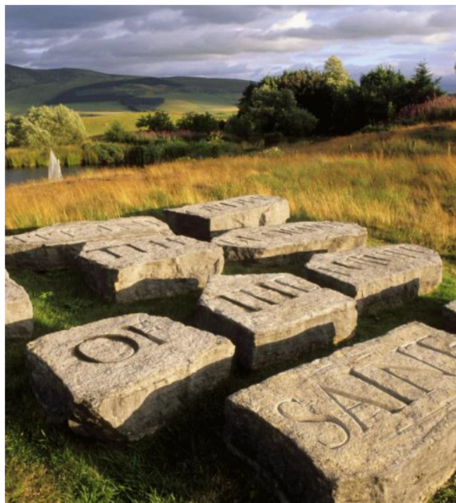
fig. 12 Ian Hamilton Finlay, Little Sparta