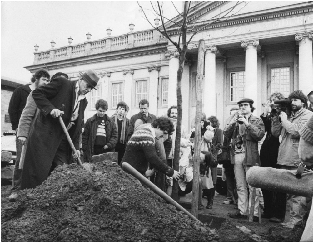
fig. 13 Joseph Beuys, 7000 Oaks, 1982, Documenta 7, source : https://www.awatrees.com/2019/12/06/joseph-beuys-the-art-of-arboriculture/