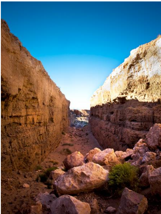
fig. 11 Michael Heizer, Double Negative , photo : Ken McCown / The Cultural Landscape Foundation