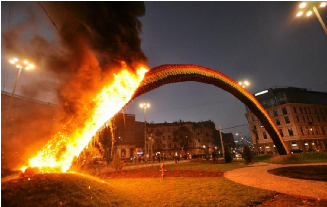
fig. 15 Incendie de L'arc-en-ciel (Teczka) en 2013, Varsovie, photo : Magorzata Gendlek / Agencja Gazeta