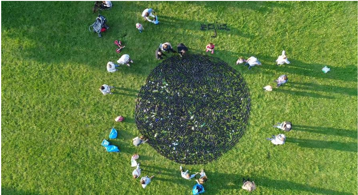
fig.56 Reconstruction de l'oeuvre Arctic Circle de Rasheed Araeen, 2017, capture d'écran du film Rekonstrukcja rzeźby Rasheeda Araeena, source : http://www.park.artmuseum.pl/pl/film/o-parku/powtarzanie-materialu/1