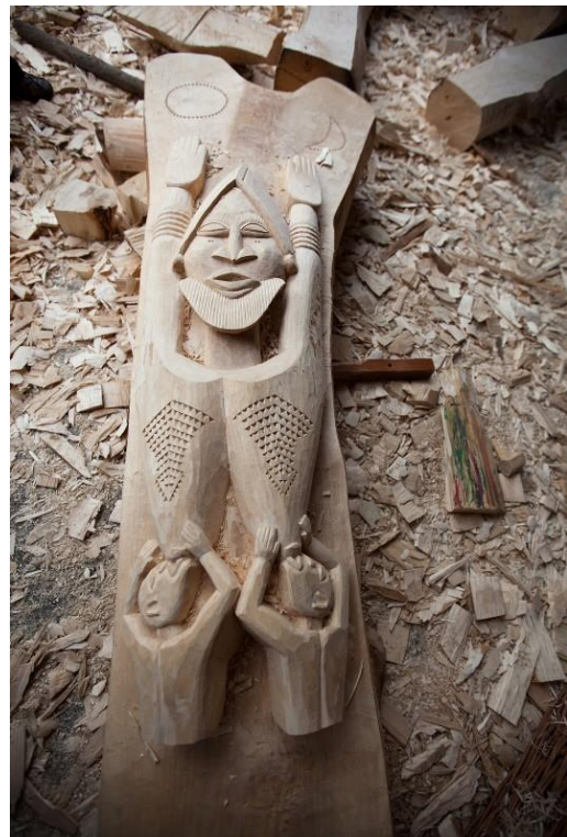
fig. 49 Pawel Althamer, Youssouf Dara, Toguna, 2011, photo : Bartosz Stawiarski