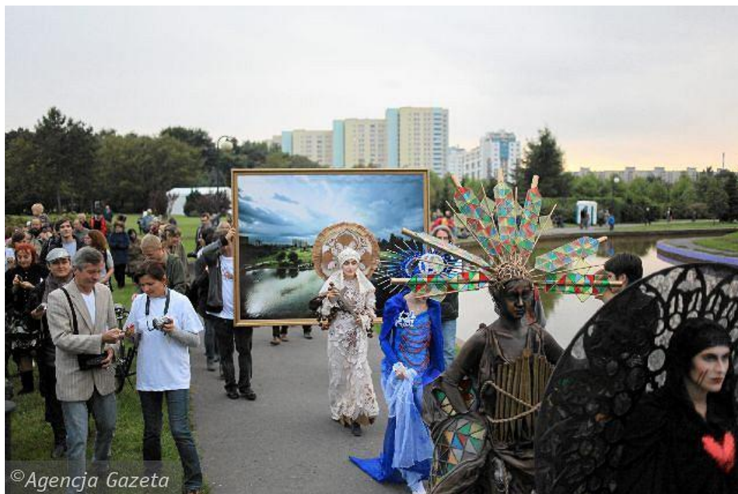
fig. 34 Pawel Althamer, Procesja, 2010, photo : Albert Zawada / Agencja Gazeta