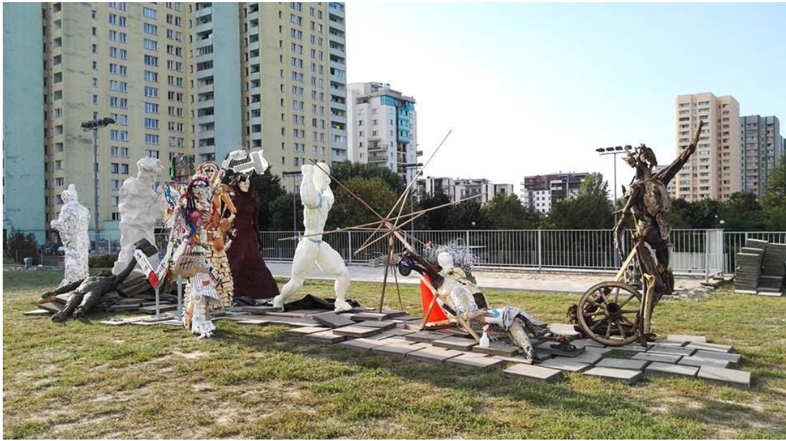
fig. 50 Oeuvre collective, Mieszczanie z Brodna, 2017, source : https://mieszkanieciargowka.pl/index.php/2017/09/19/mieszczanie-brodna-parku-brodnowskim/