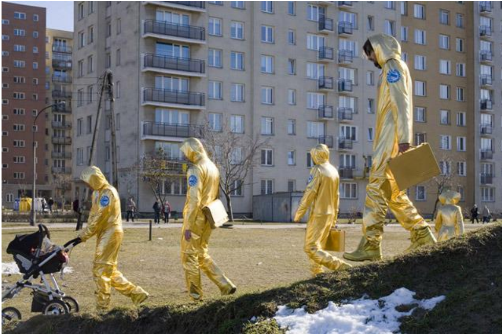
fig. 21 Pawel Althamer, Common Task , 2009, Bruxelles, source : https://www.scoop.it/topic/art-installations/?tag=Pawe%C5%82+Althamer