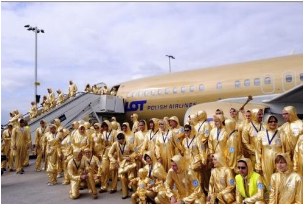
fig. 22 Pawel Althamer, Common Task , Brodno