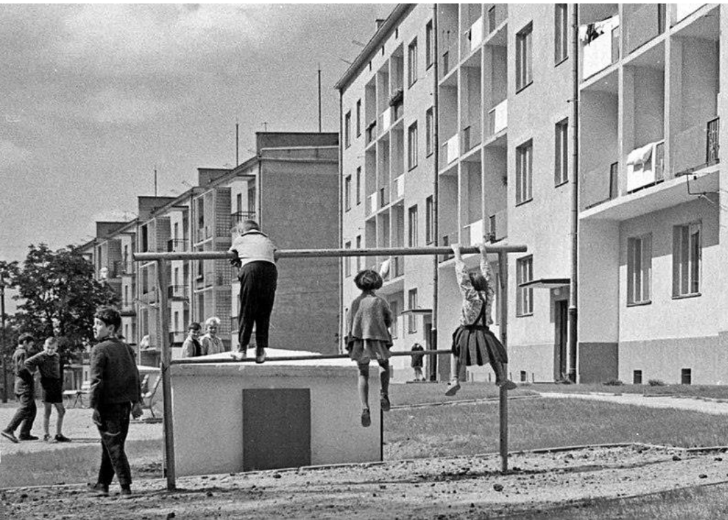
fig. 53 Enfants s'amuse sur un "trzepak" (carpet hanger) Lodz, années 50-60