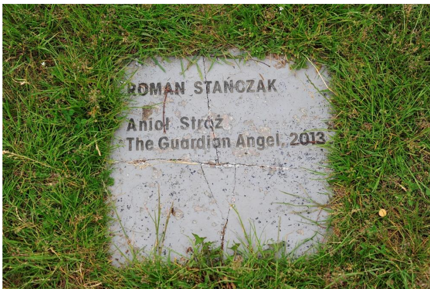
fig. 60 Exemple de cartel réalisé par Monika Sosnowska