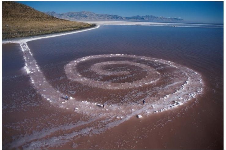
fig. 10 Robert Smithson, Spiral Jetty , Great Salt Lake, Utah, 1970, ©Robert Smithson