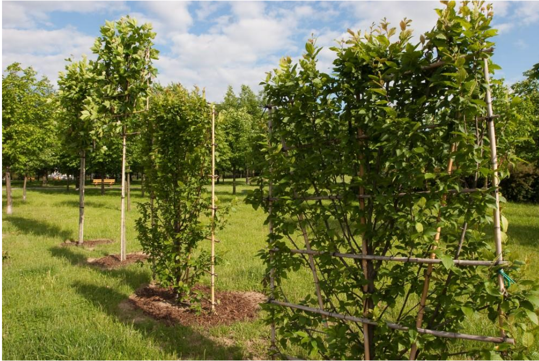
fig. 32 Pawel Althamer, Raj, 2009, photo : Bartosz Stawiarski