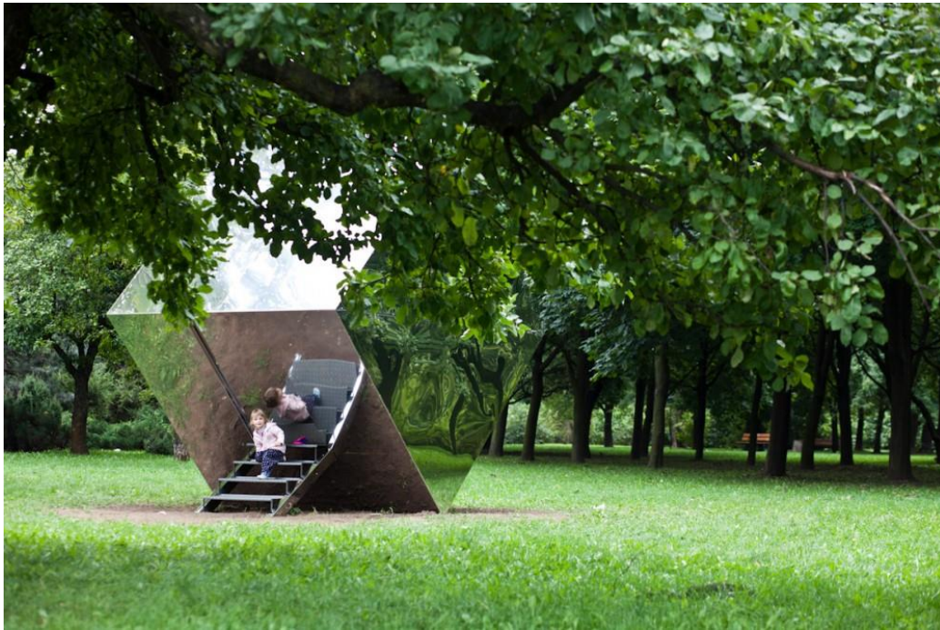
fig. 30 Rirkrit Tiravanija, Bez tytułu (przewrócony domek herbaciany z ekspresem do kawy) , 2009, photo : Bartosz Stawiarski