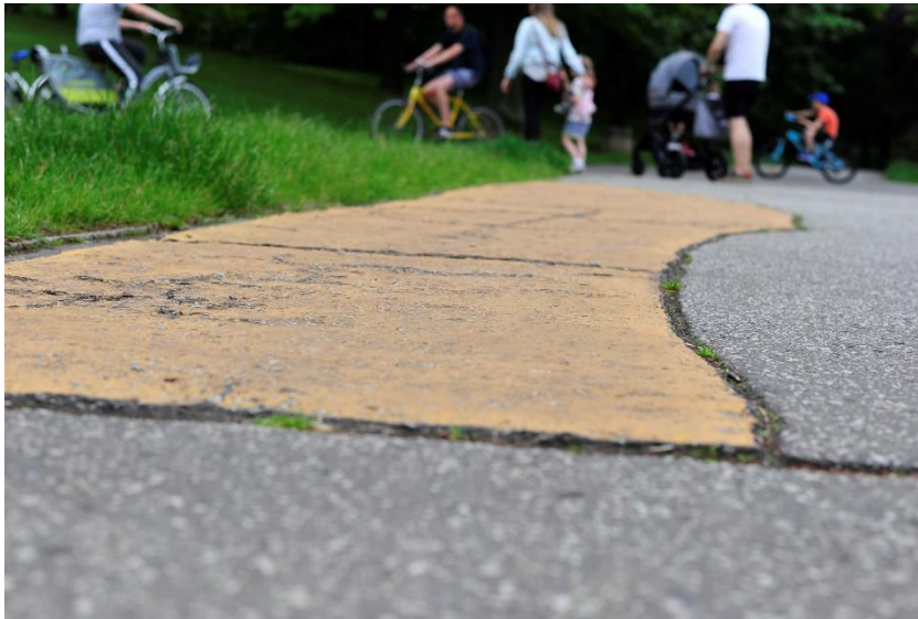
fig. 27 Katarzyna Przewawska, Sans titres (Interventions peintes) , 2010