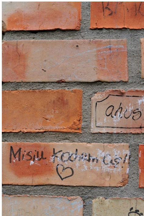
fig. 26 Fragment de la sculpture Brodno de Jens Haaning, 2012