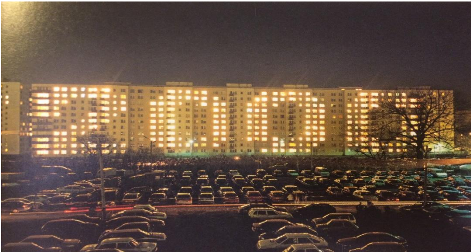
fig. 20 Pawel Althamer, Brodno 2000, Warszawa