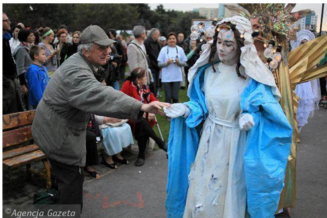
fig. 35 Pawel Althamer, Procesja, 2010