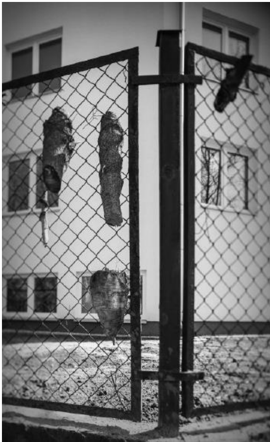
fig. 58 Reliques naturelles, Weneckie Biennale na Brodnie, 2018