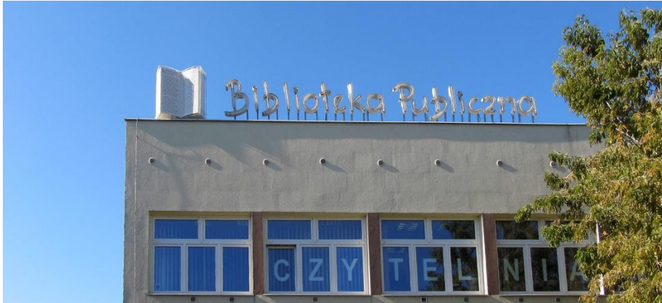
fig. 19 Pawel Althamer, Biblioteka Publiczna, 2010