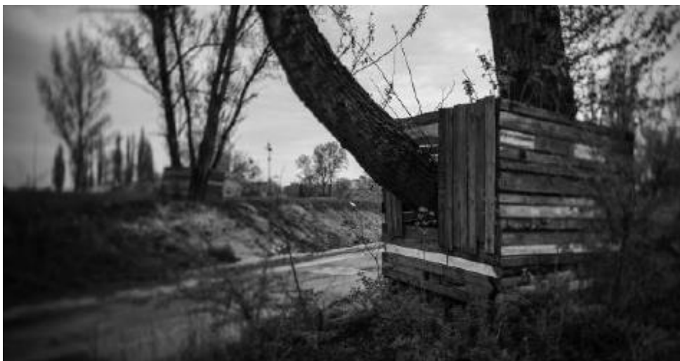
fig. 59 Les arbres renforcés, Weneckie Biennale na Brodnie, 2018