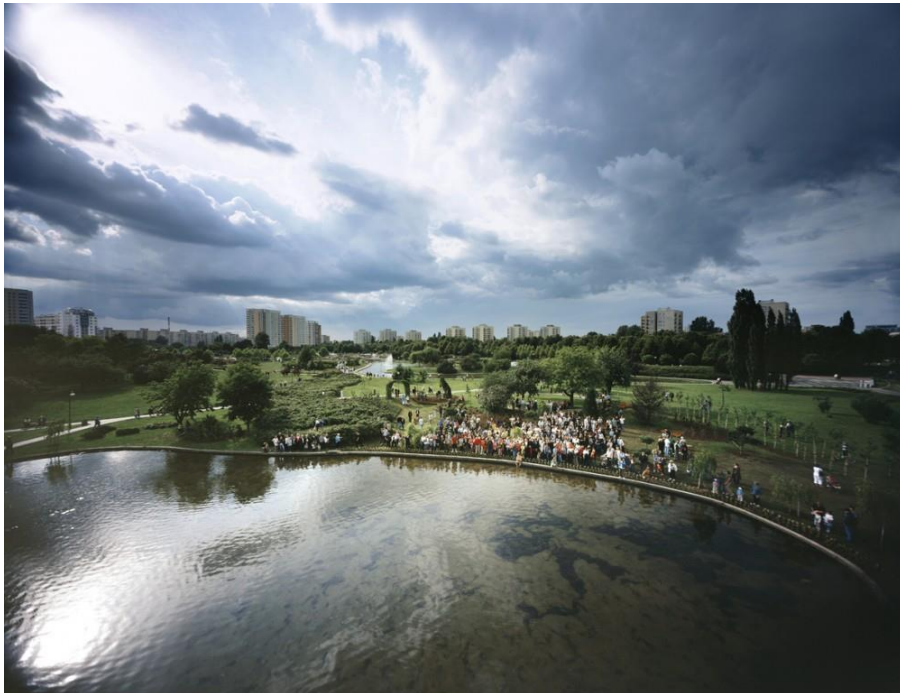
fig. 1 Pawel Althamer, Raj, 2009, Warszawa, photo : Jan Smaga