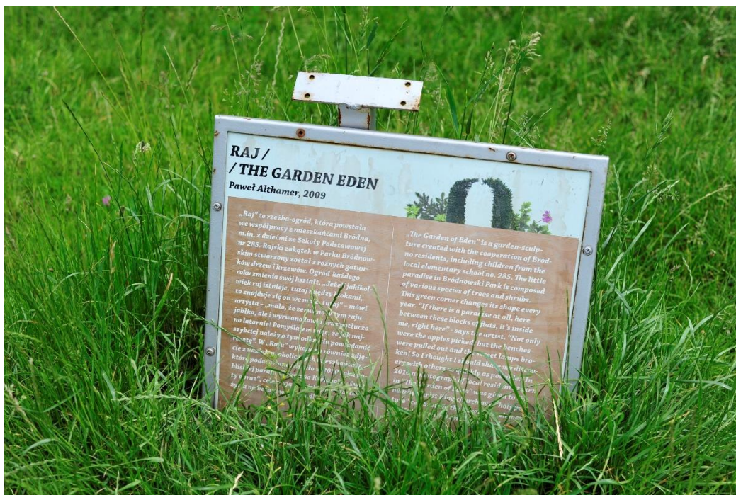
fig. 61 Exemple de cartel détaillé du Parc des Sculptures