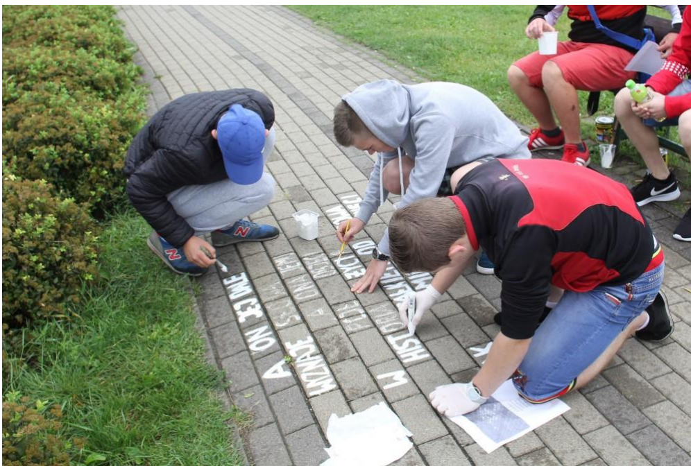
fig. 57 Jeunes participants en train de réécrire les poemes d'Andrzej Przybysz, 2017