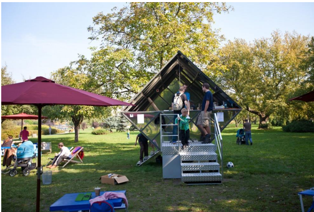
fig. 31 Pawel Althamer, Domek herbaciany , 2010, photo : Bartosz Stawiarski