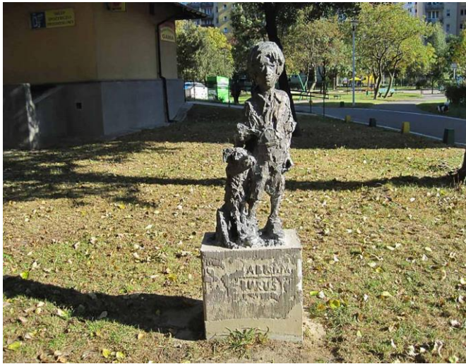
fig. 17 Paweł Althamer, Abram i Burus, 2007, Warszawa