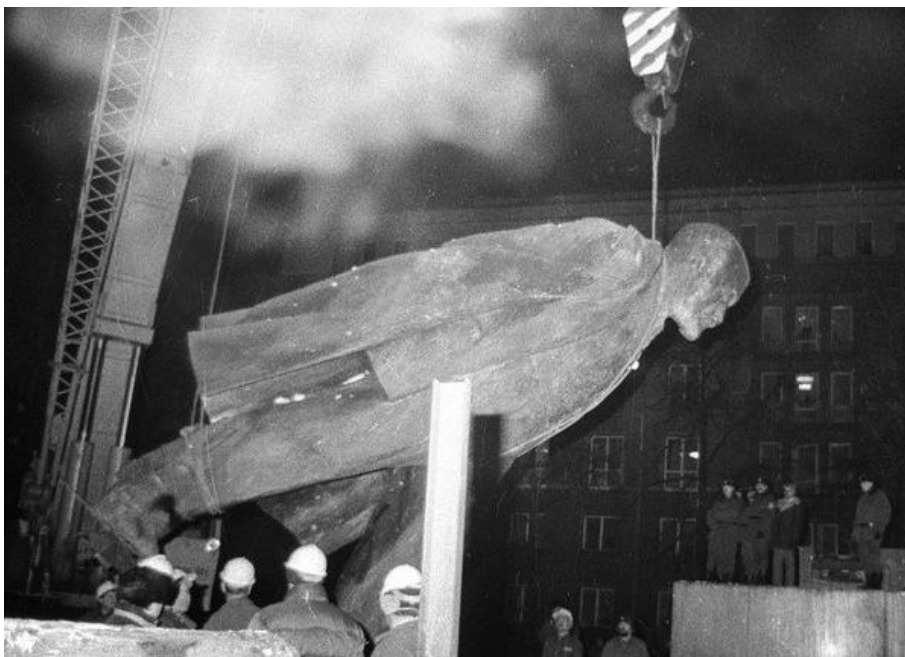
fig. 2 Démolition de la sculpture de Lenin à Nowa Huta, 1989, photo : Stanislaw Gawlinski/Fotonova