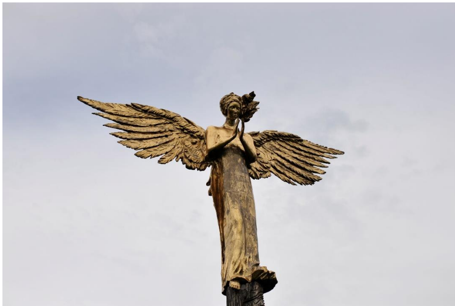
fig. 39 Roman Stanczak, Aniol Stroz, 2013