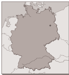
Figure 9 : carte géographique de l'Allemagne

En 2002, l'Allemagne est devenue la première nation européenne à faire rentrer la protection de l'animal dans sa Constitution. La majorité des députés de la chambre basse du Bundestag ont voté en mars 2002 pour ajouter les mots « et les animaux » à une disposition obligeant l'État à respecter et à protéger la dignité des êtres humains. Le vote a été approuvé par la chambre haute en été 2002, et la protection animale est inscrite dans la Constitution depuis juillet 2002. [25]