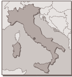
Figure 4 : carte géographique de l'Italie

L'opinion publique a beaucoup changé en ce qui concerne le statut de l'animal, qui n'est plus uniquement considéré en Italie comme une source de services et d'aliments. A ce mouvement correspondent aussi un changement relativement récent de la législation et l'émergence d'un nouveau statut juridique.