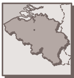
Figure 5 : carte géographique de la Belgique

Le statut juridique donné à l'animal est quasiment le même qu'en France : il est considéré comme une chose par le droit des biens, mais le droit pénal belge créé en 1867, évoquait déjà les premiers textes généraux de défense des animaux.