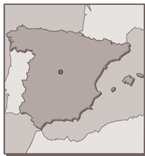
Figure 1 : carte géographique de l'Espagne

Comme dans les autres États Membres, l'animal est un bien sur lequel s'exerce un droit de propriété, qui peut se vendre et que l'on peut utiliser dans différents domaines. La distinction vient de la façon dont est considérée la sensibilité animale, prise en considération relativement récente.