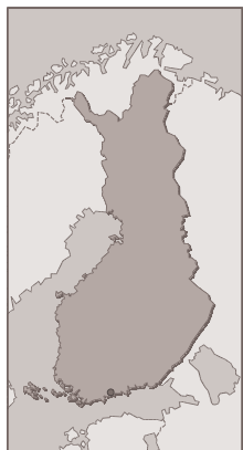
Figure 11 : carte géographique de la Finlande

La Finlande est un pays qui attache une grande importance au bien-être animal.