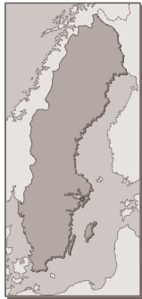
Figure 14 : carte géographique de la Suède

La Suède a plaidé, en novembre 2002 à Stockholm, pour la création d'une nouvelle autorité européenne sur le bien-être animal, en ouverture d'une conférence de l'Union Européenne sur l'amélioration des conditions de vie des animaux. La ministre suédoise de l'Agriculture de l'époque, Margareta WINBERG, avait même déclaré à cette occasion que les « animaux étaient des êtres pensants avec une valeur intrinsèque ». [25]