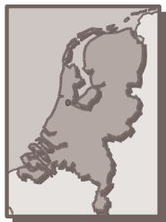
Figure 7 : carte géographique des Pays-Bas

Les animaux domestiques, de rente et sauvages sont considérés comme des choses par la législation hollandaise, mais comme en France, son statut d'objet vivant a donné lieu à quelques aménagements du Code civil. Il existe une responsabilité du fait des animaux, appelée aussi responsabilité de risque. Cette responsabilité est incorporée au Code civil dans l'article 179 du livre 6 du Code civil.