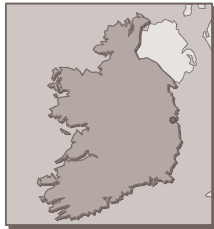
Figure 12 : carte géographique de l'Irlande

La législation a très tôt pris en considération la sensibilité animale : la première loi sur la protection des animaux remonte en effet à 1911 et concernait les actes de cruauté envers les animaux. Cette loi est commune au Royaume-Uni et à l'Irlande et nous la développerons ultérieurement. Elle a été modifiée par un amendement en 1965 (loi n°10/1965).