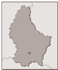
Figure 8 : carte géographique du Luxembourg

Il n'y a pas de statut juridique particulier à l'animal pour le moment, mais il est prévu d'inscrire l'animal, en tant qu'être protégé, dans la constitution.