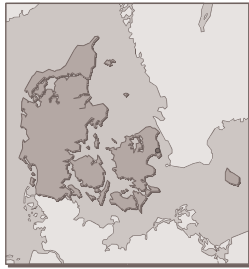
Figure 6 : carte géographique du Danemark

L'animal est considéré comme un bien cessible par la vente, l'établissement d'un contrat de vente étant même fortement recommandé, qu'il soit écrit ou oral. Toutefois, les juristes rappellent que le contrat écrit a certains avantages dans le cas de conflits entre les parties.