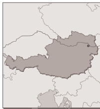
Figure 10 : carte géographique de l'Autriche

La loi fédérale n°179/1988, votée le 10 mars 1988 a inséré dans le Code civil autrichien le principe suivant : « les animaux ne sont pas des choses ; ils sont protégés par des lois particulières. Les dispositions s'appliquant aux choses ne doivent être appliquées aux animaux que quand il n'y a pas d'autres règlements ». [1]