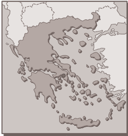
Figure 2 : carte géographique de la Grèce

Les animaux sont considérés comme des biens volontiers inanimés. La législation prend peu en compte la sensibilité animale. Ce qui peut paraître paradoxal : dans la Grèce Antique, les prêtres qui étaient responsables de l'abattage, aspergeaient d'eau sacrée le front des animaux qui devaient être sacrifiés. La bête s'ébrouait en remuant la tête, ce qui était considéré comme un assentiment de sa part. [77]