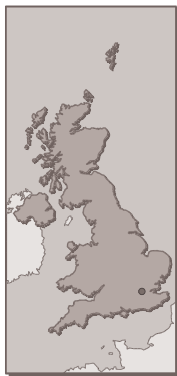
Figure 13 : carte géographique du Royaume-Uni

Le Royaume-Uni a été le premier pays à prendre en compte la sensibilité animale dans sa législation. Il a en effet une longue histoire de protection des animaux contre les actes de cruauté.