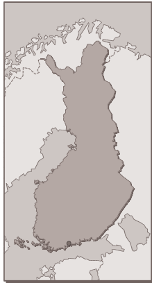
Figure 11 : carte géographique de la Finlande

La Finlande est un pays qui attache une grande importance au bien-être animal.