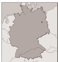
Figure 9 : carte géographique de l'Allemagne

En 2002, l'Allemagne est devenue la première nation européenne à faire rentrer la protection de l'animal dans sa Constitution. La majorité des députés de la chambre basse du Bundestag ont voté en mars 2002 pour ajouter les mots « et les animaux » à une disposition obligeant l'État à respecter et à protéger la dignité des êtres humains. Le vote a été approuvé par la chambre haute en été 2002, et la protection animale est inscrite dans la Constitution depuis juillet 2002. [25]