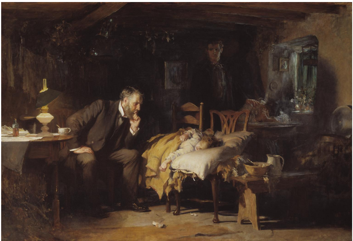
Luke Fildes, The Doctor , 1891