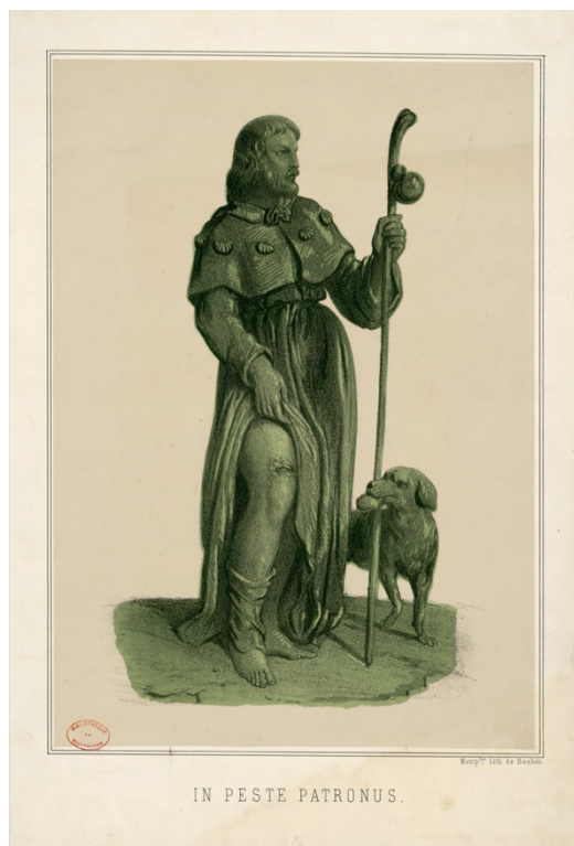
Figure 4 : Lithographie de saint Roch, Montpellier, s.n., 1830-1890, https://gallica.bnf.fr/ark:/12148/btv1b10661454w/f1

Ces lithographies remises aux fidèles leur permettaient de posséder un objet simple, pouvant recevoir la bénédiction du curé de la paroisse et faisant office de bien de protection divine. Saint Roch est le plus souvent représenté debout, droit, le visage serein, son regard tourné au loin, vers un horizon paisible. De son doigt, il pointe la blessure qui entaille sa cuisse rappelant à tous sa guérison miraculeuse. Cette allégorie de toutes les plaies évoque ici l'expression des souffrances soulevées par les épidémies de choléra. Le saint, représenté ici avec tous ses attributs, guide alors les fidèles sur un chemin rassurant, loin des ravages de la maladie. Il est aussi le puissant intercesseur de toutes les prières et de toutes les supplications :