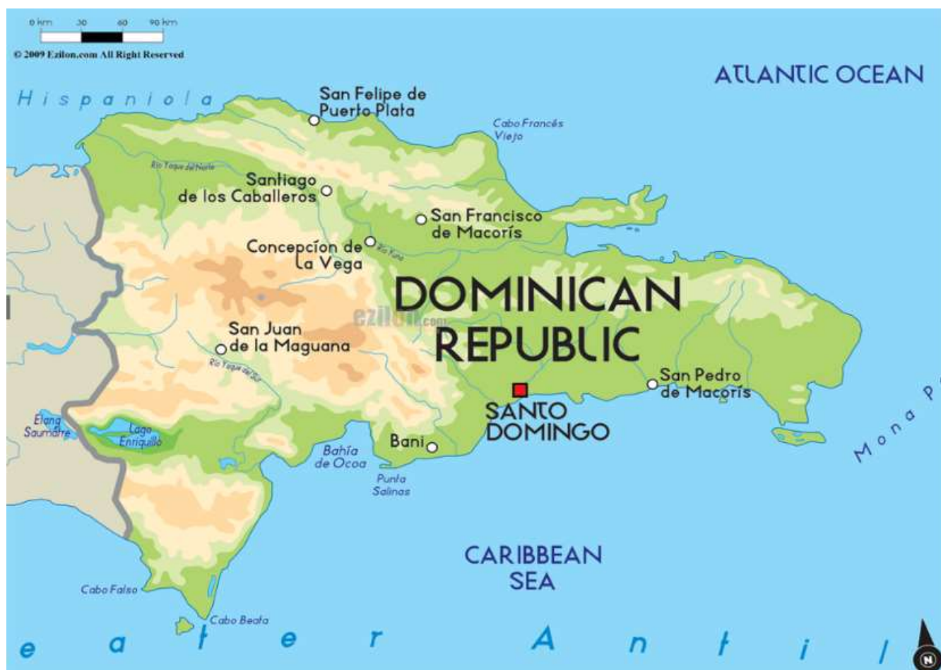
Figure 1 : Carte simplifiée de la République dominicaine