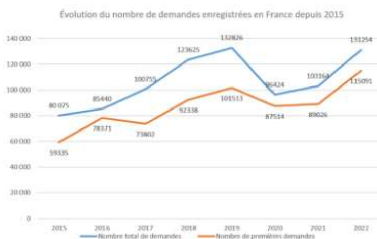
Figure 1 : Evolution du nombre de demandes d'asile enregistrées auprès de l'OFPRA (21)

Début 2023, il y avait environ 547 000 réfugiés en France (20), ce qui représente environ 0,8% de la population française. Durant l'année 2023, 142 000 demandes d'asile ont été enregistrées auprès de l'OFPRA, dont 123 400 sont des nouvelles demandes. On note une augmentation de plus de 75% du nombre de demandes d'asile depuis 2015 (8).