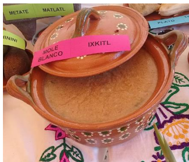
Figura 3 Cazuela de barro

Nota. Adaptado de muestra de gastronomía Náhuatl [Fotografía], por Wikimedia, 2016, ( https://commons.wikimedia.org/wiki/File:Muestra_de_Cocina_tradicional_nahua_de_la_Sierra_de_Zongolica,_Veracruz_04.jpg )