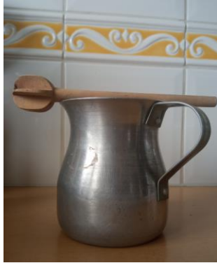
Figura 5 Olleta y Molinillo

Nota. Adaptado de Olleta y Molinillo [Fotografía], por AVILA Karol, 2024