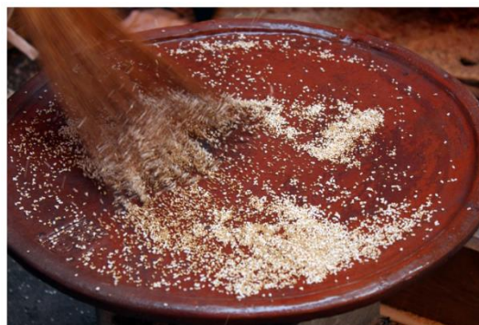
Figura 1 Comal

Nota. Adaptado de Comal [Fotografía], por Cooks'Info, 2016, ( https://www.cooksinfo.com/comal ).