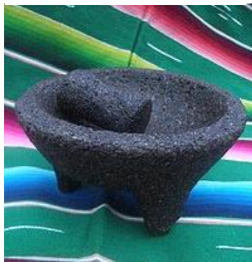
Figura 2 Molcajete

Nota. Adaptado de Molcajete [Fotografía], por Wikipedia, 2023, ( https://fr.wikipedia.org/wiki/Molcajete ).