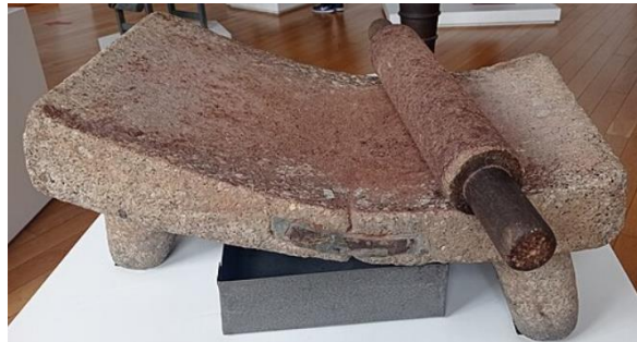
Figura 4 Metate

Nota. Adaptado de Metate [Fotografía], por Wikimedia, 2024, ( https://commons.wikimedia.org/wiki/File:Metate._Museo_del_Chocolate_de_Astorga.jpg )