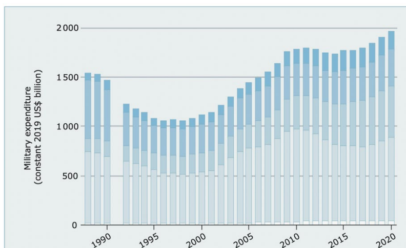
Annexe 1. Dépenses militaires mondiales, par région, 1988 – 2020.