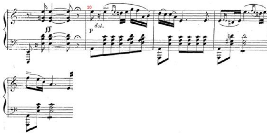
Figure 20 : Le Tombeau. Extrait du numéro musical 16. Les premières mesures de l'introduction instrumentale du chœur des jeunes kieviennes, la mineur, 3/4. Partition p. 129

Le rythme de l'orchestre accompagne le thème dans le registre aigue. D'après le musicologue Gozenpud 359 , cette mélodie est exécutée au violon et monterait le gout de Verstovskij pour l'utilisation d'instruments solos dans l'orchestration. L'introduction d'un instrument soliste est une technique favorite des compositeurs romantiques et nous pourrions invoquer de nouveau l'ombre du Freischiütz de Weber. Le thème de Max, l'amoureux d'Agathe, est joué par une clarinette solo.