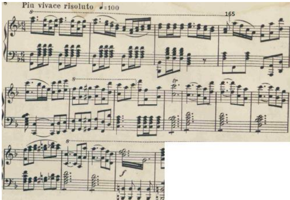
Figure 14 : Le Tombeau. Finale de l'Ouverture. Mesures 165 à 176. Édition 1877, p 8.

Puis, la coda sur 23 mesures affirme la joie, le thème B (Torop) s'entend dans le registre aigue de l'orchestre (mesures 195 à 199).