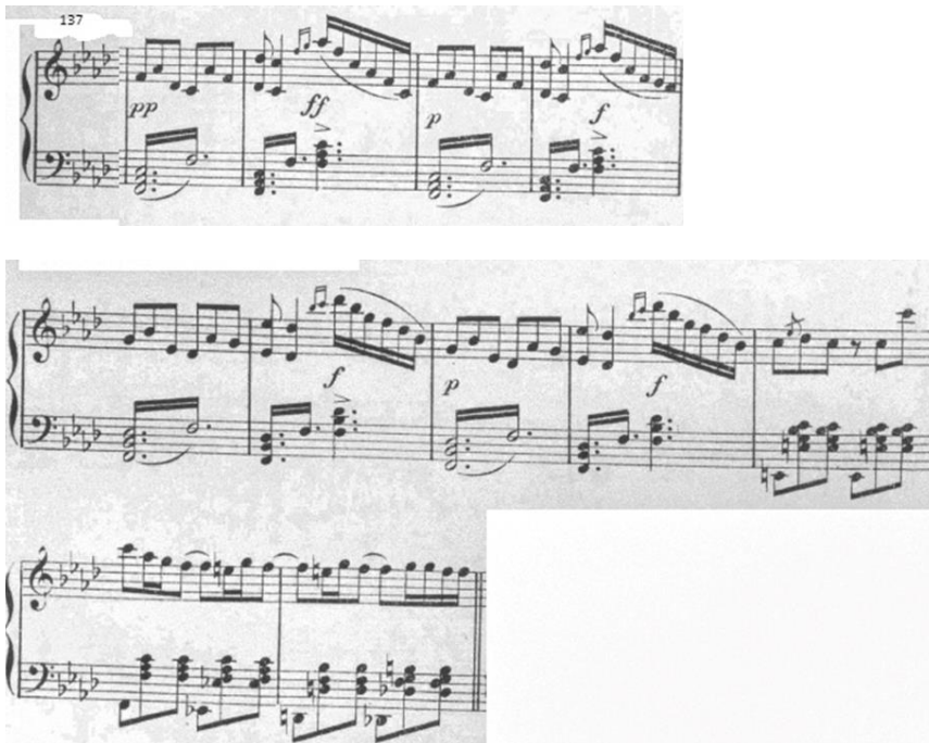
Figure 13 : Le Tombeau. Ouverture. Mesures 137 à 147 ; fa mineur. Partition 1877, p.7.

Le compositeur utilise des contrastes pp/ff et p/f ainsi des fusées descendantes en double croches accentuant la tension et la colère.