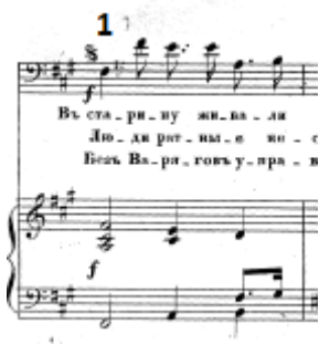
Figure 47 : Le Tombeau. L'aria de l'Inconnu, « Autrefois vivaient nos aïeux » ; acte I, numéro musical 3, fa dièse mineur. Partition p. 21.

L'aria comporte aussi des sauts de quinte et d'autres sauts d'octave.