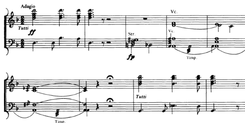
Figure 10 : Verstovskij, Pan Tvardovskij. Overture in Abraham, The Operas of Alexei Verstovsky p. 329

Les accords en tutti double ff en mode mineur dans les deux premières mesures précèdent l'accord de divisi des violoncelles. Pour Gérald Abraham 349 , ce quatuor pour violoncelles de divisi du début de l'ouverture viendrait de l' Ariodant de Méhul.