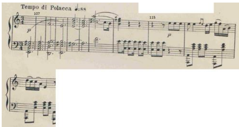
Figure 22 : Extrait de l'Ouverture. Mesures 106 à 117. Édition 1877, p. 6

Le rythme de la polonaise en 3/4 avec une introduction majestueuse de sept mesures composées d'accords en blanches pointées s'entend dans ce faux développement très court de 22 mesures, en la mineur. Dans le registre aigue se développe la mélodie simple dans la nuance piano . L'accompagnement est dans les basses du registre orchestral. Dans ces sept premières mesures, nous avons une musique savante, dans l'esprit d'une polonaise élégiaque 361 , rappelant celles d'Oginski ou d'Osip Kozlovski 362 . Elles introduisent la mélodie (très certainement au violon) qui, elle, reste une mélodie simple d'une romance russisée. Dans tous ses opéras Verstovskij introduit librement les rythmes de la mazurka ou de la