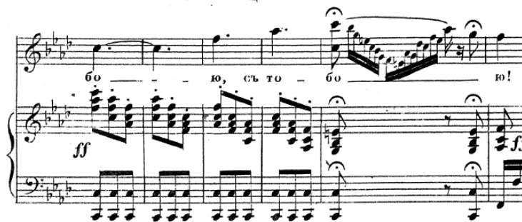
Figure 43 : Le Tombeau. La fin de l'aria de Nadežda ; numéro musical 18 ; fa mineur ; 3/8. Partition p. 149.

Dans le final de l' aria , la mise en musique du vers « [séparée de ] toi », avec le point d'orgue sur le degré V avec un contre ut puis une cadence notée 446 , est plus dramatique.