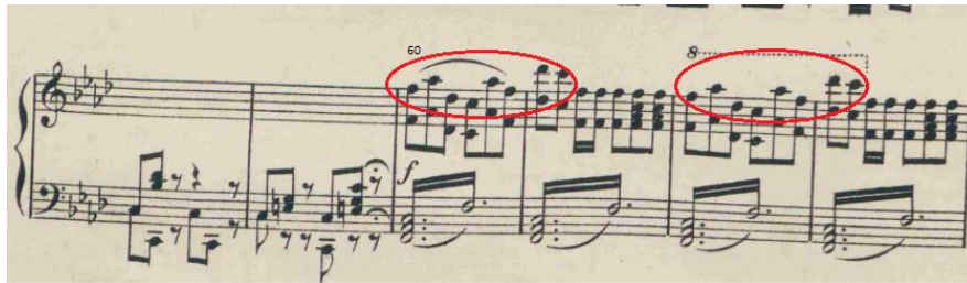
Figure 12 : Le Tombeau. Ouverture. Mesures 60 à 63 ; fa mineur. Partition 1877, p. 4

Le thème commence à la mesure 60. Une courte introduction le précède : sur une pédale de la dominante do , il y a un ostinato rythmique caractéristique d'une polonaise évoquant de nouveau pour les auditeurs, la russité. Le thème est transposé en fa mineur et il est placé dans le registre aigu. La nuance forte et les trémolos dans le registre grave de l'orchestre expriment la colère