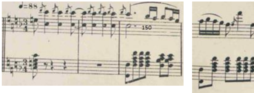
Figure 24 : Le Tombeau. Extrait de l'Ouverture. Mesures 148 à 151 ; fa majeur, 3/4 ; p. 7

Le thème de Torop commence à la mesure 150 après deux mesures d'introduction. Il est dans le registre aigu. L'accompagnement est dans les basses du registre orchestral au rythme d'une polonaise. La russité est peut-être discutable, mais il y a la présence d'un skomorokh et le rythme de la polonaise.