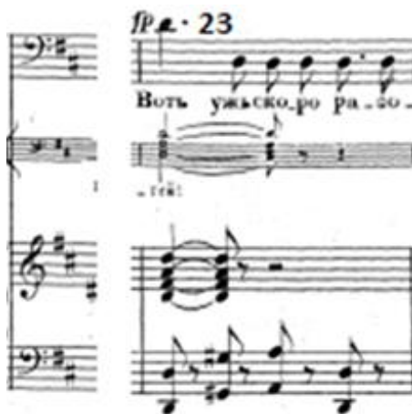
Figure 48 : Le Tombeau. Première partie de l'aria de l'Inconnu dans les ruines ; mesures 23 à 33 ; si mineur, moderato, 4/4. Partition p. 92.

La virtuosité est largement utilisée par Verstovskij dans cette aria. Elle permet d'exprimer avec lyrisme des élans passionnés et des sentiments exaltés.