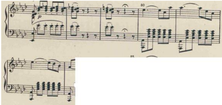
Figure 17 : Le Tombeau. Extrait de l'Ouverture. Mesures 77 à 84 ; la b majeur, 6/8. Partition éditions 1877, p. 5

Le thème B commence à la mesure 80 après le point d'orgue ; Verstovskij dans les mesures précédentes a dû moduler pour passer du fa mineur à un mode majeur ( la b majeur) nécessaire pour apporter le sentiment de liesse. Sur une basse simple (I-V), rythmée par des croches ou des doubles croches, nous reconnaissons, dans le registre aigue la mélodie joyeuse de Torop.