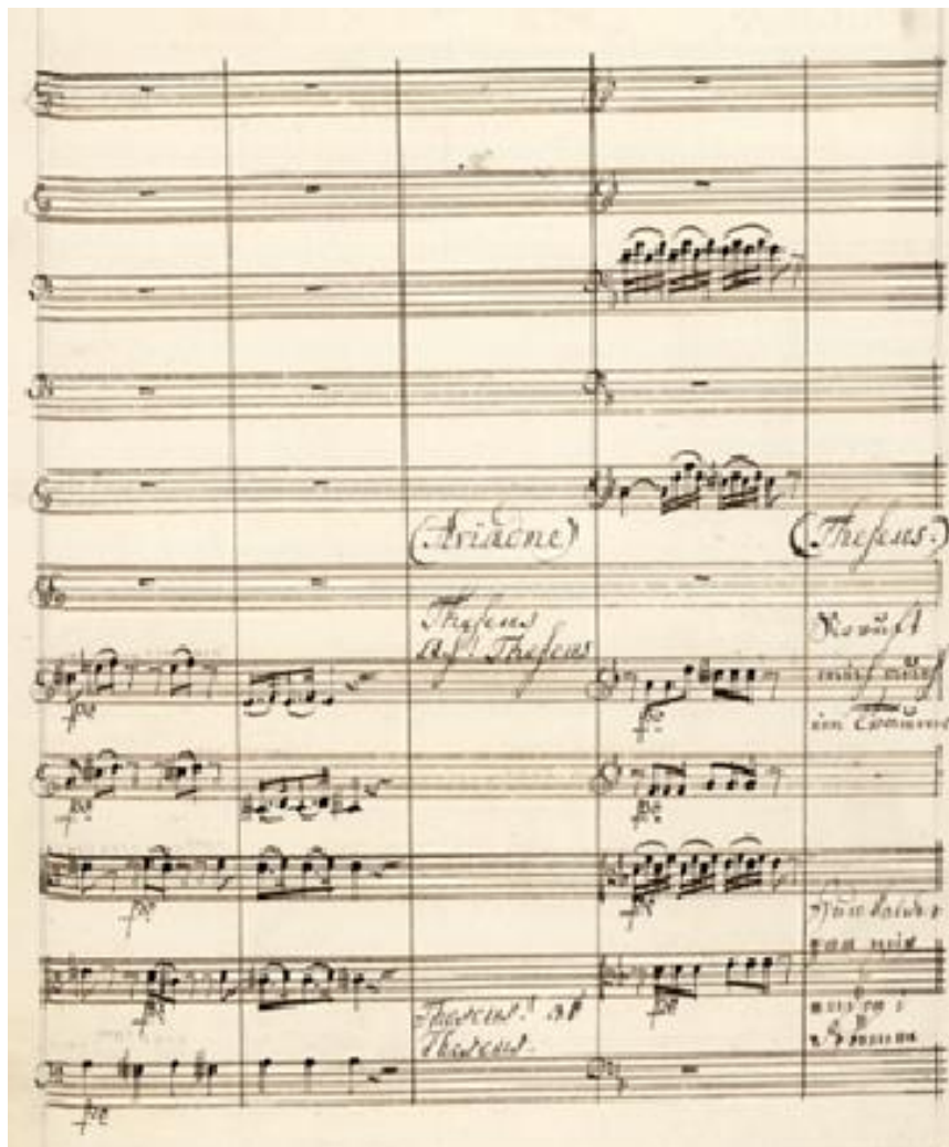
Figure 63 : Extrait d' Ariadne auf Naxos (Benda/Brandes). (1775), p.30 ; in Benda, Georg, LorB 476, numéro de I-Catalogue IGB 2

L'œuvre a été jouée pour la première fois à Saint-Petersbourg en 1779. Il y a alternance entre la phrase parlée et la phrase musicale. Dans Médeia , créée aussi à Gotha en 1778, Benda choisit soit d'alterner, soit de superposer texte et musique. Le mélodrame est sur la scène russe dès 1781. La diffusion des œuvres de Benda a été rapide, d'autant qu'avant la création, les partitions ont pu circuler ; preuve de nouveau de l'influence allemande en Russie.