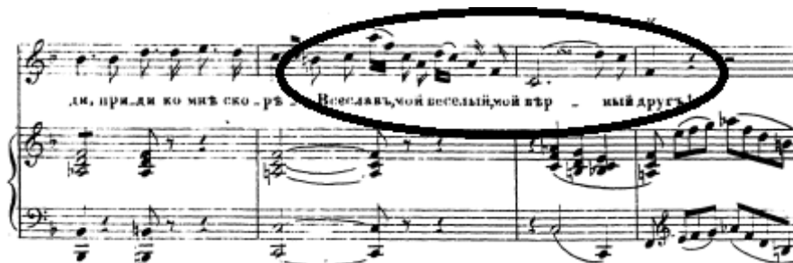
Figure 42 : Le Tombeau. Extrait la chanson de Nadežda. Numéro musical 1, acte I. « Vselav, mon tendre, mon cher ami ! », fa majeur, 4/4. Partition p. 15.

La virtuosité est plus marquée dans le second air de Nadežda 445 , « Le soleil éclatant brille, brille ». Nous avons déjà souligné les sauts d'octaves ascendants ou descendants. Notons aussi la présence d'un mélisme à la fin de l' aria .