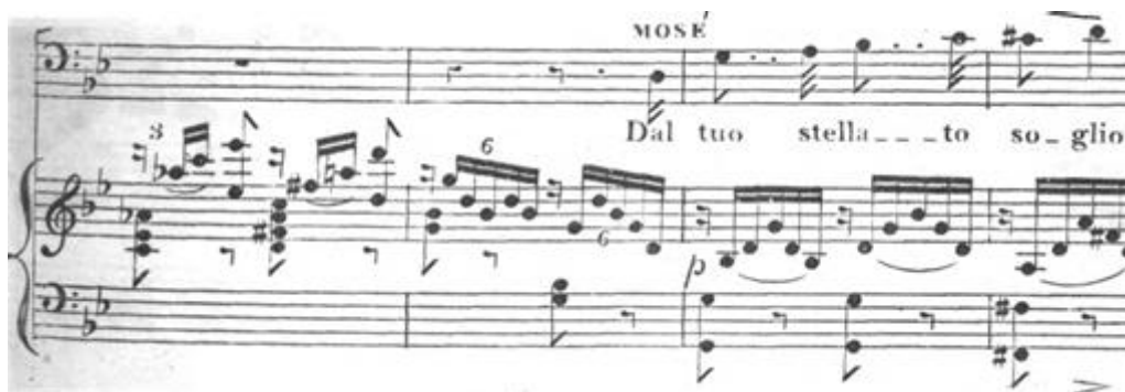
Figure 50 : Rossini, Moïse en Égypte , « Dal tuo stellato soglio », sol mineur, 2/4. Édition Royal Harmonic Institution, Plate 1066.

La présence d'un chœur, soutenant le soliste, pourrait avoir inspiré Verstovskij pour l'aria de l'Inconnu « Autrefois vivaient nos aïeux » dans le premier acte.