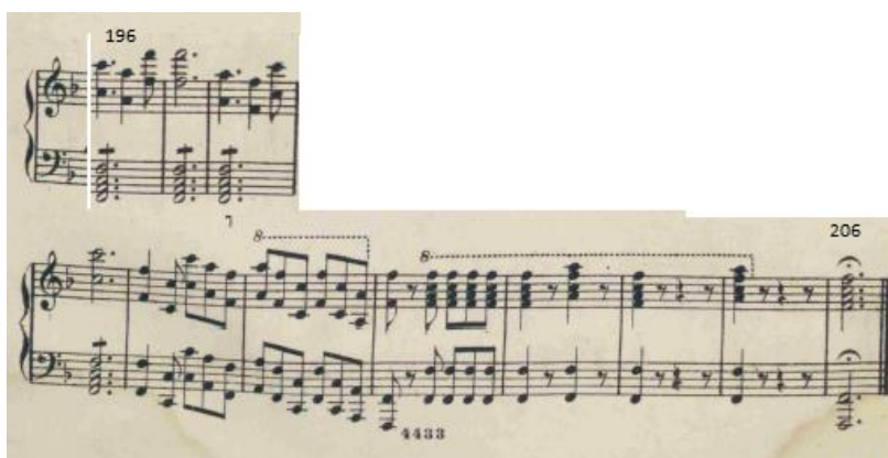
Figure 15 : Le Tombeau . Extrait de la coda de l'Ouverture. Mesures 196 à 206. Édition 1877. Partition p. 8.

L'opéra se termine dans une longue cadence parfaite en fa majeur. Il y a peut-être l'influence du finale du Freischütz , dans lequel les motifs des puissances démoniaques se font encore entendre et le motif d'Agathe mène dans un crescendo à la fin heureuse.