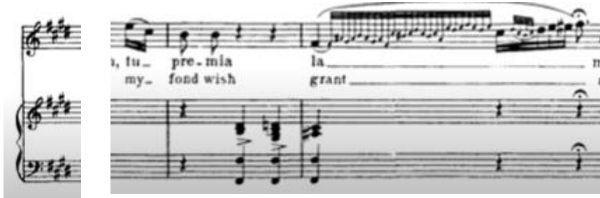
Figure 45 : Rossini, La Pie Voleuse . Un mélisme. Deuxième extrait de la cavatine de Ninetta (acte I) « Di piacer mi balza il cor », mi majeur , 3/4. Éditions Ricordi.

Pourtant, ces deux extraits semblent très proches de ce qu'il a composé pour les deux airs de Nadežda (cf. supra les numéros 1 et 18 ; fig. 42 et fig. 43).