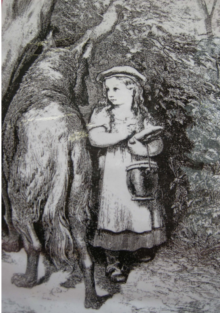
Illustration de Gustave Doré pour le recueil Contes de Charles Perrault