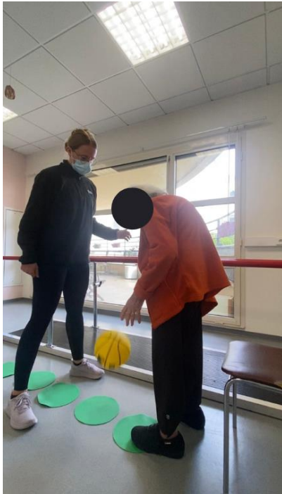
Fig.1 Étape 2