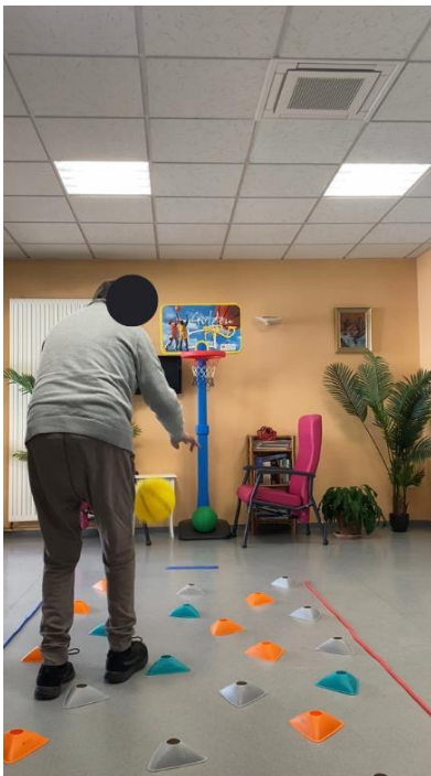
Fig.2 Étape 3

Pour évaluer l'impact de la double tâche induite par le programme de basket santé sur l'équilibre des personnes âgées, plusieurs évaluations ont été mises en place. Parmi celles-ci, le test de Tinetti et le Timed Up and Go (TUG) ont été choisis pour leur fiabilité et leur validité dans la mesure de l'équilibre et de la mobilité chez les personnes âgées.