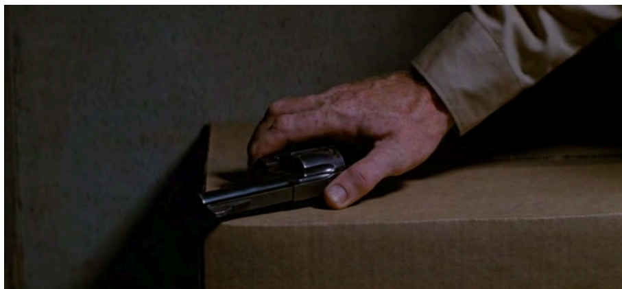
Fig. 32 : The Thing , 57 min 58 s.

l'intérieur armé de son pistolet iconique. Ironiquement, en agissant selon un lieu commun du western, Garry ne fait pas preuve de bravoure contrairement au shérif tel Will Kane dans High Noon ( Le train sifflera trois fois , Fred Zinnemann, 1952) par exemple, qui est justement le seul à s'exposer face aux bandits alors que les habitants se confinent. Obéissant aux directives du pilote depuis le début de la crise, Garry déclare, alors qu'il est soupçonné d'être une chose : « je suppose que vous vous sentiriez mieux si quelqu'un d'autre prenait le commandement 131 » et renonce symboliquement à son arme dans un gros plan qui souligne la solennité et l'importance de cet abandon d'un signe de pouvoir [Fig. 32]. Dans la même scène quelques secondes plus tard, c'est MacReady qui récupère les armes et se place à présent comme chef, légitimé par ses décisions précédentes de brûler la chose et d'enfermer Blair devenu dangereux.