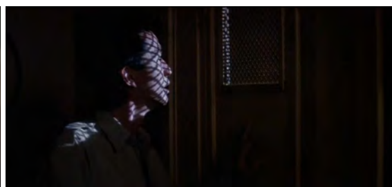
Fig. 21 : Prince of Darkness , 1 h 12 min 59 s.