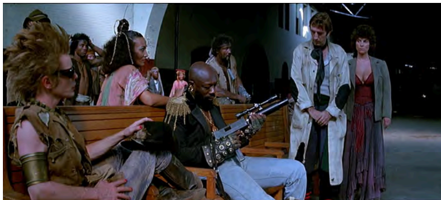
Fig. 30 : Escape from New York , 1 h 05 min 26 s.

À New York, comme dans les autres films, chaque personne a aussi un rôle social : le Duc est évidemment le souverain, ayant un titre de noblesse, Maggie est une courtisane et Brain un sbire inventeur comme son surnom le suggère. Nous avons évoqué l'intérêt des identités visuelles, et ces trois personnages sont intéressants car chacun est vêtu de manière à correspondre à ce rôle social : le Duc porte des épaulettes dorées qui renvoient à de prestigieuses fonctions militaires, Maggie porte une robe décolletée à la couleur chaude, et Brain une blouse blanche de scientifique [Fig. 30]. Même Cabbie, personnage isolé qui est l'un des premiers à aider Snake, porte une casquette de chauffeur et un surnom qui renvoie à sa fonction.