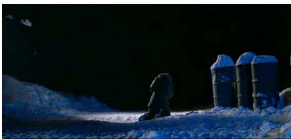
Fig. 15 : The Thing , 45 min 42 s.

Attardons-nous à présent sur deux plans larges assez particuliers des deux films, et qui peuvent être rapprochés par leur composition et ce qu'ils transmettent. Ces deux plans, sur les figures 15 et 16, représentent des personnages qui sont techniquement morts. Assimilés par la chose ou contaminés par le liquide vert, leur corps ne leur appartient plus et est devenu un véhicule. Ce qui nous intéresse ici est la manière dont ces corps sont représentés : en plan large, seuls au milieu de l'image, entourés non par un décor envahissant mais par une obscurité qui occupe la majorité de l'image. Ces personnages sont au pinacle de leur solitude. Morts, mis à l'écart, ils amènent avec eux une obscurité qui symbolise l'isolement total qui s'abat sur les autres personnages. Cette obscurité dans The Thing semble d'ailleurs former un véritable mur qui se dresse devant le halo des lampes, et elle paraît d'autant plus étrange dans Prince of Darkness : l'action se situant au beau milieu d'une ville, les rues derrière le personnage décédé sont censées être illuminées, ou un minimum visibles.