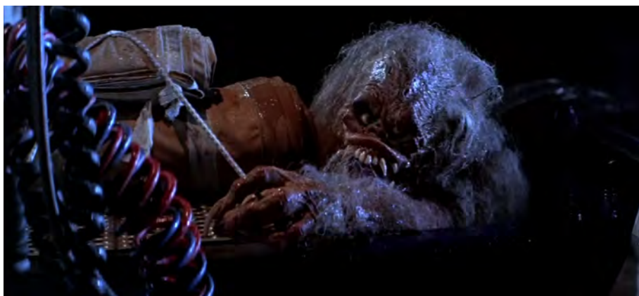
Fig. 41 : Big Trouble in Little China , 1 h 36 min 08 s.

Big Trouble se termine au premier abord de façon positive, l'antagoniste vaincu et Miao Yin libérée. Cependant, Jack Burton part seul de son côté et est suivi par une créature rescapée qui se cache dans son camion, nuançant donc cette première fin rassurante. La créature nous est montrée de manière particulière : Jack parle dans sa radio et la caméra le délaisse pour effectuer un travelling vers l'arrière du camion. D'une trappe, sort alors un grognement qui recouvre la voix de Jack, puis un monstre brièvement illuminé par un éclair [Fig. 41]. Cette atmosphère diluvienne a des allures d'apocalypse, là-encore, et rappelle le début du film où Jack conduit également sous la pluie et parle dans sa radio. Cette séquence finale sous-entend donc que, malgré la victoire, rien n'a changé et tout est même pire puisque le monstre s'est échappé.