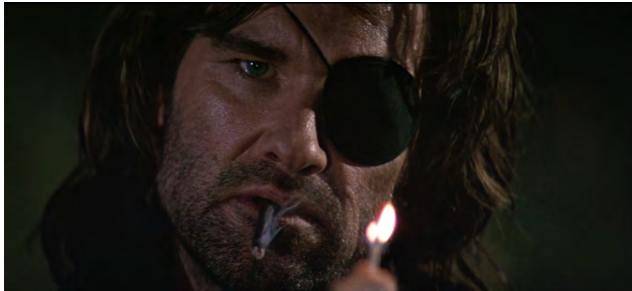
Fig. 44 : Escape from L.A. , 1 h 36 min 25 s.

En effet, la fin du capitalisme n'est pas la fin du monde. Ce film fait office d'exception pour notre propos car il montre un bref aperçu de ce qui se passe après la fin de la société et du monde capitaliste. Cela laisse penser que ce film, sorti à la fin des années 1990 192 , possède un regain d'optimisme par rapport à ses prédécesseurs, sortis tout au long des années 1980 en pleine explosion du néolibéralisme, et cela appuie ces propos de Carpenter, régulièrement cités : « Je suppose donc que je suis pessimiste à court terme et optimiste à long terme 193 . » Dans cet entretien, le cinéaste cite en particulier Ghosts of Mars (2001), sorti quelques années après Escape from L.A. et qui semble confirmer ce sentiment d'optimisme et d'espoir à long terme. Mais comme le dit également le réalisateur dans un entretien plus ancien, « [l]a crainte de perdre son mode de vie est universellement partagée 194 ». Cette crainte semble d'ailleurs insurmontable si l'on se concentre uniquement sur les films de la décennie 1980, ceux-ci ne montrant en effet que la destruction sans laisser penser qu'il soit possible de construire quelque chose après.