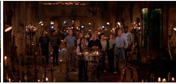
Fig. 14 : Prince of Darkness , 29 min 57 s.

Attardons-nous à présent sur deux plans larges assez particuliers des deux films, et qui peuvent être rapprochés par leur composition et ce qu'ils transmettent. Ces deux plans, sur les figures 15 et 16, représentent des personnages qui sont techniquement morts. Assimilés par la chose ou contaminés par le liquide vert, leur corps ne leur appartient plus et est devenu un véhicule. Ce qui nous intéresse ici est la manière dont ces corps sont représentés : en plan large, seuls au milieu de l'image, entourés non par un décor envahissant mais par une obscurité qui occupe la majorité de l'image. Ces personnages sont au pinacle de leur solitude. Morts, mis à l'écart, ils amènent avec eux une obscurité qui symbolise l'isolement total qui s'abat sur les autres personnages. Cette obscurité dans The Thing semble d'ailleurs former un véritable mur qui se dresse devant le halo des lampes, et elle paraît d'autant plus étrange dans Prince of Darkness : l'action se situant au beau milieu d'une ville, les rues derrière le personnage décédé sont censées être illuminées, ou un minimum visibles.