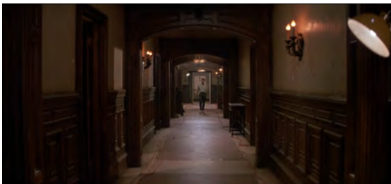
Fig. 17 : Prince of Darkness , 44 min 15 s.

place que les personnages [Fig. 18]. Remarquons que dans ce deuxième plan, si les personnages ne sont effectivement pas seuls, aucun d'entre eux ne se trouve côte à côte, ils sont dispersés dans la profondeur de champs et séparés physiquement par les éléments du décor (des caisses) et l'architecture de la station (coins de murs et portes). Ils ne sont pas rassemblés mais isolés dans le cadre, contrairement au plan représenté sur la figure 13. De plus, un effet de surcadrage est créé par deux pans de murs de chaque côté, qui obstruent une partie de notre vision et rétrécit encore l'espace dont les membres du groupe disposent. Dans les deux films, les murs et la profondeur de champ servent à rétrécir l'image, pour opprimer davantage les personnages lorsqu'ils sont seuls. De même, dans les deux plans, la ligne de fuite entraîne le regard vers le fond, où pourrait se trouver une sortie potentielle, la fin du couloir, mais il n'y a à chaque fois qu'une porte qui ouvre sur un mur. Là encore, la fuite est impossible.