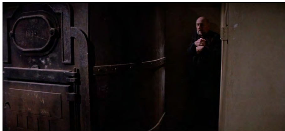
Fig. 31 : Prince of Darkness , 1 h 12 min 14 s.

Walter est isolé lui aussi, mais il peut communiquer avec les autres, et le mur qui le sépare de ses camarades est friable. Coincé dans un placard, il cherche cependant à en sortir pour se reconnecter au groupe. Contrairement au prêtre, qui est aveugle et muet pendant toute la