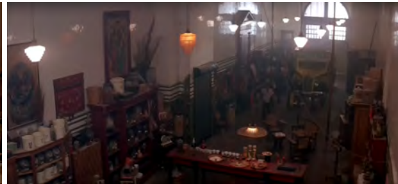
Fig. 37 : Big Trouble in Little China , 1 h 04 min 42 s.

Dans ces films, deux rapports différents se jouent donc : il y a d'un côté une dualité complémentaire entre entité et menace, et de l'autre une opposition entre le néolibéralisme (et ceux qui perpétuent cette idéologie) et ceux qui tentent vainement d'y résister. Dans tous les cas, la menace est de nature destructrice, et les personnages peinent à la comprendre, en raison de sa nature abstraite.