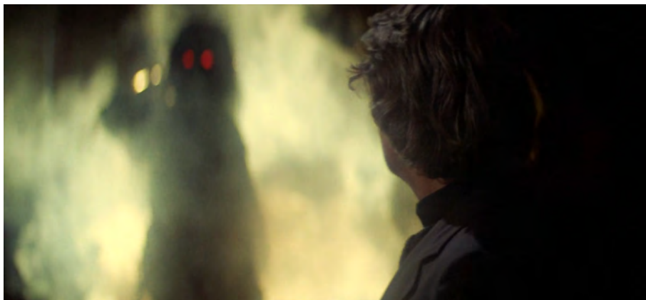
Fig. 42 : The Fog , 1 h 26 min 48 s.

De la même manière, The Fog se conclut d'abord sur le jour qui se lève après une nuit de massacre, les membres du groupe tous rescapés, avant de se terminer sur l'assassinat du père Malone, amenant là aussi une nuance à la première fin. Le jour s'est levé, le groupe est reparti sain et sauf excepté le prêtre, qui reste dans l'obscurité de l'église et a à peine le temps de se rendre compte qu'il va mourir [Fig. 42]. La fin ici agit comme un avertissement : les crimes coloniaux du passé ne seront ni oubliés ni pardonnés, ils sont présents en arrière-plan (ici, ils prennent la forme d'une silhouette sombre aux yeux rougeoyants, se détachant dans un flou lumineux qui efface totalement tout décor religieux) et il est même possible que les revenants se montrent à nouveau un jour pour détruire entièrement la micro-société. On sent donc encore une fois l'imminence de la fin du monde.