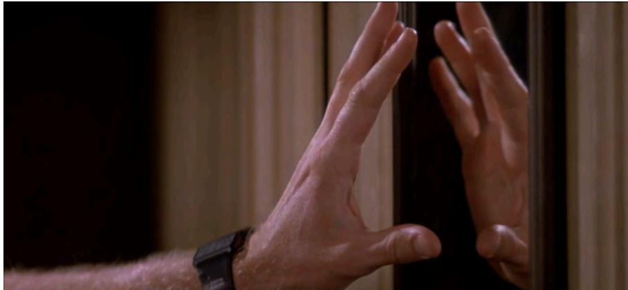
Fig. 40 : Prince of Darkness , 1 h 38 min 42 s.

n'y avait rien derrière ? Et surtout, qu'y a-t-il derrière si ce n'est l'imminence de la fin du monde, comme montrée dans les rêves ?