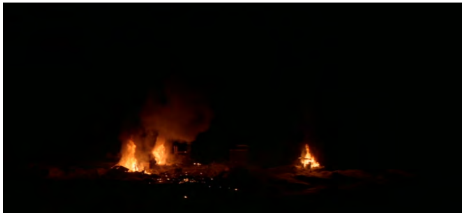
Fig. 39 : The Thing , 1 h 37 min 50 s.

Pour mettre en évidence la solitude et la désillusion sociale, il faut ainsi s'intéresser à la fin des films et à leurs plans de clôture, afin de se demander ce que l'on peut en déduire à la lumière du récit qui les précède. Cette fin peut être généralement qualifiée de pessimiste. D'abord, The Thing et Prince of Darkness font partie avec In the Mouth of Madness de ce qui a été qualifié après leur sortie de « Trilogie de l'Apocalypse 189 ». Ces trois films sont rassemblés sous cette appellation en raison de leurs thèmes et de leur esthétique (des monstres informes inspirés de Lovecraft, l'isolement, la dégradation des relations humaines...) ainsi que de leurs fins sombres dépeignant l'imminence de la fin du monde. De fait, The Thing ne se ferme pas sur les visages des deux survivants, potentiellement infectés, mais sur la station qui brûle. Ce feu, en plus de symboliser la destruction de la communauté qui y vivait, dit également que la chose va survivre, protégée de la congélation jusqu'à l'arrivée d'autres humains. Ce plan de feu perçant la nuit noire n'est donc pas signe d'espoir mais le sombre présage de la fin du monde connu [Fig. 39].