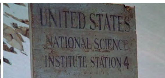
Fig. 3 : The Thing , 4 min 24 s.