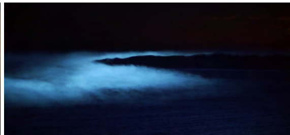
Fig 35 : The Fog , 56 min 24 s.

Ajoutons que l'entité est également un élément inhumain, dans le sens de « non-humain ». Cependant, si la menace est effectivement par nature un élément dépourvu de toute humanité, n'existant que sous la forme de concept, elle n'est pas uniquement incarnée par des entités matérielles individualisées. Par exemple, si le liquide vert de Prince of Darkness , le brouillard de The Fog et la chose de The Thing sont bien des matières informes mais identifiables, qui ne sont pas de nature humaine, on ne trouve pas de tels équivalents dans les deux autres films étudiés. Dans Escape from New York et Big Trouble , la menace est paradoxalement plus concrète car de nature sociale – l'institution policière toute