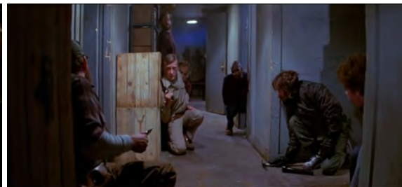
Fig. 18 : The Thing , 50 min 25 s.

Enfin, les gros plans sur les visages des personnages représentent ceux-ci complètement enfermés. Ils sont seuls dans l'image et il n'y a plus aucune illusion d'échappatoire visible à l'écran. Pas de porte même fermée, pas de coin de mur, pas de couloir. Dans The Thing , même la cohésion du groupe est ébranlée, isolant les personnages psychologiquement les uns des autres. Dans la scène du test sanguin, qui commence à 1 heure et 16 minutes, le groupe est réuni dans la salle commune, mais cette scène comporte assez peu de plans de groupe montrant les personnages ensemble dans le cadre. Ils sont méfiants, ne se font pas confiance et la mise en scène fragmentée révèle leur isolement : chacun ne peut compter que sur lui-même. C'est cependant sur un autre type de gros plan que nous voudrions nous concentrer, visible également dans Prince of Darkness . Nous les appelons les gros plans d'enfermement, et ils possèdent une symbolique visuelle forte. Compilés sur les figures 19, 20 et 21, ils montrent des personnages seuls [Fig. 20 et 21] ou séparés d'un autre personnage par une barrière physique [Fig. 19]. Le décor est encore une fois un élément majeur de l'enfermement : le visage de MacReady se détache dans une petite ouverture semblable à un judas de porte de prison, alors que la pièce qui