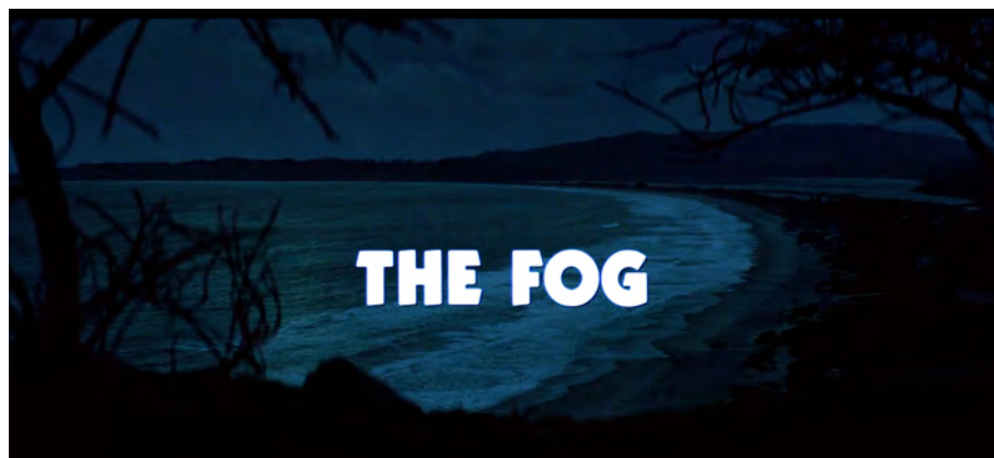
Fig. 7 : The Fog , 4 min 18 s.

sur l'espace où le brouillard apparaîtra bien plus tard dans un plan similaire 36 . » La mer rencontre donc symboliquement le brouillard via le titre, et ainsi les deux frontières porteuses du danger se réunissent à l'écran pour la première fois [Fig. 7].