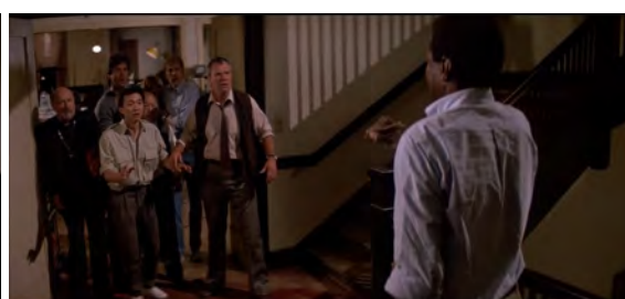
Fig. 26 : Prince of Darkness , 1 h 07 min