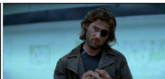
Fig. 23 : Escape from New York , 20 min 35 s.