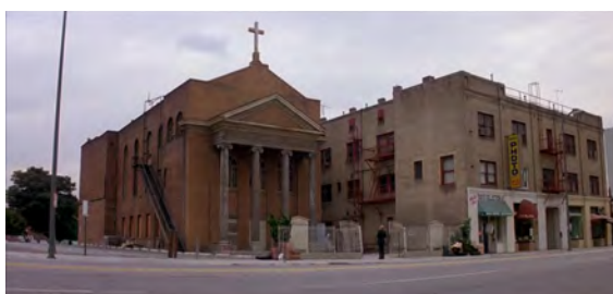
Fig. 5 : Prince of Darkness , 5 min 45 s.

Dans Big Trouble , le processus de transformation du lieu est un peu différent et peut être rapproché en partie de la prison d' Escape from New York . En effet, Jack Burton, Wang Chi et leurs camarades font intrusion dans un lieu qui leur est hostile. Ils s'infiltrèrent en effet dans un entrepôt qui appartient à leur ennemi, et qui se révèle donc être un lieu-piège en soi, déjà transformé à leurs yeux par la magie maléfique et les sombres desseins de Lo Pan. Ils traversent littéralement des « Enfers » inspirés des diyù 33 de la mythologie chinoise, suggérant que cet entrepôt ouvre sur des dimensions parallèles, ou que sa structure surnaturelle n'obéit pas aux lois de la logique humaine. Avant l'intrusion finale, cet étrange dialogue se tient entre le sorcier Egg Shen et Jack qui demande pourquoi ils doivent descendre dans les égouts de la ville :