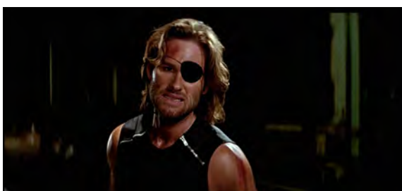
Fig. 22 : Escape from New York , 1 h 26 min 05 s.

solitaire 89 qui réalise l'importance de la solidarité, surtout parmi les personnes marginalisées. Pragmatique et endurci, il se montre pourtant soucieux et presque en détresse après la mort du scientifique Brain, tandis que sa compagne Maggie est sous le choc. Pour souligner ce moment dramatique, il est éclairé d'une lumière blanche et pure qui l'isole de l'obscurité ambiante [Fig. 22]. Cet éclairage particulier diffère de la lumière rouge et de la pénombre qui entourent quasiment systématiquement le personnage, car il permet de voir clairement son visage, et donc ses émotions, alors qu'il ne se souciait que de lui-même pendant la majorité du film. De plus, il est intéressant de souligner que la lumière industrielle de la base militaire chargée de surveiller la prison, où Snake est briefé et récupère son matériel, n'est pas complètement blanche, mais tire plutôt vers le bleu et le vert, rappelant un hôpital ou un laboratoire [Fig. 23]. Le personnage, dans sa veste usée, y fait d'ailleurs tâche, soulignant sa condition de marginal en ces lieux malgré son passé militaire.