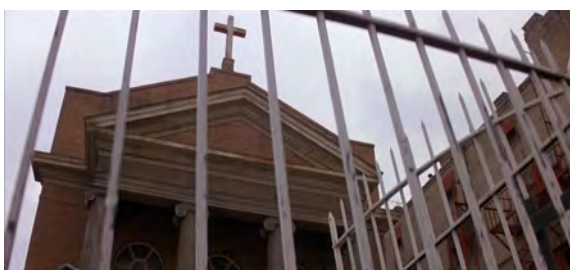
Fig. 4 : Prince of Darkness , 6 min 08 s.

lieu menaçant : elle est abandonnée, et renferme une substance inconnue dans son sous-sol. Elle est également présentée comme un monstre de briques rouges. Quand elle est filmée de près, le fronton est cadré en contre-plongée, surplombant les personnages [Fig. 4]. Ajoutons que dans ce plan spécifique, elle est même montrée enfermée derrière des barreaux, ce qui préfigure le sort des personnages. Quand elle est filmée de loin, il y a toujours un ou plusieurs personnages présents devant elle [Fig. 5], ce qui accentue la différence de taille et renforce la monstruosité de la bâtisse dont la couleur rouge se détache au milieu du paysage urbain de la ville de Los Angeles, lieu de tournage du film. Comme la station scientifique de The Thing , l'église est un endroit dont la fonction première d'abri, de lieu de vie et de recueillement est détournée, et qui devient alors périlleux. L'église se transforme donc en piège, et n'apporte pas de protection mais du danger, tel le Prince des ténèbres qui y dort.