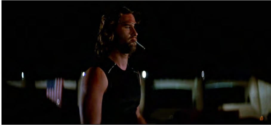
Fig. 43 : Escape from New York , 1 h 34 min 29 s.