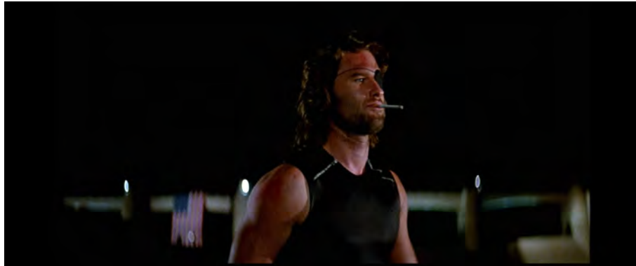
Fig. 24 : Escape from New York , 1 h 34 min 31 s.

fin. Snake s'efface une fois de plus dans la pénombre, la lumière blanche héroïque avalée par une obscurité anti-héroïque [Fig. 24].