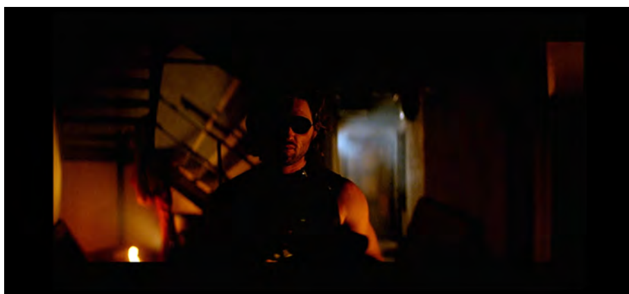
Fig. 1 : Escape from New York , 34 min 48 s.

dressées, et les silhouettes invisibles vivant dans les égouts peuvent jaillir de nulle part pour l'attaquer. Le film est à la frontière d'un style visuel post-apocalyptique, dans un univers dans lequel l'apocalypse serait encore en cours. La ville est détruite, quasiment abandonnée et « les prisonniers sont filmés davantage comme des ombres opaques et zombifiées que comme des corps humains à l'individualité clairement définie 31 . » Cela inscrit en partie Escape from New York dans une ambiance horrifique, car les habitants dépourvus de visage – dans la nuit on ne voit pas leurs traits – et d'humanité sont assimilables à des monstres, des zombies voire des rats, si l'on se réfère au moment où ils sortent littéralement du sol pour tenter d'attirer Snake dans les égouts.