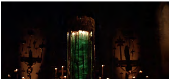
Fig. 34 : Prince of Darkness , 14 min 06 s.