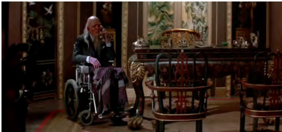
Fig. 36 : Big Trouble in Little China , 49 min 36 s.

esthétique entre le repaire de Lo Pan et celui d'Egg Shen est, à ce titre, saisissant : les appartements du premier sont de luxueux décors sans fenêtres témoignant de son immense richesse personnelle [Fig. 36], là où le second révèle un petit entrepôt sombre illuminé par une lumière naturelle et recelant des trésors à l'apparence plus modeste [Fig. 37].