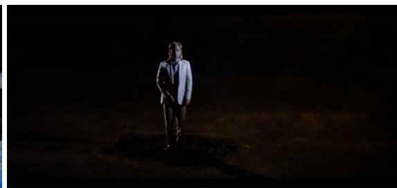
Fig. 16 : Prince of Darkness , 1 h 05 min 52 s.

On trouve également beaucoup de plans en intérieur isolant les personnages dans un décor fermé. Par exemple, dans Prince of Darkness , le couloir principal de l'église est un décor récurrent, et l'on voit rarement les portes qui s'ouvrent sur ses côtés. Le couloir agit donc comme piège visuel, ses murs occupant les deux tiers de l'image [Fig. 17]. Dans The Thing également il y a beaucoup de ces « plans de couloir » où les murs semblent prendre plus de