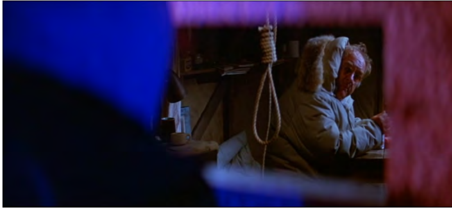
Fig. 27 : The Thing , 1 h 04 min 48s.