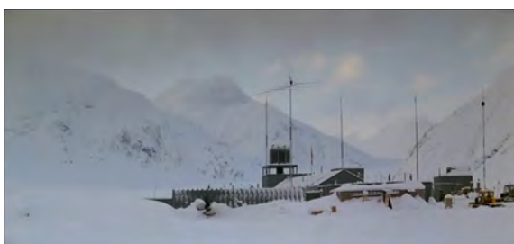
Fig. 2 : The Thing , 4 min 41 s.

poursuivant la chose déguisée en chien, ce qui est encore une action et un plan classiques du western.