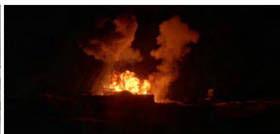
Fig. 12 : The Thing , 1 h 34 min 44 s.