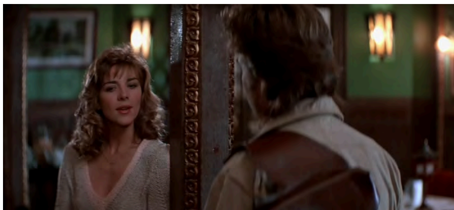
Fig. 38 : Big Trouble in Little China , 1 h 34 min 24 s.