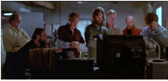
Fig. 13 : The Thing , 34 min 43 s.