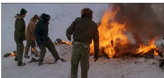
Fig. 11 : The Thing , 9 min 17 s.

manifeste de manière plus diffuse à travers l'espace narratif. La station est militarisée, mais de manière particulièrement discrète : revolver, lance-flamme, fusils et dynamite sont certaines des armes qu'on y trouve, mais elles apparaissent petit à petit, à mesure que la situation se dégrade pour les personnages. L'inefficacité de l'institution militaire est précisément matérialisée par ces armes, accessoires inhérents au lieu : elles sont puissantes et provoquent de gros dégâts, mais ce n'est qu'une illusion car malgré tous les feux déclenchés et leur intensité grandissante, le danger est toujours aussi oppressant. Ainsi, le tout premier feu du film représenté sur la figure 11 par un plan moyen, est provoqué à la lumière du jour, à hauteur d'homme et facilement maîtrisable. Le dernier feu, sur la figure 12, est montré cette fois de nuit, par un plan d'ensemble, envahissant la station et la faisant exploser. Cependant cette escalade de la destruction n'a finalement rien changé, puisqu'on ne sait pas si l'apocalypse a été évitée. Ce feu dont la puissance destructrice atteint son apogée à la fin du film est donc une représentation d'une institution qui se détruit de l'intérieur et n'a pas de pouvoir protecteur.