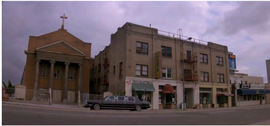
Fig. 8 : Prince of Darkness , 11 min 24 s.