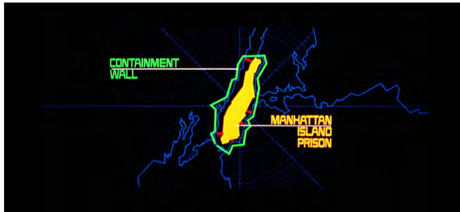
Fig. 6 : Escape from New York , 03 min 36 s.