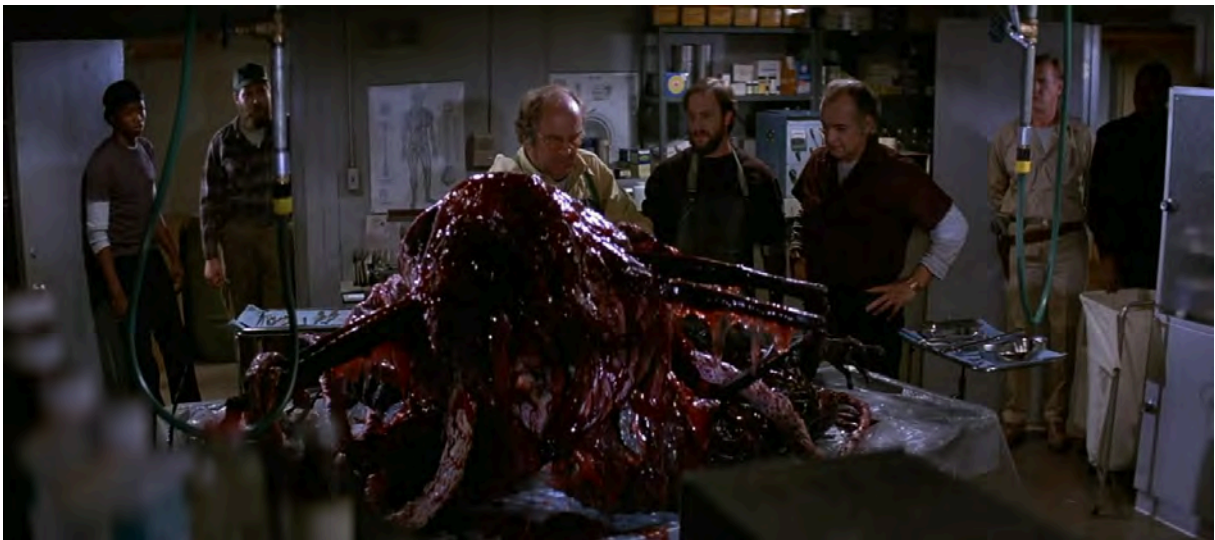
The Thing (John Carpenter, 1982)

The Fog (1980), Escape from New York (1981), The Thing (1982), Big Trouble in Little China (1986), Prince of Darkness (1987)