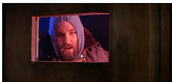
Fig. 19 : The Thing , 1 h 04 min 45 s.

lui fait face est censée être une simple réserve. Comme pour les autres valeurs de plans évoquées précédemment, le décor occupe la majorité de l'espace, et semble découper le corps du personnage en plus de le séparer physiquement de celui qui lui fait face, de l'autre côté de la porte. Les deux autres plans présentent aussi une barrière physique, mais celle-ci n'est pas visible. Les personnages font face à une grille dont l'ombre se projette sur leur visage. Les barreaux de leur prison s'impriment visuellement sur leur peau, et le gros plan, en plus de fragmenter leur corps comme sur la figure 19, fragmente aussi leur visage. Ceci représente un enfermement physique et psychologique : les deux sont piégés dans un lieu-piège, sont isolés de leurs compagnons, et vont faire face ou font déjà face à des événements traumatiques – respectivement l'arrivée de la chose et la transformation progressive de Kelly en fils de l'Anti-Dieu. Ces gros plans d'enfermement servent donc à souligner l'isolement physique des personnages dans un espace toujours plus hostile ainsi que leur solitude face aux événements qu'ils subissent, nous en parlerons plus en précision par la suite.