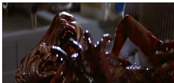
Fig. 33 : The Thing , 23 min 09 s.

en empathie, elle est même une « matière plastique et malsaine 142 » selon David Roche. Les effets visuels pratiques permettent de montrer les substances et les matières qui composent les entités, et prennent soin de radicalement les éloigner de toute apparence humaine. Ainsi, la chose est ce qui se rapproche le plus d'un corps humain, mais est composée de corps mutilés et déformés dont ne subsistent que des morceaux épars dénués d'humanité [Fig. 33]. De plus, le liquide vert et le brouillard ne sont que des matières certes existantes et visibles (liquide et gaz) mais sans apparence humanoïde [Fig. 34 et 35]. L'élément qui en fait des entités menaçantes est le mouvement (le liquide vert tourbillonne dans son tube, le brouillard avance contre le vent, la chose mute et assassine) et le fait qu'elles semblent poursuivre un but.