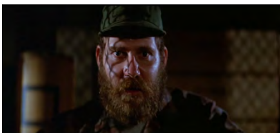
Fig. 20 : The Thing , 52 min 17 s.