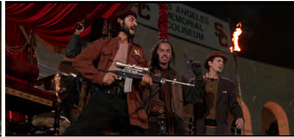
Fig. 28 : Escape from L.A. , 41 min 19 s.