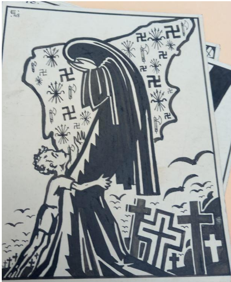
Carricature antifasciste représentant l'Espagne envahie par la croix gammée nazie

Des combattants de toutes les origines sociales ou culturelles se rencontrent. Des militants chevronnés qui ont déjà connus la clandestinité ou la prison dans leurs pays d'origine côtoient de très jeunes gens qui n'ont jamais tenu une arme. Pour certains, le passage dans les Brigades Internationales est donc aussi une forme d'apprentissage. Lorsque la résistance commence à s'organiser, les « anciens de la Guerre d'Espagne » sont recrutés grâce à leurs compétences de combattants et leur expérience de la guérilla urbaine : « Puisqu'il s'agit d'organiser des groupes de francs-tireurs et de les adapter, sans perdre de temps, aux méthodes de combat armé, il est évident que le mouvement juif progressiste de Paris s'adresse en premier lieu aux anciens volontaires juifs d'Espagne qui avaient déjà démontré pendant les années 1936-1939, aux futurs assassins de Juifs qu'ils savaient combattre 46 ».