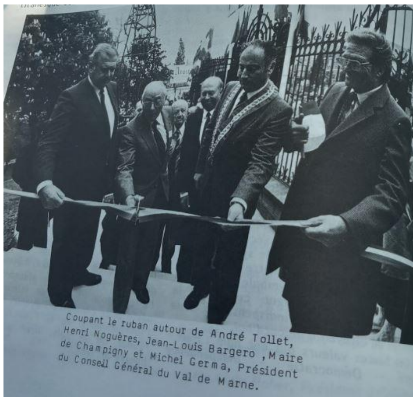
Cérémonie d'inauguration, Notre Musée , juin 1985