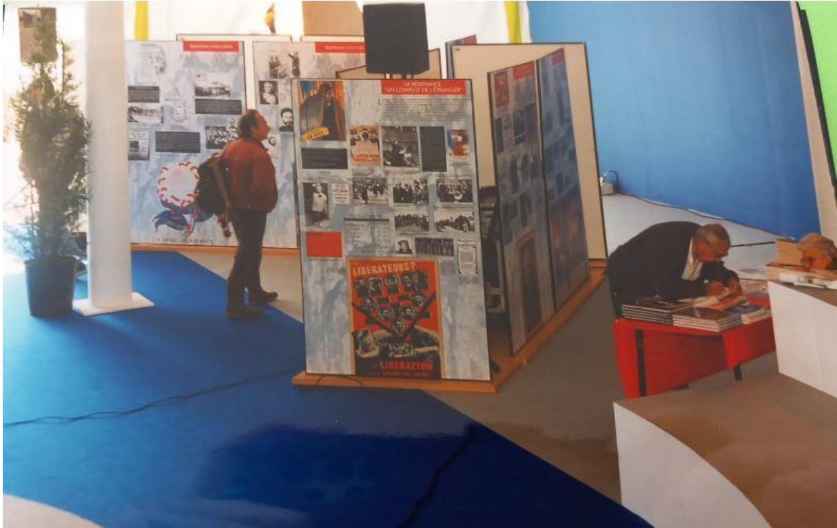
Exposition de 1997, fête de l'Humanité, "Votre chant qui chante sans frontières"

Les premiers panneaux reviennent tout d'abord sur les « traditions d'accueil ». L'auteur cite des portraits d'immigrés. Il montre comment suite à la Révolution française, des personnalités célèbres de par leur engagement politique ou leur travail artistique ont obtenu la nationalité française sur décision de l'Assemblée Nationale comme le premier Président des Etats-Unis Georges Washington ou l'écrivain allemand Friedrich von Schiller.