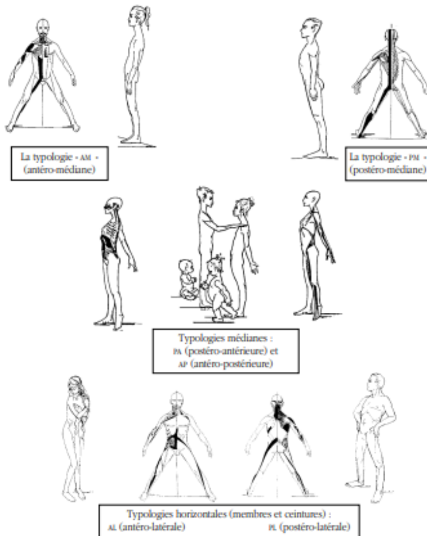
Annexe I : Les chaînes musculaires et articulaires selon la systématique de G. Struyf (Lesage, 2006)