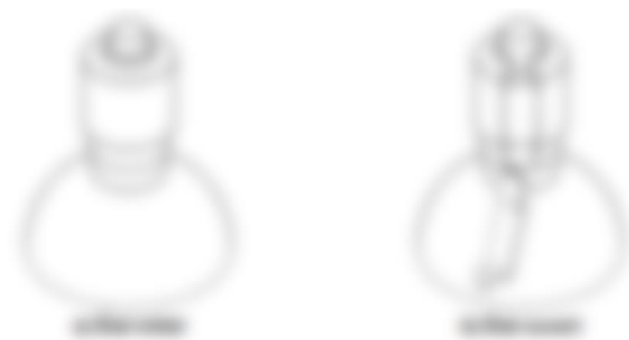
Figure 8: exemple de conditionnement primaire enveloppé d'un manchon (39)

Le manchon est une enveloppe rétractable qui entoure la fermeture du conditionnement primaire, s'adaptant ainsi à sa forme extérieure. La destruction de ce manchon constitue une preuve irréfutable et visible de toute tentative d'effraction (figure 8).