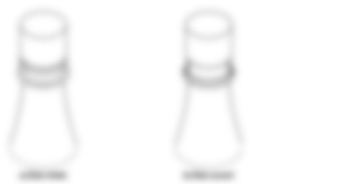
Figure 9: Exemple de fermeture cassable (39)

Les fermetures cassables ou déchirables sont conçues pour les formes liquides des conditionnements primaires, fabriquées en métal ou en plastique. Elles comprennent une partie spécifique qui se brise de manière visible lors de l'ouverture (figures 9 et 10).