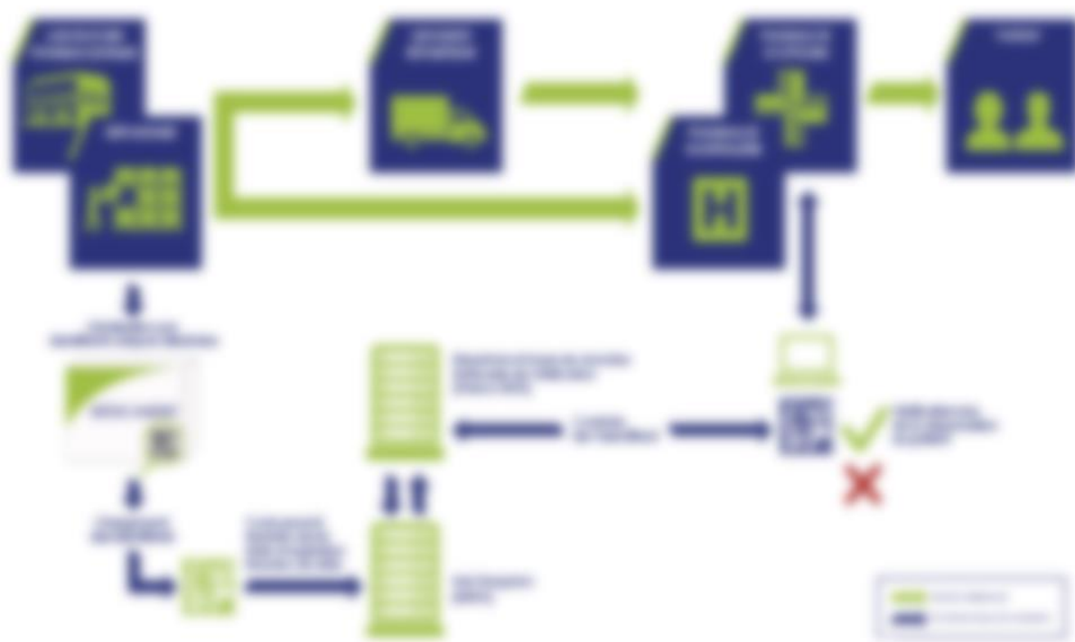
Figure 2 : Schéma de principe du flux de la sérialisation (28)

une association interprofessionnelle à but non lucratif, a été désigné pour être l'organisme de gouvernance sous le nom de France MVO. Le conseil d'administration de France MVO inclut des titulaires d'AMM, des grossistes-répartiteurs, des pharmaciens, et la Direction Générale de la Santé (DGS). France MVO a développé le répertoire national (NMVS) et gère les échanges de données avec le hub européen. Ce répertoire permet de vérifier l'authenticité des médicaments en comparant les identifiants uniques avec les données téléchargées dans l'EMVS. Les répertoires nationaux sont interconnectés pour permettre la vérification de médicaments délivrés dans un autre État membre. La figure 2 résume le flux de la sérialisation.