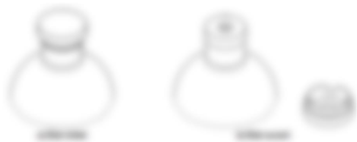
Figure 10: Exemple de fermeture déchirable (39)