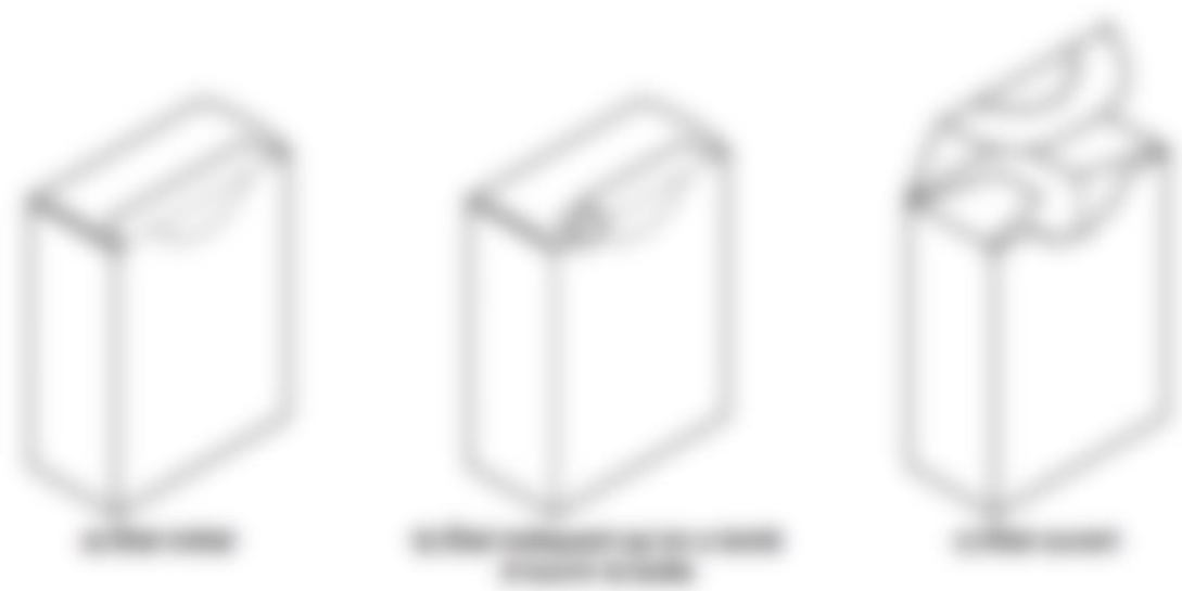
Figure 4 : exemple de boîte pliantes scellées par collage (39)

Ces boîtes pliantes peuvent inclure des perforations pour faciliter leur ouverture. Elles exigent d'être découpées ou déchirées pour accéder au produit, rendant impossible l'accès au contenu sans endommager visiblement une partie de la boîte pliante (figure 4).