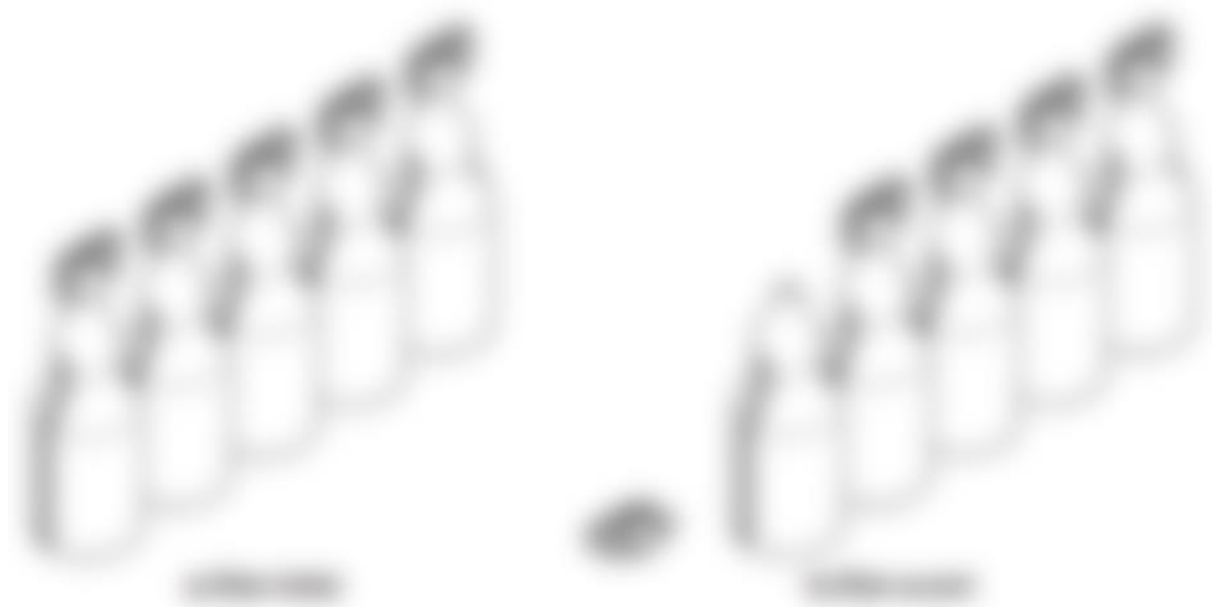
Figure 13 : Exemples de récipient à soufflage-remplissage-scellage (39)

Les récipients à soufflage-remplissage-scellage (SRS) sont des récipients en matière plastique qui sont formés, remplis et scellés de manière continue. Une fois ouvert, le récipient ne peut pas être refermé de manière sécurisée, et l'application de pression sur celui-ci provoque une fuite visible du produit (figure 13).