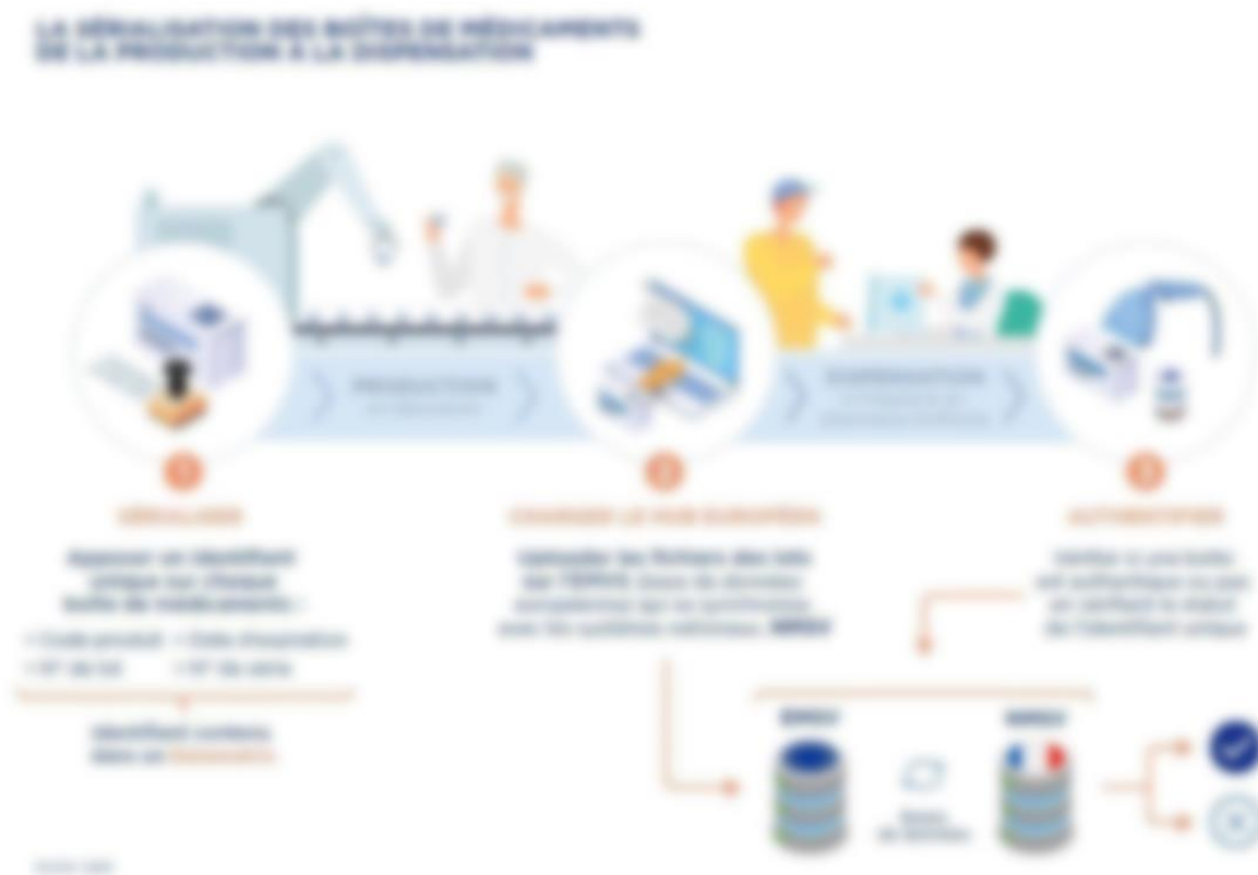
Figure 3 : Schéma de la sérialisation de la production à la dispensation (37)

En conclusion, tous les acteurs de la chaîne du médicament doivent collaborer et s'adapter pour mettre en œuvre efficacement les nouvelles mesures européennes liées à la sérialisation des médicaments.