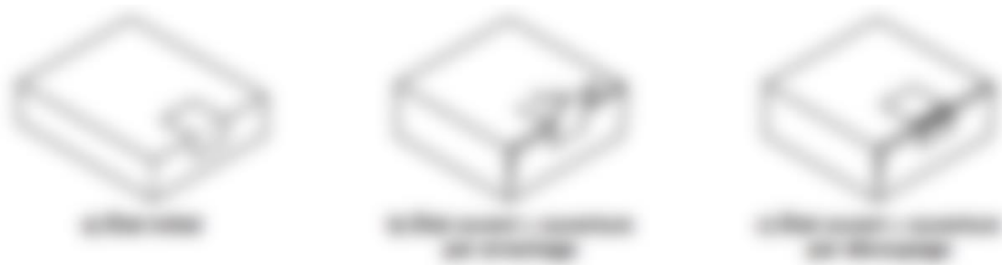
Figure 6: exemple de boîte scellée avec étiquettes ou ruban adhésif (39)

Ces emballages utilisent des étiquettes ou des rubans adhésifs pour sceller le médicament. Comme les boîtes pliantes fermées avec de la colle, ces emballages peuvent avoir des perforations pour faciliter leur ouverture. Tout acte d'effraction sur ces boîtes endommage de manière visible et irréversible le dispositif de scellage ou l'emballage du médicament (figure 6).