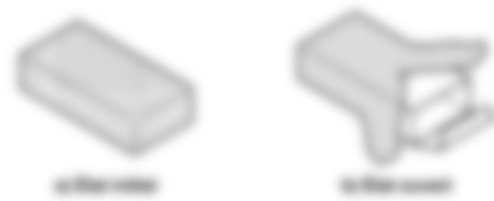
Figure 7: exemple de conditionnement secondaire enveloppé d'un film (39)

Dans ce type d'emballage, le conditionnement est enveloppé d'un film, partiellement ou entièrement, qui doit être déchiré pour accéder au produit. Après ouverture, le film ne peut être remis en place sans laisser de traces visibles d'effraction (figure 7).