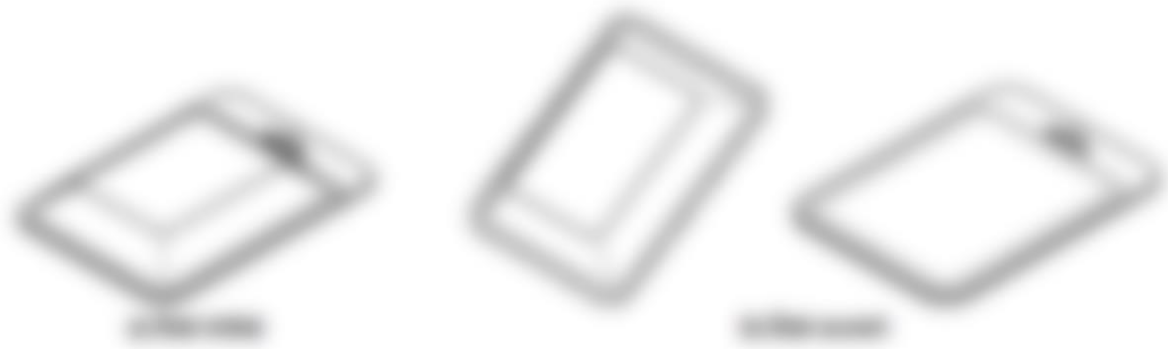
Figure 11 : Exemple de blister inviolable (39)

Les blisters sont des emballages où le produit est contenu dans une coque scellée tout autour. Pour accéder au produit, il est nécessaire de découper ou de rompre le blister (figure 11).