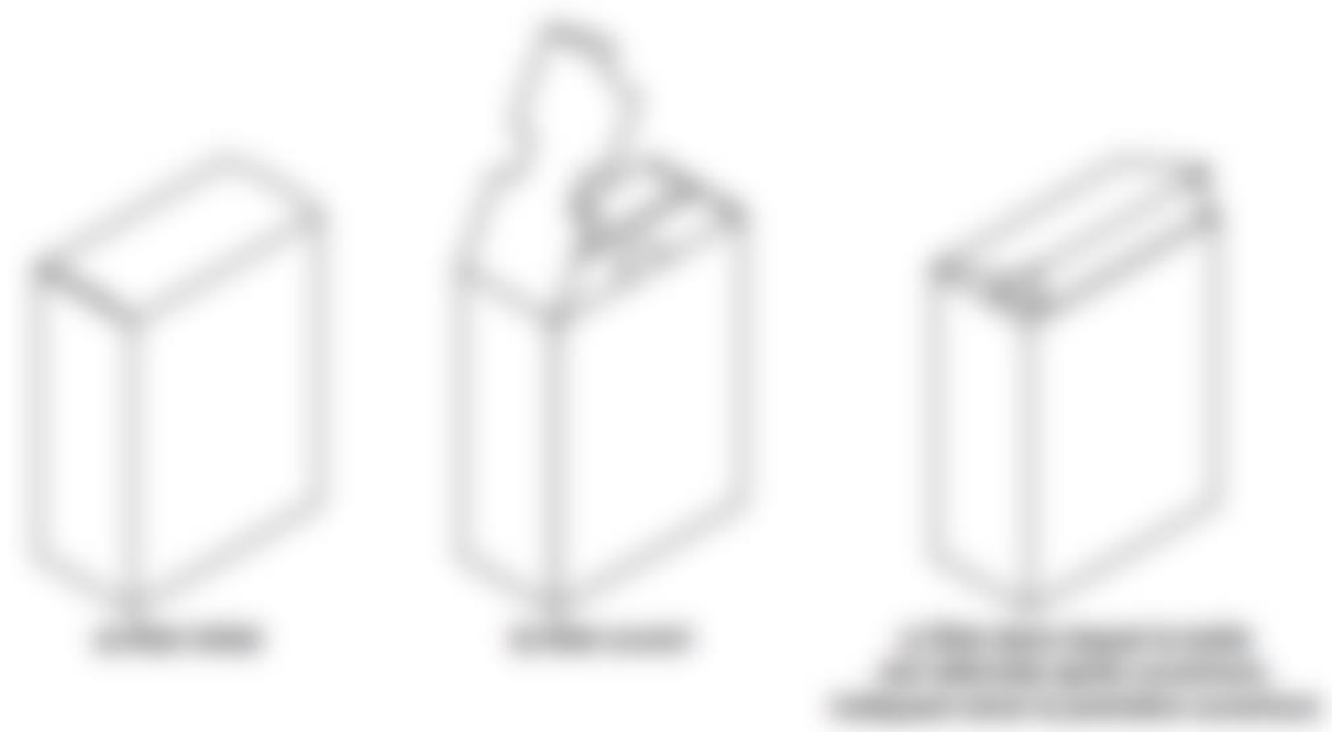
Figure 5 : exemple de boîte pliantes spéciale (39)

initiale de la boîte nécessite de déchirer ou d'endommager les rabats ou une partie du corps de la boîte (figure 5).